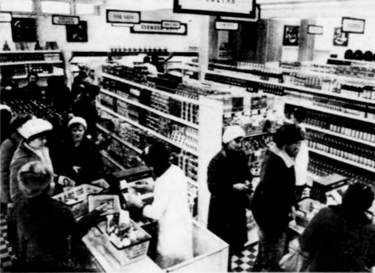
A nánási vásárlóközönség pénteken birtokba vette a város új ABC-áruházát

Péntektől újabb üzlet segíti Hajdúnánás lakóit a mindennapi bevásárlásokban. Az Ifjúság ABC — így nevezte el a Hajdú-Bihar megyei Élelmiszer-kiskereskedelmi Vállalat tegnap átadott boltját — mintegy 2 millió árukészlettel várja a vásárlókat.