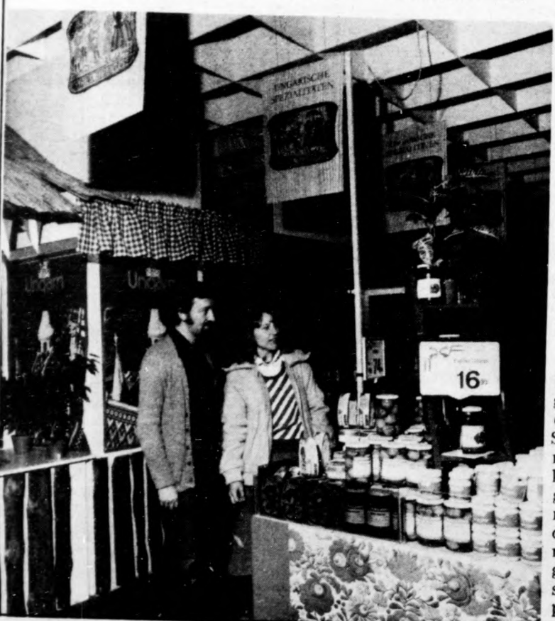
A bécsi „magyar napok” kiállítás élelmiszer-ipari bemutatója