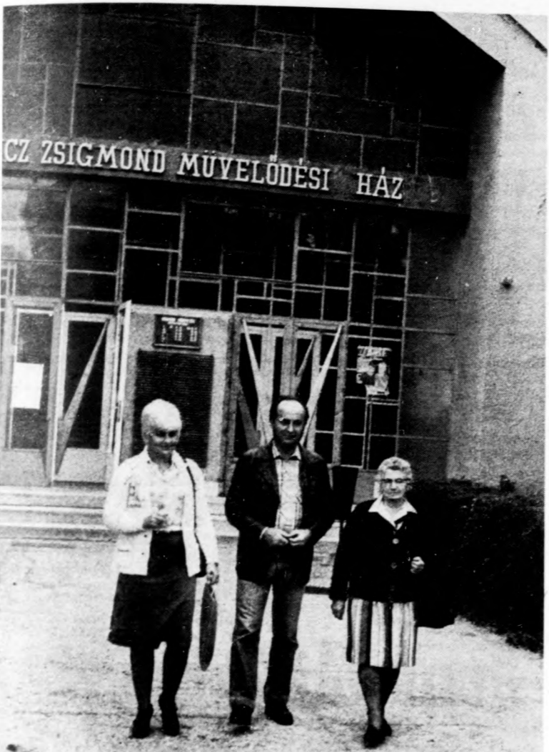
„Hárman tartjuk a frontot”