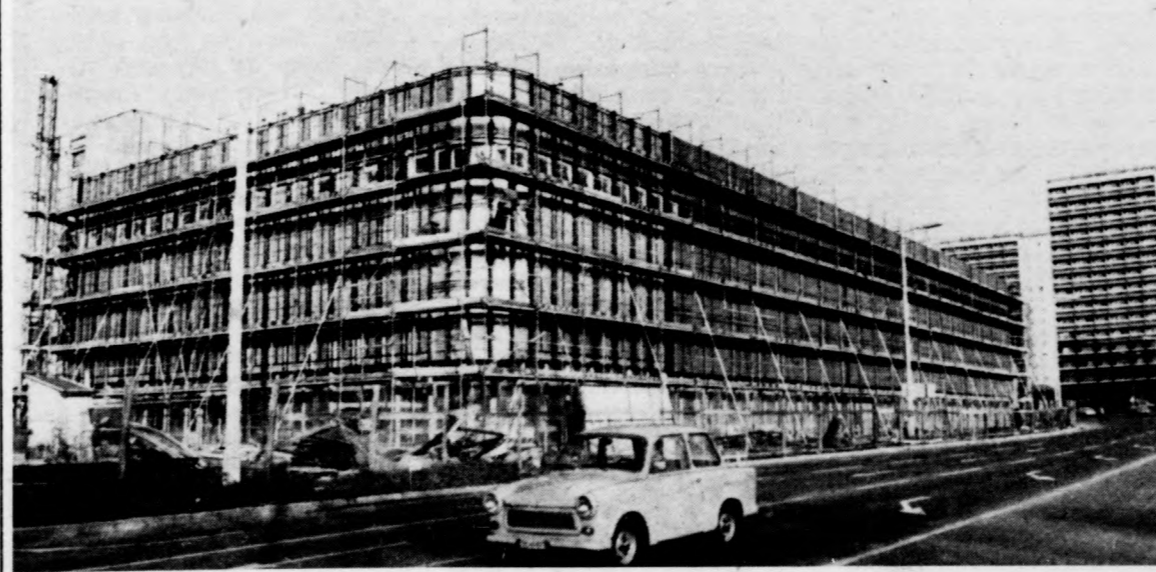
Az áruház külső burkolatát szerelik az építők

Továbbra is várat tehát magára az ország harmadik legnagyobb városához illő bevásárlóközpont felépítése.