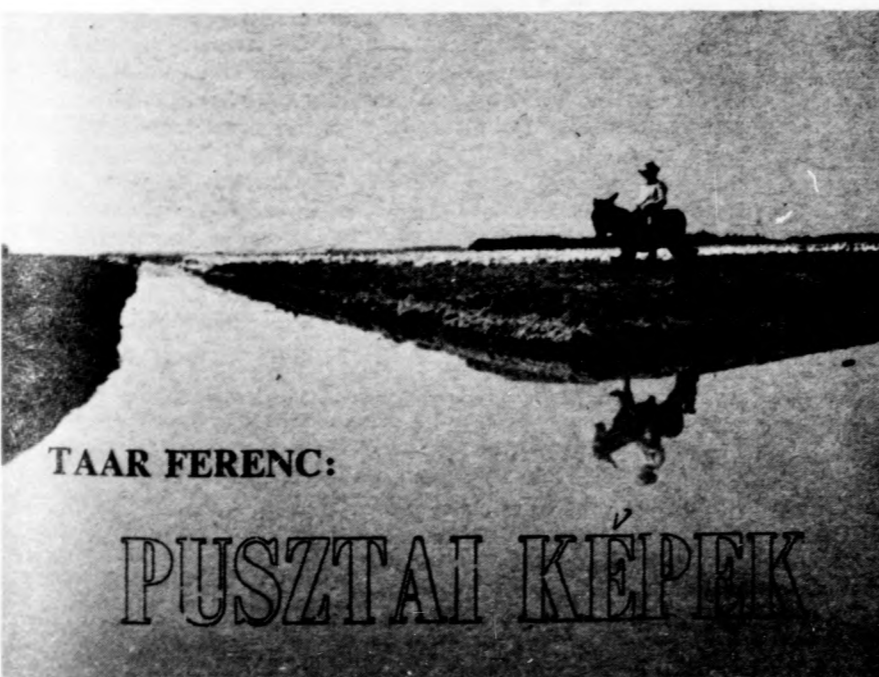
TAAR FERENC: PUSZTAI KÉPEK