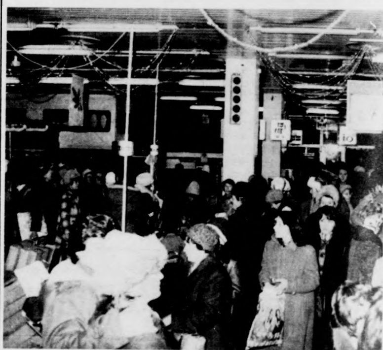
Ünnep előtti forgatag a debreceni Unió Áruházban