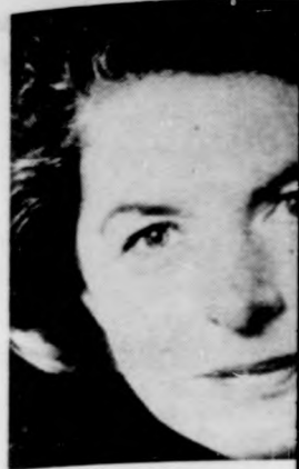
Ho Berg... nő Előz... terjü... Bun...