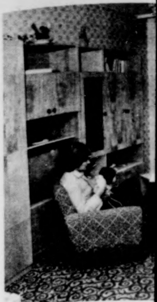
Az esztári Barta

A Közös Piac kormányainak célja: 1985-re átlagosan három százalékra csökkenteni a munkanélküliséget, kivihetetlennek látszik. Ehhez ugyanis a gazdaságok évi hétszázalékos növekedése lenne szükséges, miközben 1981-ben az NSZKban, Nagy-Britanniában, Franciaországban és Olaszországban mindössze 0,5 százalékos volt a gazdasági növekedés, s a kilátások jövőre sem jobbak.