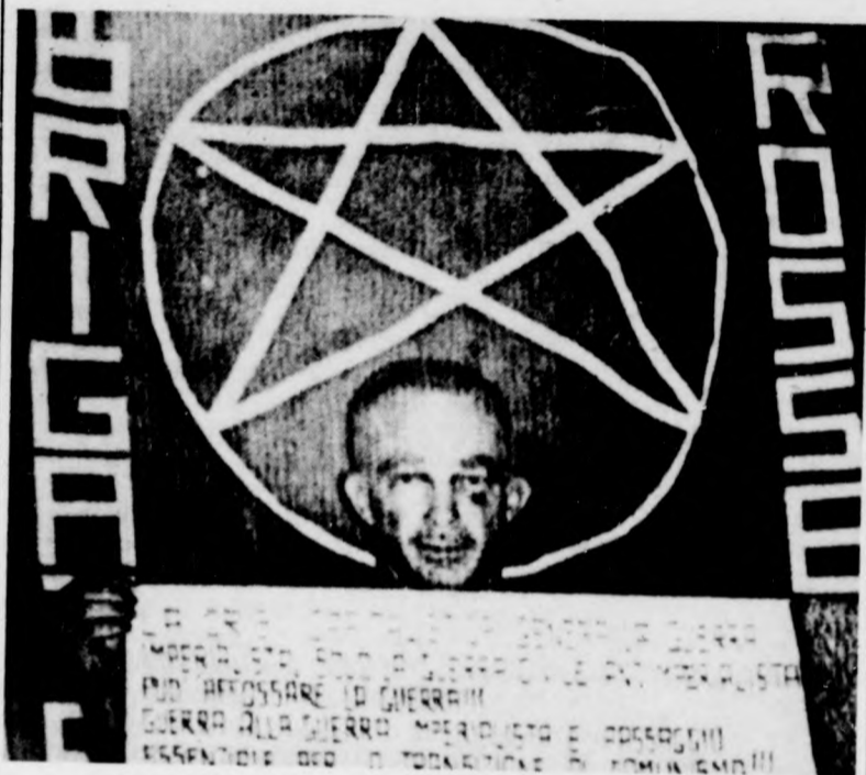
Dozier tábornok a „Vörös brigádok” terrorszervezet üzenetével.

Az észak-olaszországi Aostában letartóztattak három embert, akinek köze lehet Dozier amerikai NATO-tábornok 11 nappal ezelelti elrablásához. Az olasz televízió hétfői híre szerint egyébként a rendőrség úgy véli, hogy a Dozierről a „Vörös Brigádok” közzétette fénykép hamis. Rendőrségi források a vasárnap megtalált fotó eredetiségét főképpen azért kérdőjelezték meg, mert nem ugyanazt a polaroid fényképpapírt használták a képek elkészítésére, mint amit a „Vörös Brigádok” korábban használt, amikor foglyairól felvétel készített. A rendőrség véleménye szerint a beállítás sem tűnik természetesen; ezért is gyanítja, hogy fotómontázsról van szó.