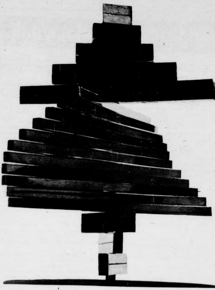
SPIRÁL (1978)