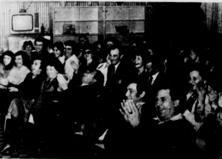
A közönség a Volán sóstói üdülőjében felvételkor

getés egy angol történezzel. 20.50 Tv-híradó 2. 21.10 Krimiben tudós. Keresd a tettest! 22.20—22.55 II. nemzetközi mozgásház találkozó. Budapesti Műszaki Egyetem, 1981. POZSONY, 1. műsor 8.55 Hírek. 9.00 A rendőrség nyomoz. 9.05 Tévéjáték (ism.). 10.05 Cseh rajzfilm. 11.15 Publicisztika (ism.). 11.55 Német nyelvtanfolyam. 12.35 Hírek. 12.45 Hírek. 15.30 Dokumentumfilm. 16.25 Nyugat-szlovákiai magazin. 16.55 Portréfilm. 17.15 Színházi közvetítés. 18.15 Katonák műsora. 18.30 Magazin. 19.10 Esti mese. 19.30 Tv-híradó. 20.00 Különleges beosztás (francia tévésorozat). 21.25 Dokumentumrport. 21.50 Huszonegy óra a világban. 22.05 Komoly zene. 22.50 Hírek. POZSONY, 2. műsor 16.20 Híradó. 16.25 Autók és emberek (francia filmsorozat). 17.30 A „Camerata Slovacca” muzsikái. 18.15 Fiatalok tévéklubja (közben 19.30 Tv-híradó). 21.15 Aktualitások. 21.45 Az utolsó nap (tévéjáték). A NYÍREGYHÁZI RÁDIO MŰSORA 17.00 Hírek. Időjárás. Lap-szemle. 17.05 Lemezspoic. 17.15 Egészségünk. Dr. Baráz Sándor előadása a fejtájszról. 17.20 A Santana együttes műsora. 17.30 Huszon innen, huszon túl. Ráporter: Pálfi Balázs. 18.00 Észak-tiszántúli kronika. 17.15 A Color együttes slágereiből. 18.25—18.30 Hírosz-szefoglaló. Műsorlevezetés.