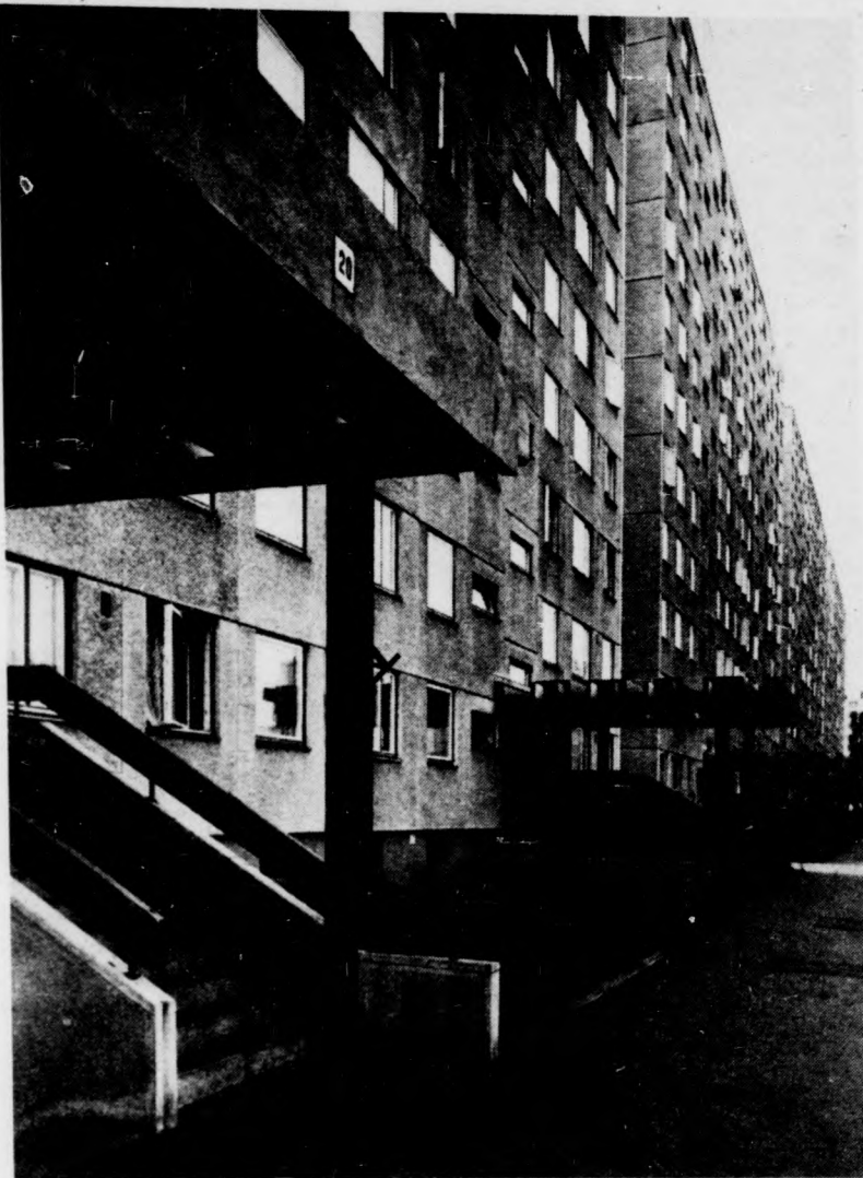
Lakótelepi utcarészlet.

A gyes-en levő kismama, s az öregek elmagányosodása, a lakóhelyi együttélés családokra töredezése mind szűli a hol tévova, hol világosabban kifejezett igényt valamifajta közösségre. A közösség, amennyiben nem közvetlen, hanem közvetlen, úgy természetesen helyet is igényel, valamilyen (részben nyílt) teret. Például klubokat, ahol