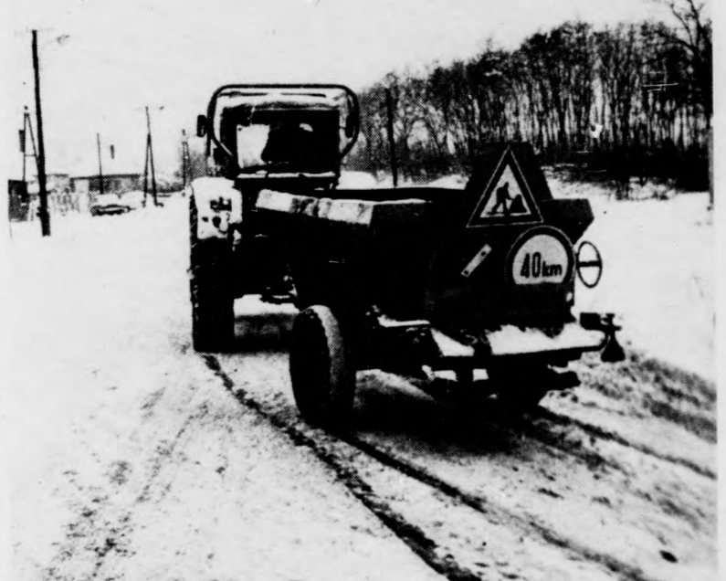
A valamivel enyhébbre fordult időjárás következtében január 12-én ismét sózhatták az utakat, a reggeli ónos eső viszont pillanatok alatt az úttestre fagyott

A tegnap délutáni állapotokat figyelembe véve elmondhatjuk, hogy a megye főútjai ugyan járhatók voltak, de sok helyütt havas szakaszok nehezítették a közlekedést. A mellékutak java része havas, síkos volt. A Debreceni Városgazdálkodási Vállalat hóügyeletén elmondták, ha a havazás