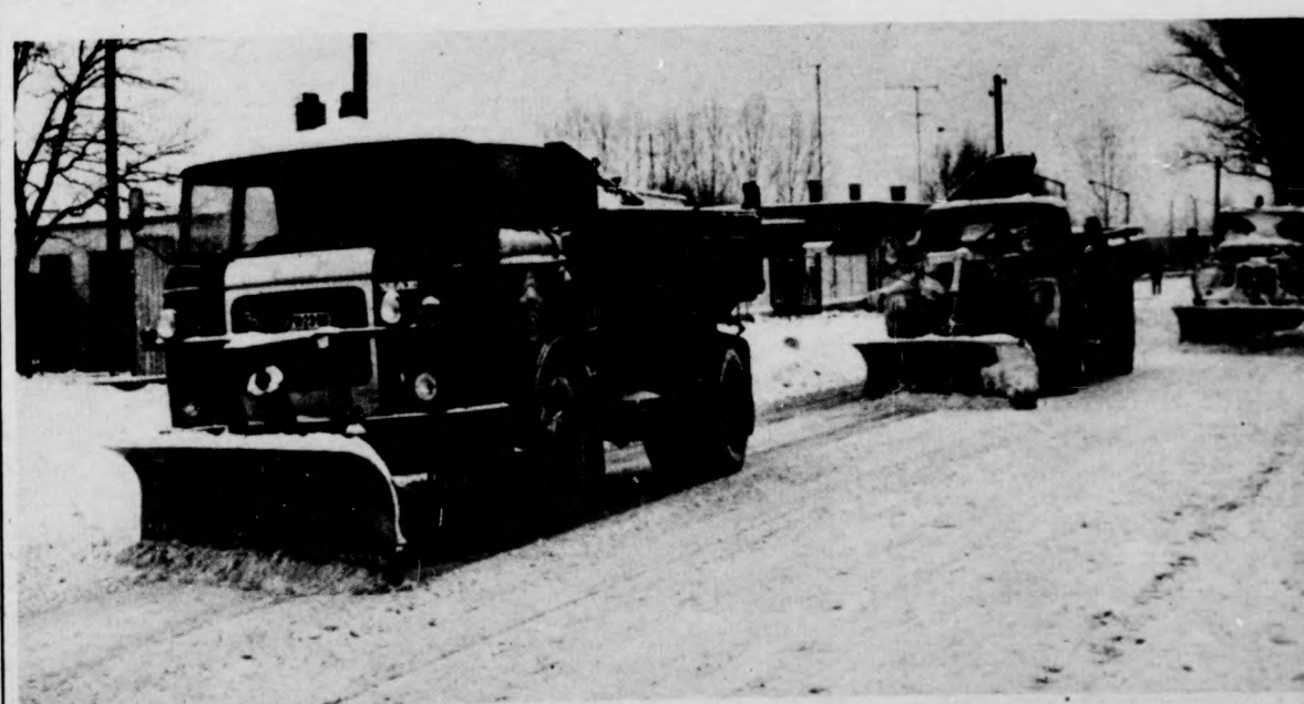
Munkában a KPM Debreceni Közüti Igazgatóságának hóeltakarító gépei

lekedők a főútvonalakon is találhatták az elmúlt hetek, napok során kátyúkat. Az újonnan keletkezett útmelegbírádások kijavítását a Közüti Igazgatóság szakemberei január 4-én megkezdték. Ezen munkálatok végzésére a szükséges kátyúzó anyag — elsősorban öntött aszfalt formájában — rendelkezésre áll. A hideg idő