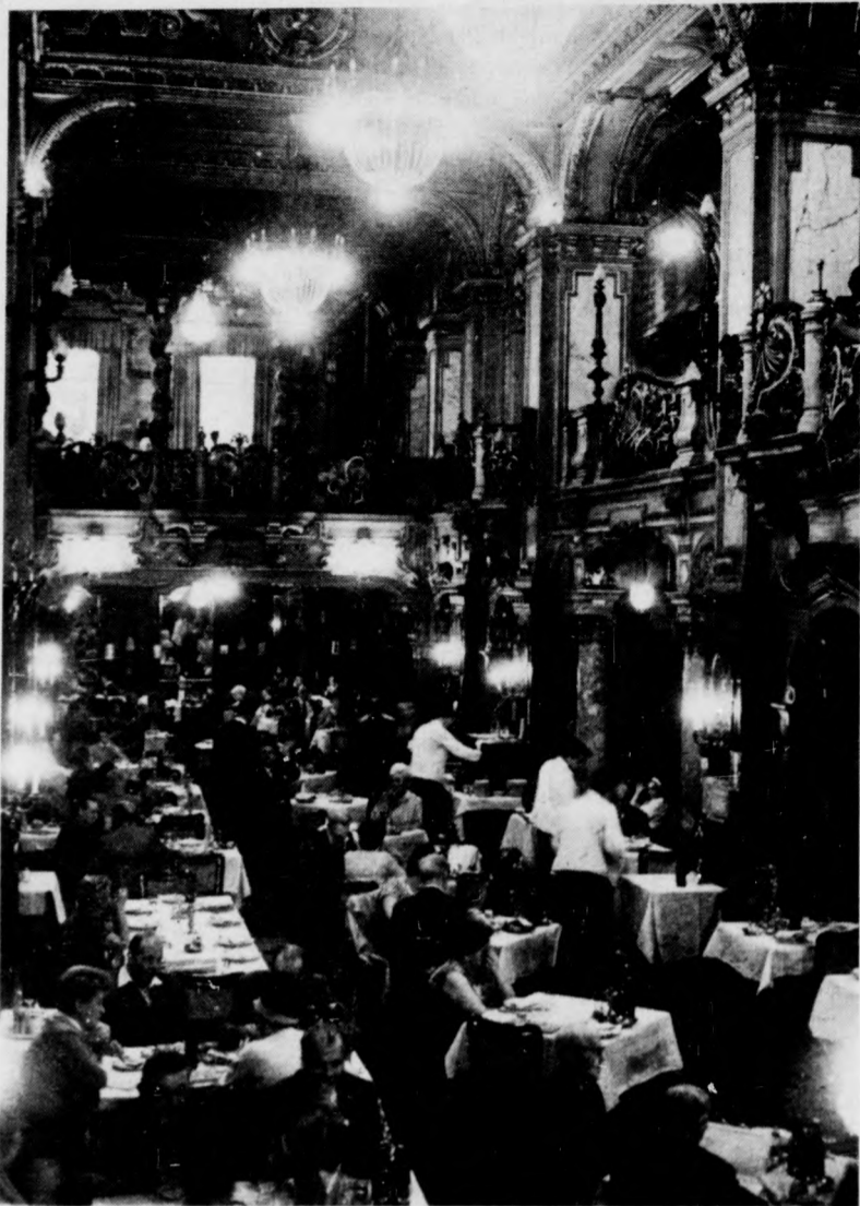
Belső részlet a New York kávéházban