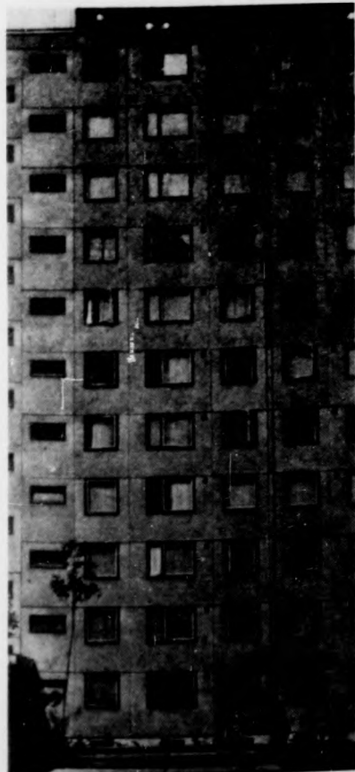
Ember és ház

Érdemes lesz a klubokat információs központként is felszerelni, beszerezni a busz-és vonatmenetrendeket, telefonkönyvet, kirándulóhelyek jegyzékét, utazási irodák prospektusait, hivatalok, gyógyszertárak, orvosi rendelőik cím- és telefonjegyzékét, üzletek címét, szolgáltatók, kisiparosok, szervizek címét és profil-jegyzékét, közéleti aktualitásokra vonatkozó információkat (tanácsadáslásztás, te-