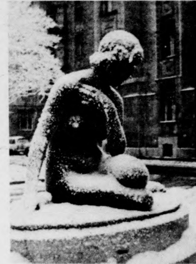
TÉLI VARÁZSLAT (4. oldal)

ISKOLÁSKORBAN — ÉS UTÁN DEBRECENNEK VAN EGY VIZE ELEKTRONIKAI FEJLESZTÉSI PROGRAM (3. oldal)