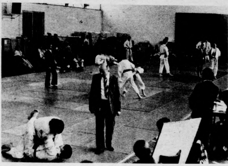
Négy tatamin folyt a junio rok versenye