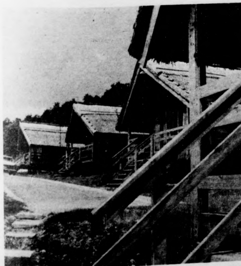
A hárshegyi kemping