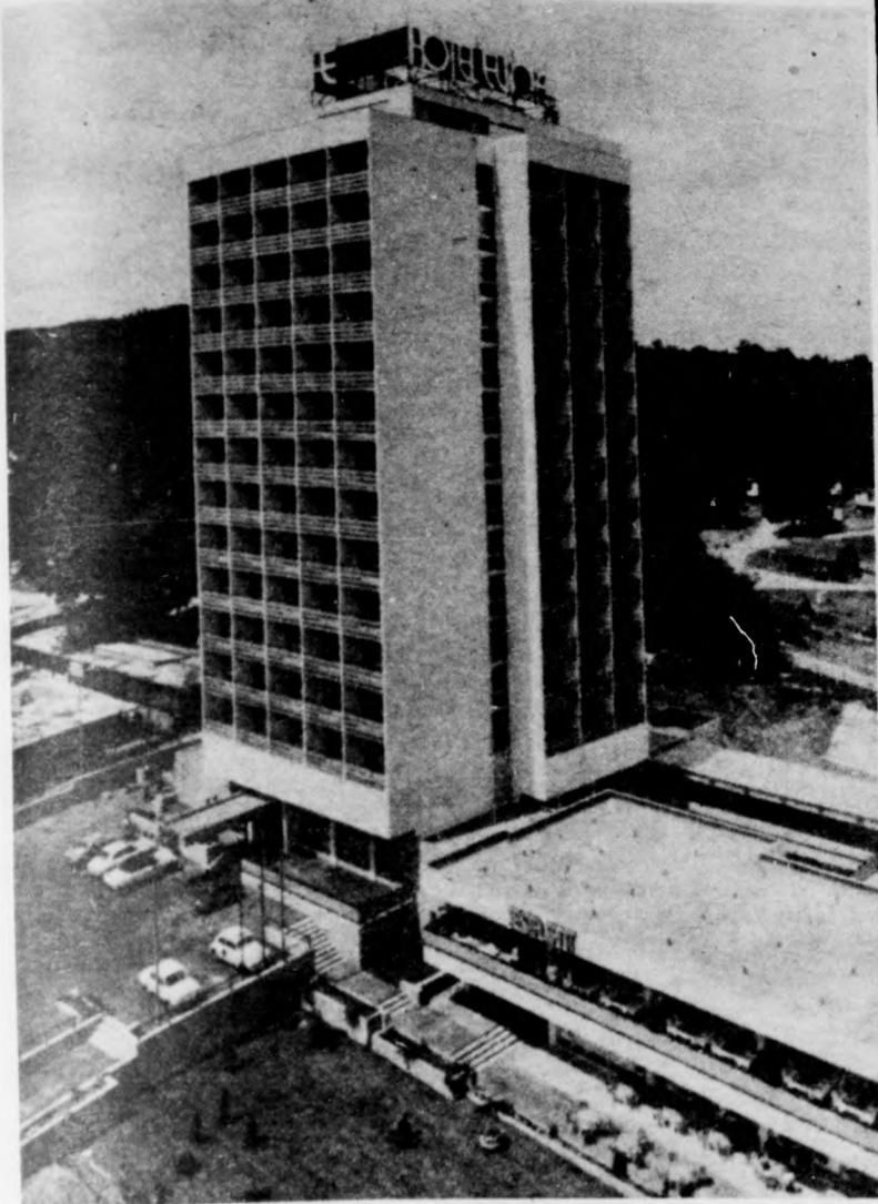
Az Európa Szálló