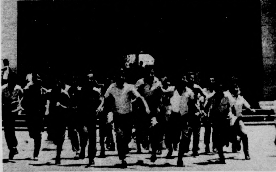
Nincs gond az utánpótlással: 11 év alatt 1 137 248 fővel nőtt az ország lakossága

Az adatok feldolgozása még tart. A végleges eredmények alapján dolgozzák majd ki az ország 1986—1990-ig szóló harmadik öt-éves tervét, csakúgy mint az ezredfordulói terjedő gazdasági és szociális fejlesztési terveket.