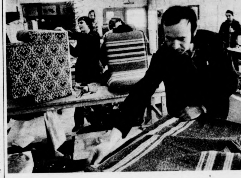
H. I. A kárpitok választéka 1982 -ben tovább bővül

A bútorgyár gyártmányfejlesztőinek feladata, hogy olyan bútor típusokat tervezzenek, amelyek új színfoltot jelentenek majd az Otthon 83 kiállításán. Az év eleje még sok problémát hozott a gyárnak: évről évre visszatérő gondjuk, hogy nehéz pontos határidőre szóló szállítási szerződéseket kötni. Remélhetőleg ez a második negyedévben megváltozik. Gondot okoz még a vállalatnak az is, hogy több alkatrészt, bútorhoz való tartozékot importból kell beszerezni, s a beszerzés is sokszor nehézkes.