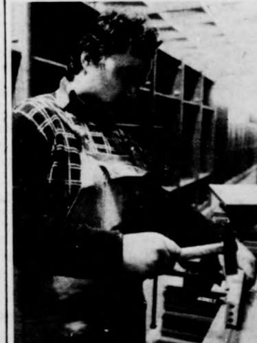
Sarokpánt felillesztése az ajtóra

A fiókkönyvtárak egy része folyamatosan, más része ebédszünettel, harmadik csoportja pedig délutáni nyitva tartással üzemel.