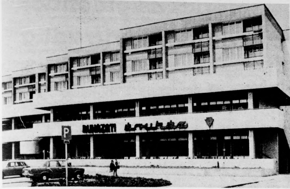
A legújabb egység: a hajdúnánási Kisáruház