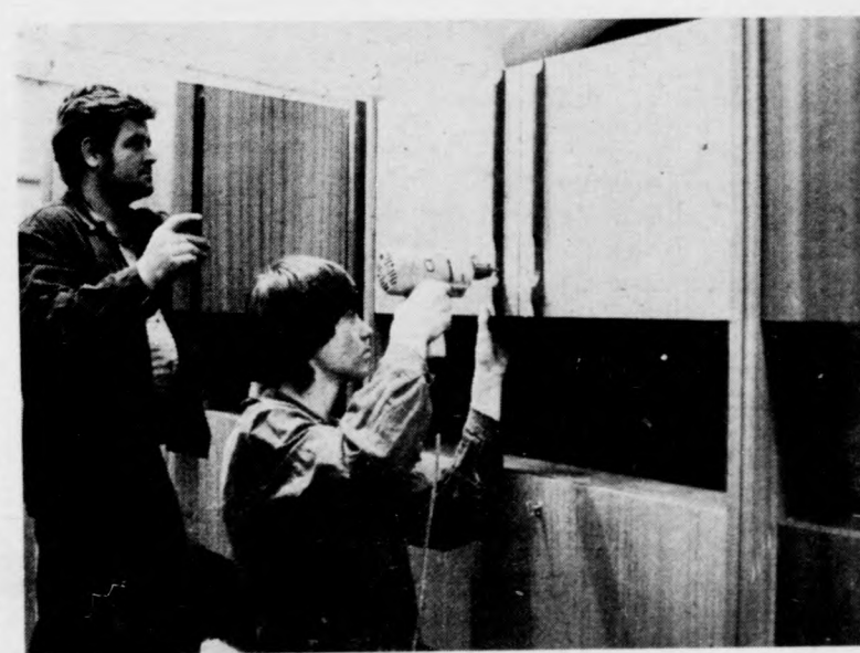
A diszítőelemek felszerelése nagy figyelmet igényel

vevőköre is. De ez annak is köszönhető, hogy bevezették a többcsatornás értékesítést: kaput nyitottak a kiskereskedelmi vállalat és a lakosság felé.