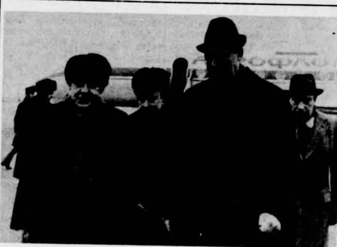
A „Moszkvai napok Budapesten” eseménysorozatára hétfőn politikai delegáció érkezett Budapestre. Képünkön: a szovjet küldöttség vezetőjét, Viktor Grisint, az SZKP PB tagját, a moszkvai pártbizottság első titkárát, a Ferihegyi repülőtérén Maróthy László, az MSZMP PB tagja, a budapesti pártbizottság első titkára fogadta

A vitaindító után a fórum résztvevőinek kérdéseire válaszoltak a különböző kereskedelmi szervek képviselői.