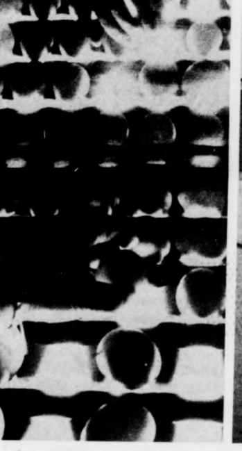
... ahol gyorsan kiderül, melyik a törött, sérült tojás

A nádudvari Vörös Csillag Termelőszövetkezet derecskei keltetőüzemében évente több millió úgynevezett hibry-végtermék-napocscibéi keltetnek. Az idei tervek szerint tizennygy és fél millió aprócsirkét szállítanak tovább nevelésre elsősorban a Hajdúsági Agráripari Egyesülés baromfi-nevelő telepeire: Földesre, Nagyhegyesre és Balmazújvárosra. Kétféle kiscsirké a püspökkladányi November 7. és a hajdúnánási Új Élet termelőszövetkezetek nevelőházaiba kerül mintegy négy és fél millió pedig a baromfi-feldolgozó vállalat akciója keretében a különféle tsz-ek keretében működő kisüzemekben nevelnek fel. Felvételeink a derecskei keltetőállomáson készü-