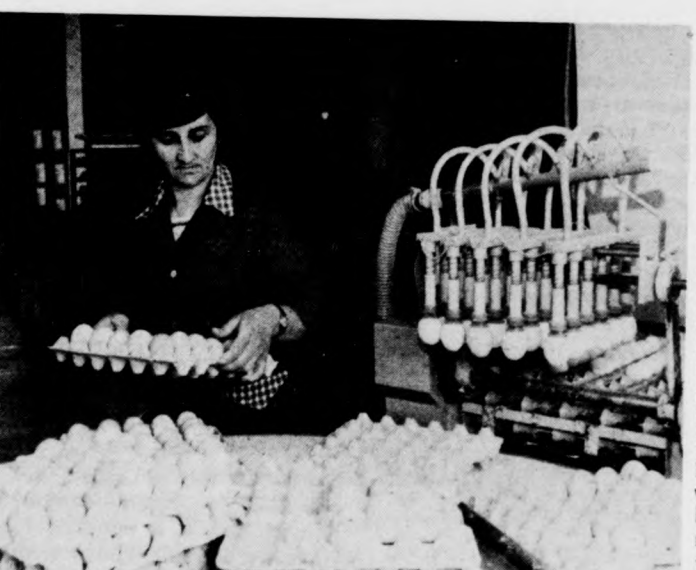
Vákuumos emelő továbbítja a tojásokat az átvilágítóba.

A nádudvari Vörös Csillag Termelőszövetkezet derecskei keltetőüzemében évente több millió úgynevezett hibry-végtermék-napocscibéi keltetnek. Az idei tervek szerint tizennygy és fél millió aprócsirkét szállítanak tovább nevelésre elsősorban a Hajdúsági Agráripari Egyesülés baromfi-nevelő telepeire: Földesre, Nagyhegyesre és Balmazújvárosra. Kétféle kiscsirké a püspökkladányi November 7. és a hajdúnánási Új Élet termelőszövetkezetek nevelőházaiba kerül mintegy négy és fél millió pedig a baromfi-feldolgozó vállalat akciója keretében a különféle tsz-ek keretében működő kisüzemekben nevelnek fel. Felvételeink a derecskei keltetőállomáson készü-