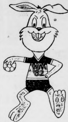
A világbajnokság csoportbeosztása.

A csoport: Szovjetunió, NSZK, Csehszlovákia, Kuvait. — B csoport: Magyarország—Spanyolország, Svédország, Algéria. C csoport: NDK, Lengyelország, Japán, Svájc. D csoport: Románia, Jugoszlávia, Dánia, Kuba. Minden csoportból három együttes jut a középdöntőbe, ahol az A és a C selejtezőcsoport továbbjutói alkotják az újabb mezőnyt, a B és a D selejtezőcsoport legjobbjai a másik középdöntőt, az egymás elleni eredményeket a selejtezőkből magukkal viszik a csapatok. A körmérkőzés végén az azonos helyen végzett csapatok vívják a helyosztókat.