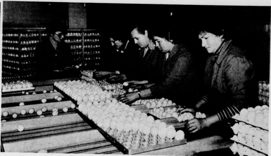
Súly szerinti osztályozás