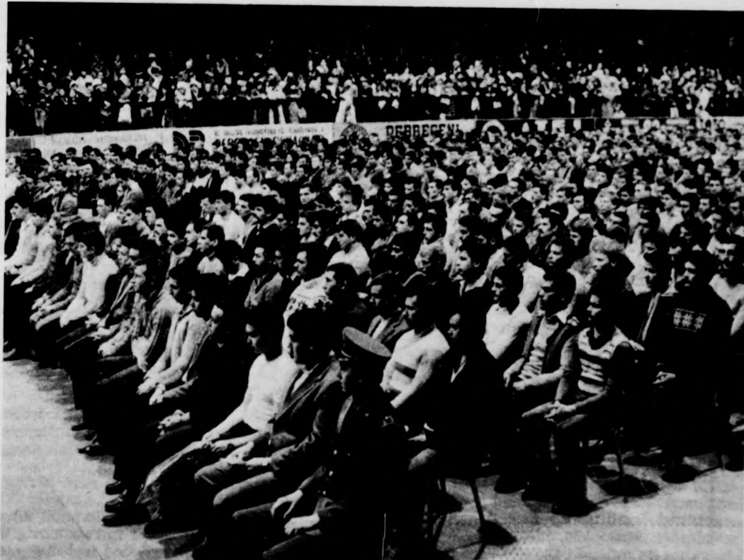
Nagy figyelemmel hallgatták az elhangzó szavakat a sorkötelesek