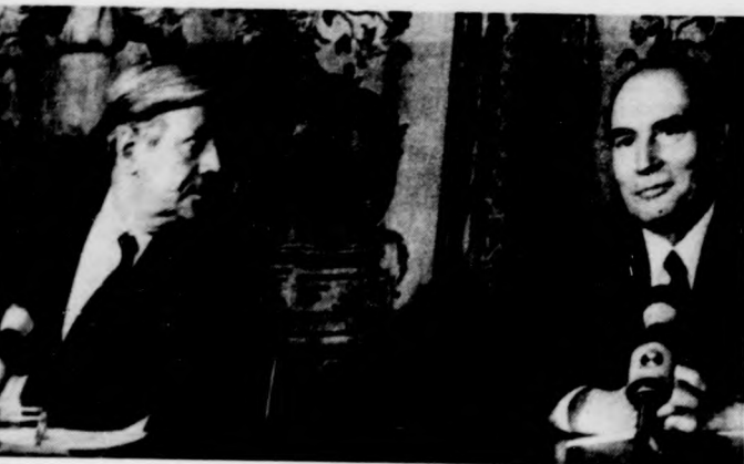
Helmut Schmidt, az NSZK kancellárja és François Mitterrand francia elnök a párizsi Elysée-palotában sajtókonferencián számolt be a 39. francia-nyugatnémet csúcstalálkozóról.

A közös piaci bizottság — jelentette be csütörtökön a szöszívő — mintegy száz terméket jelölt ki, amelyek behozatala 1980-ban összesen 830 millió ecut (1 milliárd dollárt) tett ki. A korlátozás az 1980. évi behozatal 50 százaléka, ami a közös piaci országokba irányuló teljes szovjet kivitel mintegy 4 százaléka teszi ki. 1980-ban a Szovjetunió 10,8 milliárd ecut (13 milliárd dollár) értékben exportált az EGK-ba, főként olajat, földgázt, vasércet és egyéb nyersanyagokat, kisebb mértékben gépeket és vegyipari termékeket. Ugyanabban az évben a közös piaci kivitel a Szovjetunióba 7,5 milliárd ecut (9