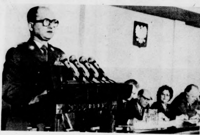
Wojciech Jaruzelski hadseregparancsnok, a LEMP KB első titkára, lengyel miniszterelnök a LEMP KB hetedik plenárius ülésén beszél.

A felszólalások során javaslat hangozott el arról, hogy a hetedik plénum határozza-