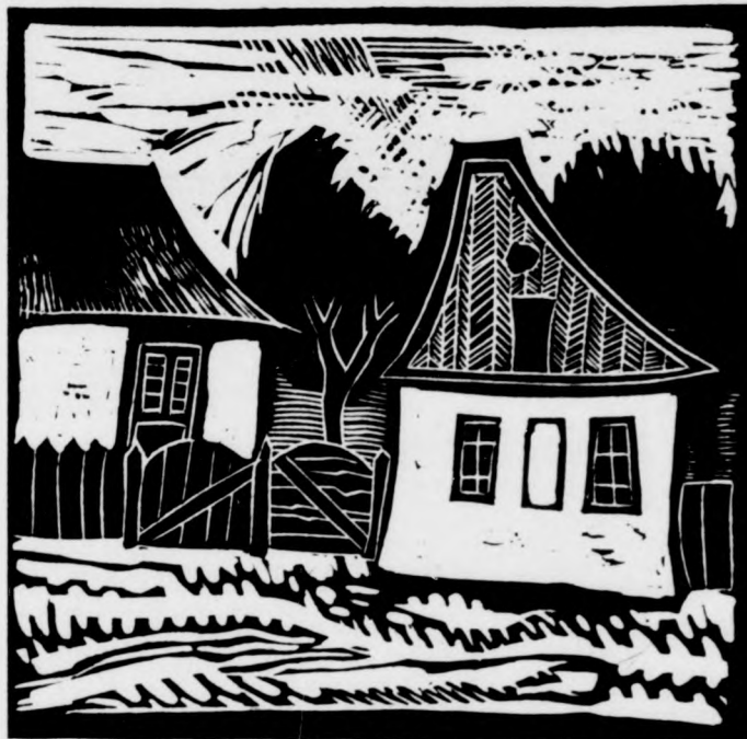
FALUSI HÁZAK (GONDA ZOLTÁN GRAFIKÁJA)

Egyszer, régen, amikor tek róla. Csalhatatlanabb úgy láttam, hogy a sűrű, tej-füls ködből, a reggelre új-mint a bizonytalan fajtájú ra és újra bezúmarásodó madár erős hangja, s föld mélyéről, a faágak, vesszők még fagyaszan szű-lö bőre alól mégiscsak elő-bújtt végre a tavasz, akkor, egy reménykedő séta után felelőtlenül megirtam: a le-tarolt, az új lakótelep épít-kezéseikhez előkészített erdő-széli részekben határozottan hallottam a kakukk tavaszi kiabálását. Rövidesen levelet kaptam, melyben egy kedves olvasó közölte velem, hogy tavaszi bódultság ide vagy oda, ilyen állítást csak rendkívül hiányos ormitoló-giai ismeretekkel rendelkező ember tehet: amit én ka-kukknak véltém, jó eset-ben is vadgalamb lehetett.