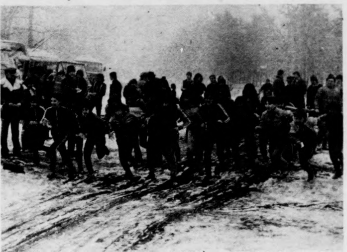
Nagy mezőnyök vetélkedtek a Nyiradonyban rendezett tavaszi mezői futóversenyen. Felvételünk az 1968-ban született leányok rajtját örökítette meg.

A vidéki diáksportkörök részére kézilabda terembaj-