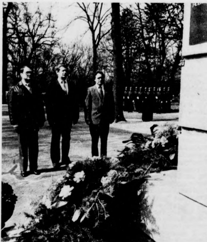
A debreceni szovjet főkonzulátus munkatársai a szovjet hősi emlékmű előtt