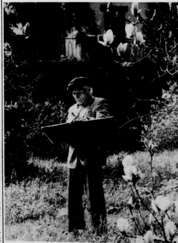
Szepes Gyula festőművész