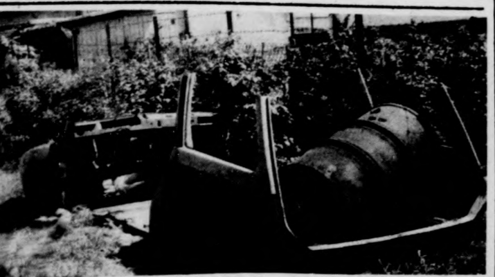
Debrecenben, a Galamb utca 6. szám alatti telek mellett levő üres területre tették a képen látható kocsisroncsot több hónapja. Azóta a kocsit mellé egy horzó is került. Szembetűnő a kocsisroncs az üres területen?

A tettesek eddig még ismeretlenek, de reméljük, nem sokáig. Felkutatásukhoz kérjük a lakók segítségét, azt, hogy a fedlapokat elvittöket jelentsek a Víznyű Vállalat ügyeletének (telefon: 20-686), vagy a városi tanács építési és közlekedési osztályának. Az elkövetők ellen szabálysértési eljárást kezdeményeznek, s a büntetés 10 ezer forint. Bizunk benne, hogy ez elég nagy összeg ahhoz, hogy ezt az érthetetlen lopást megfékezzék.