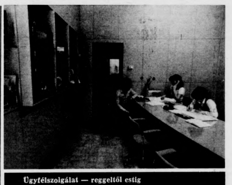
Ügyfélszolgálat — reggeltől estig

A robottechnika alkalmazásában a KGST-országok közül a Szovjetunió és az NDK ipara jóval előbbre tart a miénkénél; ők elsősorban auto-