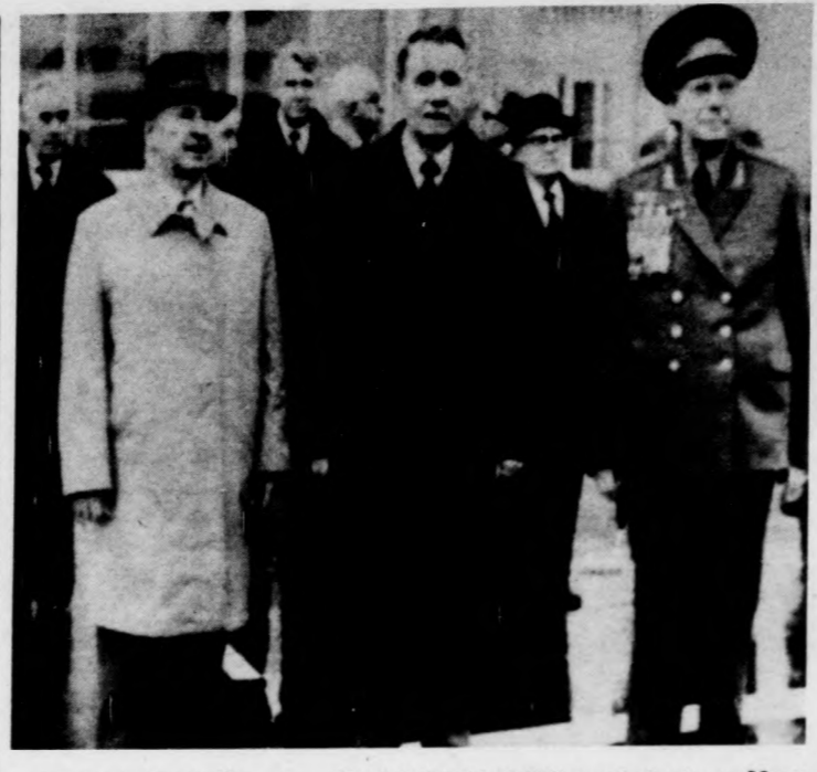
Andrej Gromiko, a Szovjetunió külügyminisztere New Yorkba utazott, hogy részt vegyen az ENSZ renkívüli leszerelési ülésén...