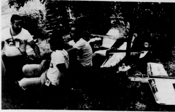
Lengyel modellezők és modellek pihenője az árnyékban