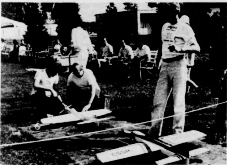
Előkészítés a startra

Szabálytalanság esetén a bírói toronyban kigyullad a kék (figyelmeztető) fény, előfordult, hogy kizárást — pilóstat — mutatott a lámpa. Érdekes volt a háromnapos debreceni verseny. A vendéglátók mindent elkövezték, hogy a hírneves modellezők „világbajnoki körülmények között” edzhessenek, versenyezzenek, jól érezzék magukat Debrecenben.