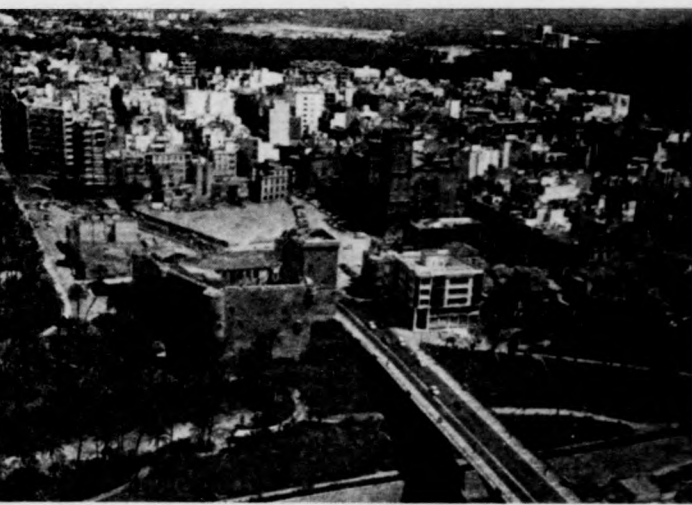
A tengerparti Alicántól 23 kilométerre, a festői Elche városában vívja a salvadoriak és a belgák elleni csoportmérkőzést a magyar labdarúgó-válogatott

Szóval, akinek van pénze, az élvezze ezt a kiemelt kategóriát. De a focirajongók tízezrei — Spanyolországban és külföldön — nem ehhez az osztályhoz tartoznak. Őket az ún. „csomagajkáló” sújtja. Lényege, hogy a szervezők a jegyeket összekapcsolják a szállással, az ellátással. S mivel Mundial van: dupla vagy ennel is magasabb szállodai árakkal. A legfrissebb jelentések szerint a szervező bizottságban már „megbomlott” az egység, úgy tűnik, ez a mindénáron pénzszerzés szisztema nem válik be. Ugyanakkor Raimundo Sa-