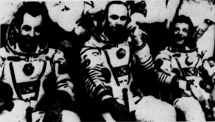
Visszatért a szovjet-francia úrexpedíció. — Arkalik város térsége, Kazah SZSZK, Szovjetunió: Alekszandr Ivancsenkov és Vlagyimir Dzsanyibekov szovjet és Jean-Loup Chretien francia űrhajós, a Szojuz-T-6 űrhajó legénysége, földvel földet érintés után

mény és kíméletlen kampányát: a héten például Washingtonban elutasították azt a tokiói kérést, hogy mentesítsék a szovjetellenes amerikai gazdasági intézkedések hatása alól a szahali szovjet-japán közös kőolaj- és földgázkitermelő vállalkozást. Az amerikai szabadsalom alapján gyártott japán fűróberendezéseket nem engedi az USA a Szovjetunió számára leszállítani — erről maga Reagan elnök tájékoztatta levélben Szuzuki japán kormányfőt.