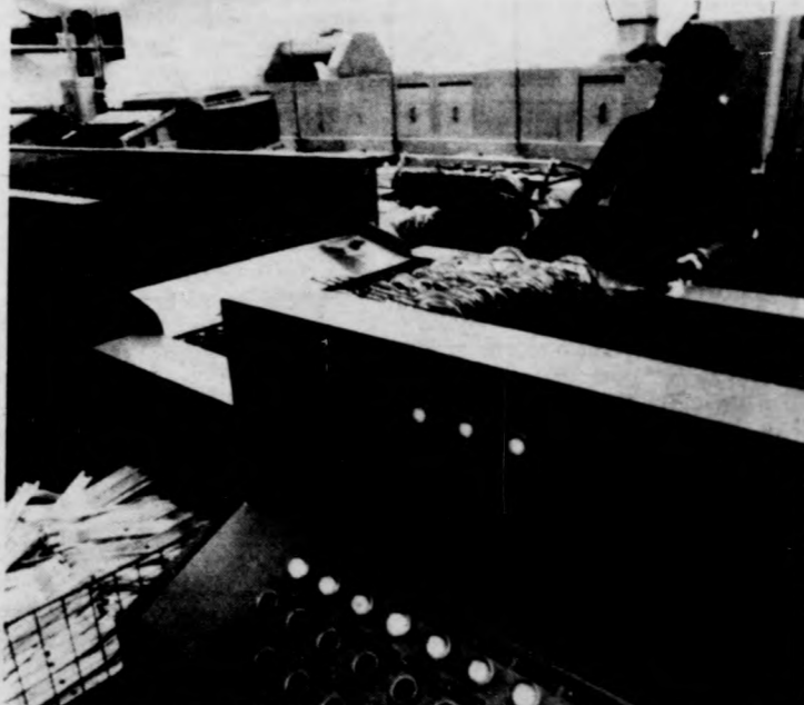
A TAUS cég berendezése