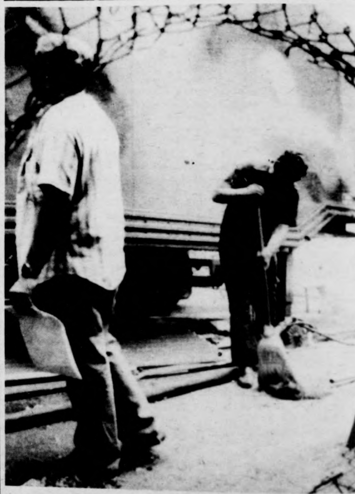
Pokolgépes merényletet követtek el az NSZK-ban állomásozó amerikai csapatok majna-frankfurti főhadiszállása ellen. Elakarják a színhelyről a robbanás nyomait

Dmitrij Usztyinov marsall, a Szovjetunió honvédelmi minisztere fogadta Krisna Rao tábornokot, az Indiai Köztársaság vezérkari főnökeit egyesített bizottsága elnökét, a hadsereg vezérkari főnökét. A felek a baráti megbeszélésen áttekintették a kölcsönös érdeklődésre számot tartó kérdéseket.