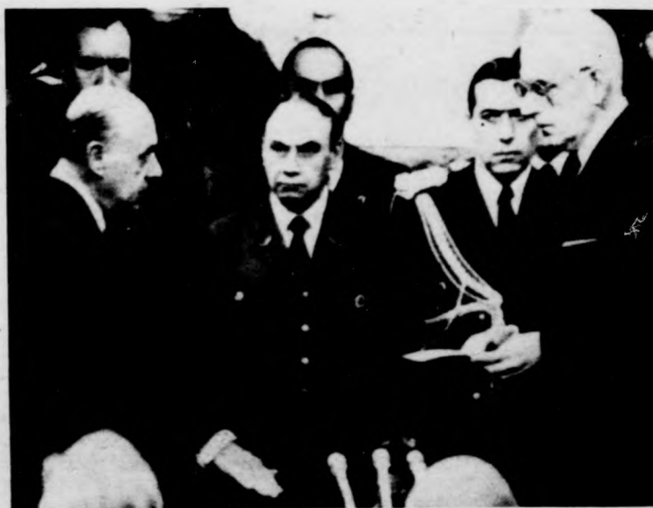
Az új argentin külügyminiszter, Juan Aguirre Lanari (balra) leteszi a hivatali esküt, Reynaldo Bignone, az új argentin elnök előtt

A Reagan-kormányzat ugyanakkor folytatja ke-