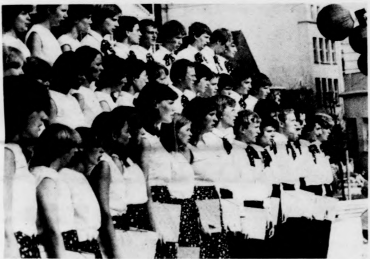
Harmadszor vesz részt a kórusversenyen a wernigerodei rádió gyermekkórusa (NDK)

Holnap pedig megkezdődik a kórusverseny első munkanapja: a Kölcsey Művelődési Központ színháztermében 9 órától a vegyes karok elődöntőjét, 14 órától a gyermekkarok döntőjét, 17 órától a kamarakórusok elődöntőjét, 20 órától a férfikarok döntőjét tartják meg. Mint a felsorolásból kitűnik, ezúttal elmaradnak az esti hangversenyek; ezek az időpontokban a döntőket bonyolítják le.