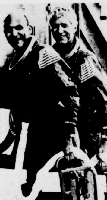
Negyedik próbautját hajtotta végre az amerikai űrrepülőgép. Képünkön: a Columbia kéttagú legénysége, K. Mattingly (balra) és Henry Hartsfield

A washingtoni keménység láthatóan nyugtalanítja és tiltakozásra készíti a Közös Piac országait: állam- és kormányfőiknek brüsszeli tanácskozásán például hangsúlyozták annak veszélyét, hogy súlyosan megromlanak a politikai és gazdasági kapcsolatok az európai közösség és az Egyesült Államok között. A brüsszeli csúcstalálkozó elhatározta: a GATT-ban (az általános vámtarifa és kereskedelmi egyezmény szervezetében) és az OECD-ben (a tőkés államok gazdasági és fejlesztési szerveze-