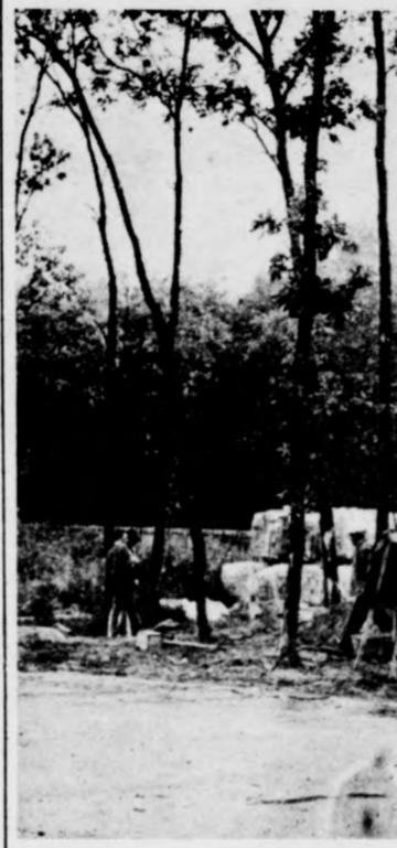
A recepció épülete hamarosan kész

Járdaépítés, tereprendezés munkálatai vannak még há- tra, amikor az építők az épü- leteket átadják. A két, vizes blokkot (meleg vízzel) ma- gába foglaló fürdőépületet 9-én, pénteken adták át. Hátul, a kerítés mellett ké- szül egy 100 személyes étte-