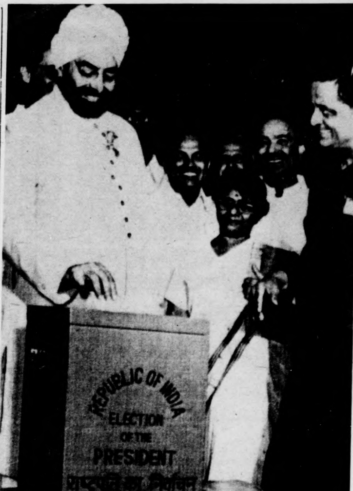
Hétfőn elnökválasztást tartottak Indiában. Képünkön: az esélyes jelölt, Zail Singh adja le szavazatát.

Az ifjúsági kérdésekkel foglalkozó KB-ülés előkészítéseként számos esetben találkoztak a kormány és a legfelső pártvezetés tagjai az ifjúság képviselőivel. Tizenkilenc vajdasági pártbizottság foglalkozott külön üléseken az ifjúság problémáival.