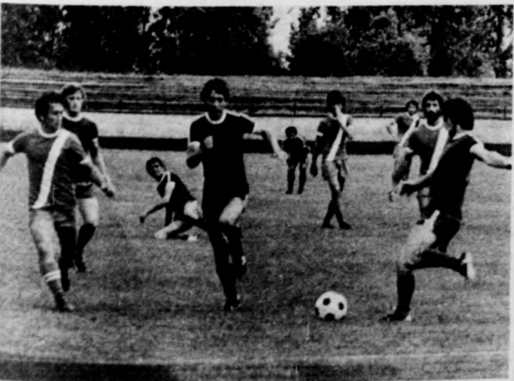
A sötét mezés létavértesiek vezetének támadását a D. Volán Gázvezeték utcai stadionjában.

A megyei labdarúgó-szövetségben hétfőn délután elkészítették a 3. forduló párosítását is. Ezúttal a D. Volán lesz az erőnyerő, míg a további hat csapat az alábbi sorsolás szerint küzd a megyei selejtező 4. fordulójába jutásért: Balmazújváros–D. Universitas (szombat, 17 óra), Tépe–Hajdúszoboszlói Bocskai és Püspökladányi MÁV Egyszerűs–D. Kinizsi (vasárnap, 17 óra).