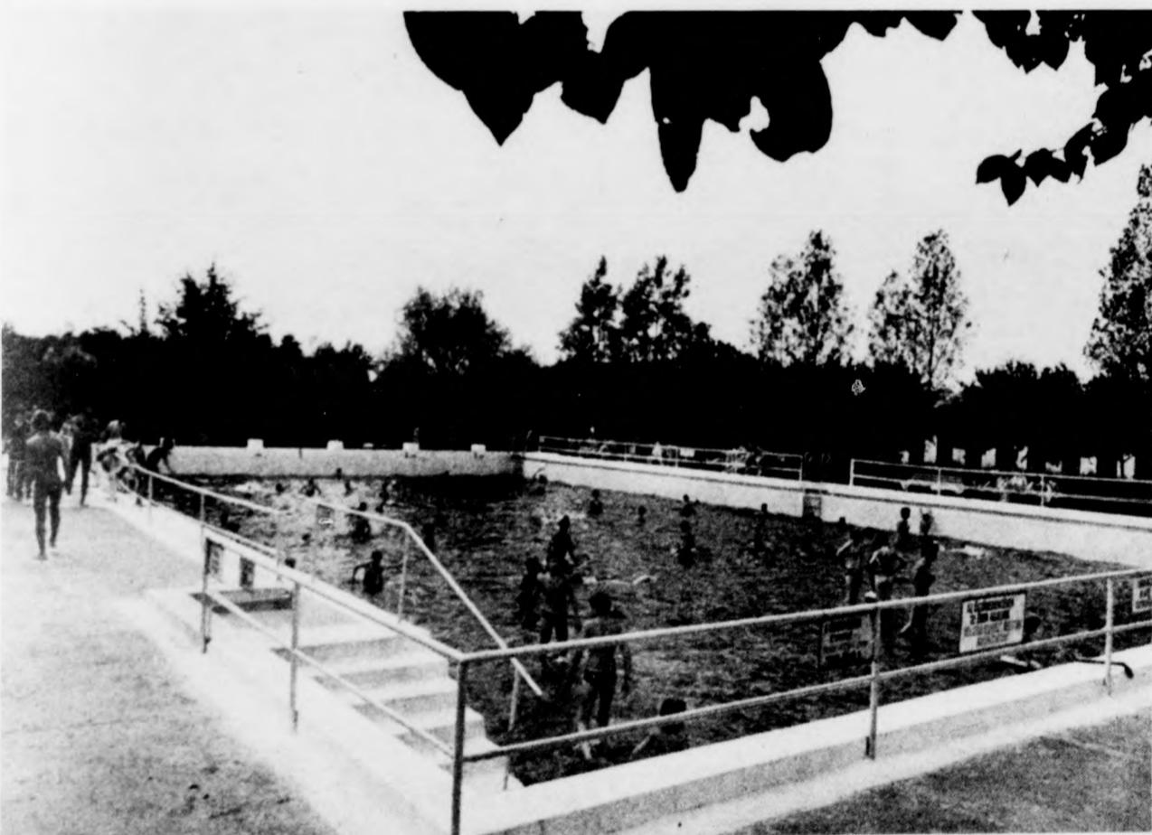
Ezt a medencét télen műanyag sátor borítja