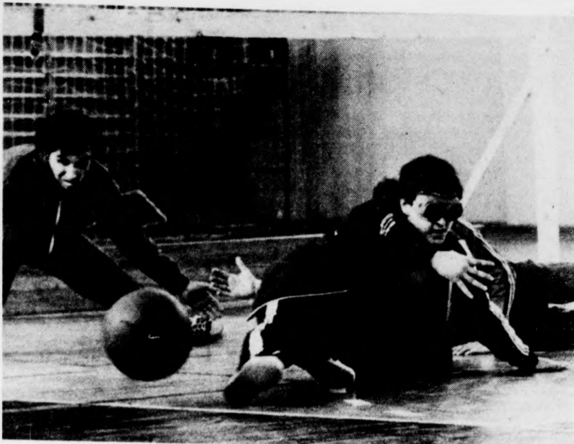
A kapu előterében elhelyezett két filcszönyegen a védőjátékosok igyekeznek újtát állni a labdának