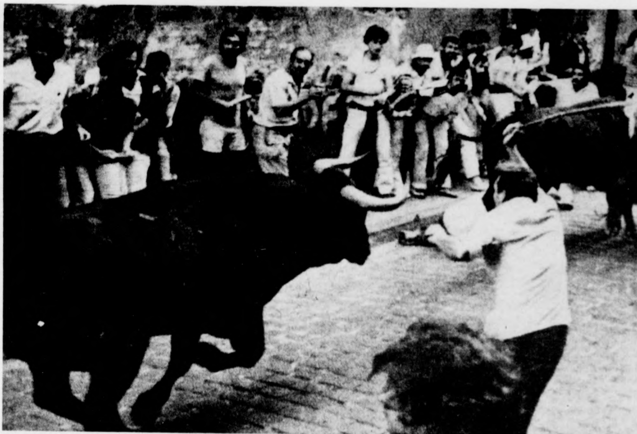
Pamplona utcája — a bátorság iskolája