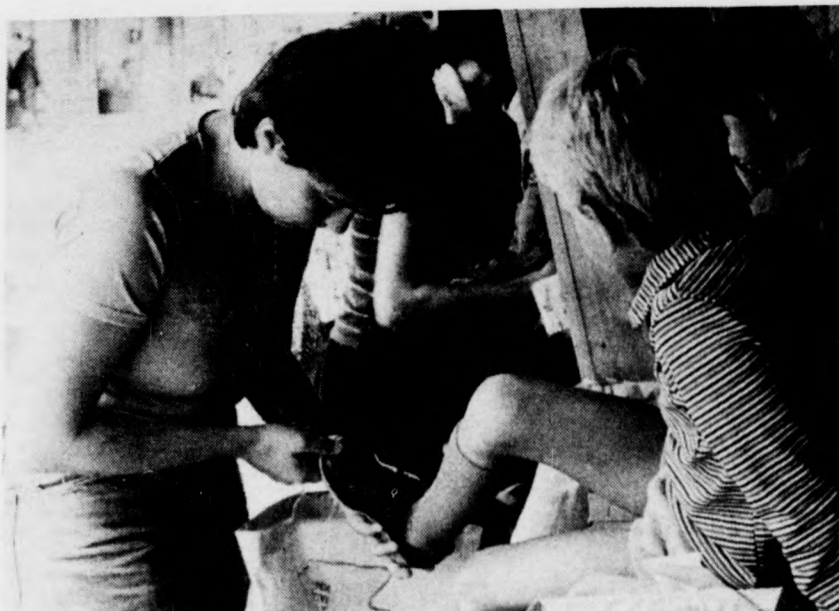
Ha nem szorít seholy, megvesszük...

Az MHSZ komádi honvédelmi klubja a nagyközségi KISZ-bizottsággal karöltve Körös Kupa honvédelmi versenyt rendez augusztus 8-án, vasárnap délelőtt 9 órától a komádi sportpályán. A versenyre vasárnap délelőtt 9 óráig nevezhetnek a KISZ-szervezetek, szocialista brigádok, munkahelyi kollektívák férfi-, női- és vegyescsapatai. A programban kispuskalövészet, 400 m-es akadálypálya leküzdése és kézigránátdobás szerepel. A hatfős csapatok közül az első öt vehet részt az augusztus 20-i döntőn. A most hétvégén megrendezésre kerülő selejtező első három helyezette tárgyjutalomban részesül.