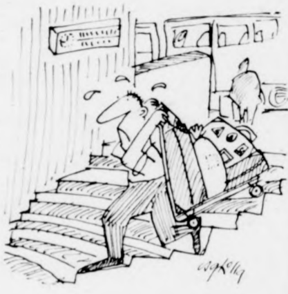
Az aluljáróba előbb levitte öbén a poggyászkulit, majd felvitte, ugyanígy a szállítóalkalmatosságot is. „Ma még fiatalon ezt viszonylag könnyen meg tettem. Felértem azonban bennem, mi lesz, ha öreg leszek? Kérdésem az, nem lehetne a pályaudvari

„Üdülésből hazatérve örömmel vettem igénybe a debreceni Nagyvállomáson az úgynevezett poggyászkulit. A vonattól könnyedén toltam az aluljáróig sok-sok bőröndömet, sportzsuttyaimat. Ott azonban megtorpantam: hogyan vigyem le az egyébként ötletes szállítóalkalmatossággal a poggyászatot, majd pedig fel?” — írja egyik magát megnevezni nem akaró olvasónk.