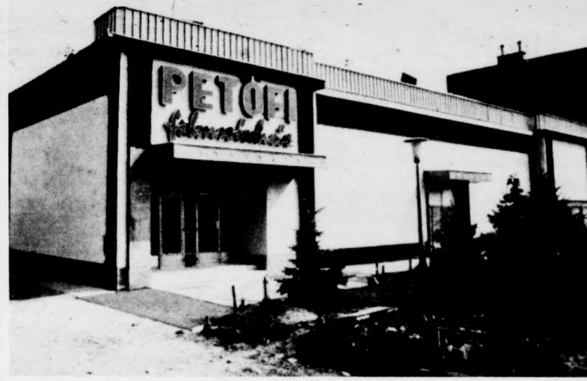
A felújított derecskei filmszínház