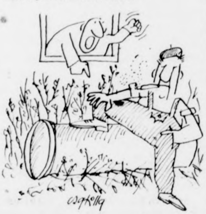
nyezetvédelemről. A tények szerint e munka végzői, úgy tűnik, nem ismerik, vagy ha igen, nem veszik komolyan a környezetvédelmet.”