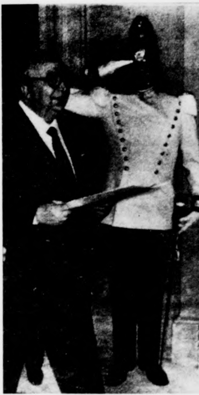
Ismét Giovanni Spadolini alakított kormányt Olaszországban. Az új római kabinetnek még összetétele is megegyezik a bukás előttivel