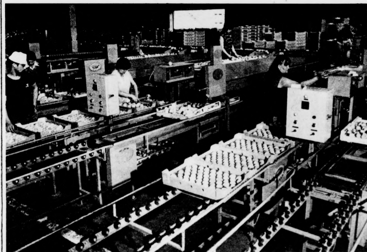
A HUNGAROFRICT budaörsi telepére évente kétszer vagon gyümölcs- és zöldségáru érkezik. Augusztusban az ősbabarcok szezon csúcán, naponként sok ezer kiló hamvas gyümölcsöt készítenek elő exportra