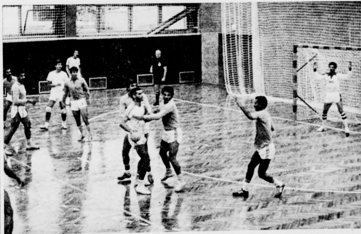
Irak kézilabda-válogatottja és a D. MEDICOR mérkőzésről készült Nagy Gábor felvétele

Debreceni MVSC — Dunaújvárosi Kohász 27-22 (13-11). 300 néző, vezette Kiss L. és Papp. Jó ideig fej fejelett haladt a két csapat, a hajtrában a DMVSC játszott gólratoróbban. Ld.: Szilágyi 8, Nagy Zs. 5, Sáfi 4, Borbás 4, illetve Varga Zs. 6, Burainé 4 és Hajdú 4.