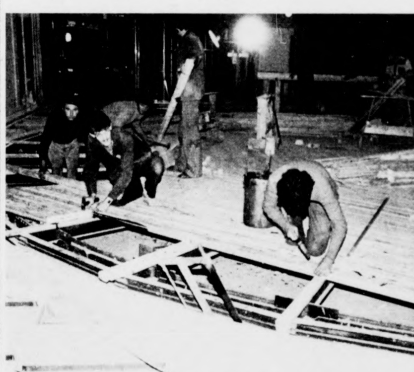
Már helyére került a forgószínpad, a végző simítások következnek

Társadalmi munkaként a brigád tagjai elsősorban a névnapok alkalmából segítik a távirányító dolgozó társaikat, közreműködve ezzel az üdvözlések és jókívánások gyorsabb továbbításában.