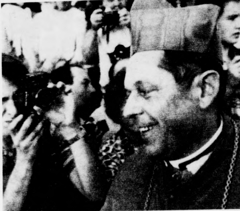
Az utca nem lehet a párbeszéd színpada, hangsúlyozta József Glemp érsek, lengyel katolikus egyházi, aki a nyugat-megőrzésére szólította fel a mintegy 300 ezer zarándokot Czestochowában, a Jasna-Góra-i kolostor alapításának 600. évfordulója alkalmából rendezett ünnepségen

SZOMBAT: Az arab külügyminiszterek értekezlete Tuniszban az arab csúcskonferencia előkészítésére