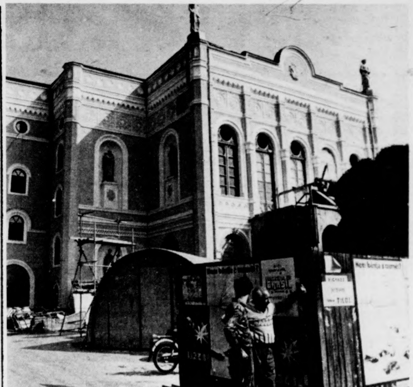
Új köntösben a Csokonai Színház

A most átadott szép új épületben a jövőben minden felső tagozatos tanuló délelőtt járhat iskolába, az alsó tagozatos osztályok egymással váltanak. Az eddigi elavult, régi tornaszoba helyett modern tornaterem várja a testnevelési órákra érkező tanulókat. Megoldódik a gyerekek napközitthonos ellátása, kétszáz általános iskolást öt csoportban tudnak foglalkoztatni. Nagyon jelentős, hogy az ötvenéveses óvodában el tudják helyezni valamennyi sárrétudvari óvodás gyermeket. A felavatott iskola és óvoda 22 millió 326 ezer forintba került. A község lakossága nagy mennyiségű társadalmi munkával segítette az építkezést. A kivitelező a Bocskai Termelőszövetkezet volt.