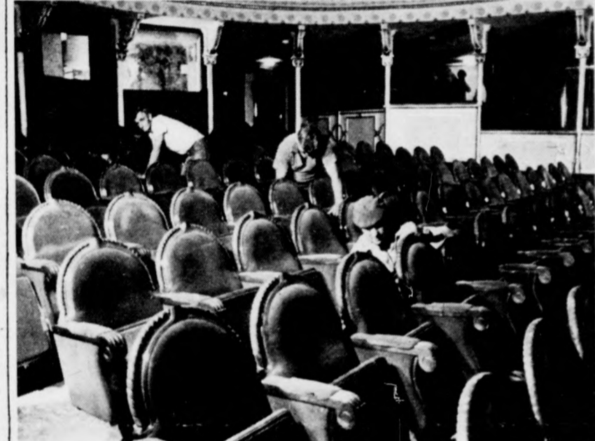
A nézőtérén szerelik az új széksorokat

Befejezéshez közeledik a Csokonai Színház több éve tartó felújítása. Ugy tűnik rövidesen birtokba vehetik majd a színészek a régi épületet, és novemberben már a nagyszínházban tarthatják az előadásokat. Elkészült az épület külső tatarozása, folyik a színpadtechnikai eszközök beépítése, és a napokban a nézőtér is elnyeri új formáját.