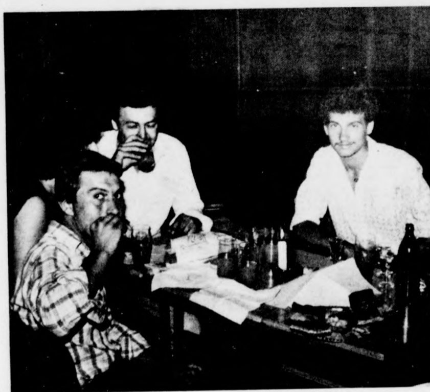
Az asztalon káposztás-túrós lepény