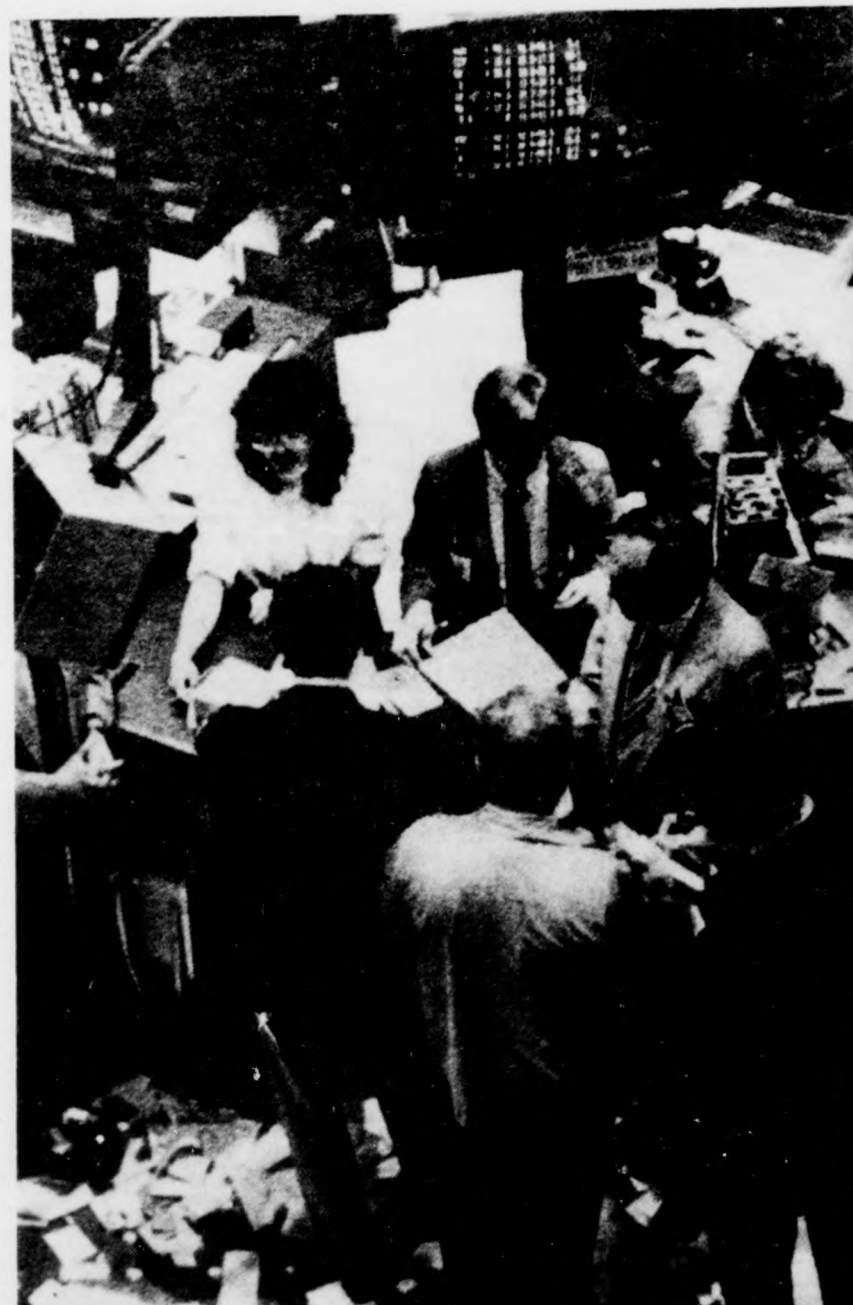
Az amerikai kamatesköntések világszerte tözsdel lázat váltottak ki. Képtünkön: vásárlási roham a New York-i tözsdén.