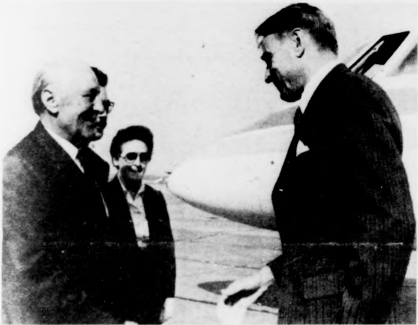
Kádár János, az MSZMP KB első titkára köszönti a Ferihegyen a Finn Köztársaság elnökét

(A pohárköszöntőket lapunk 2. oldalán közöljük)