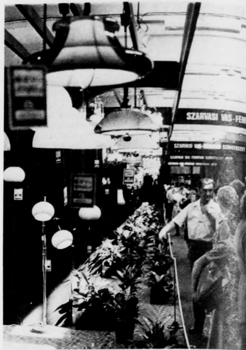
Ernyők és burák