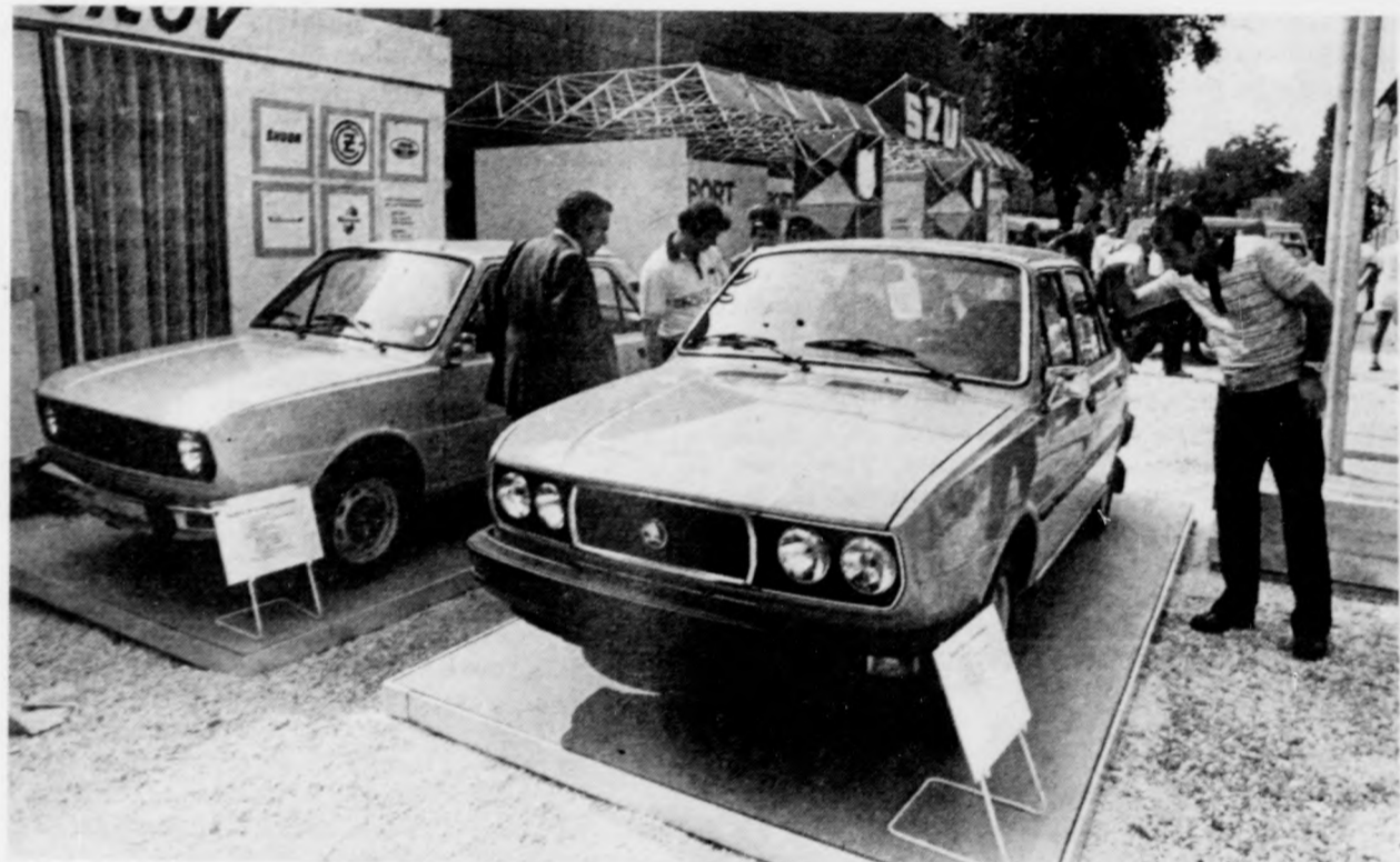
Itt a Skoda, új ruhában