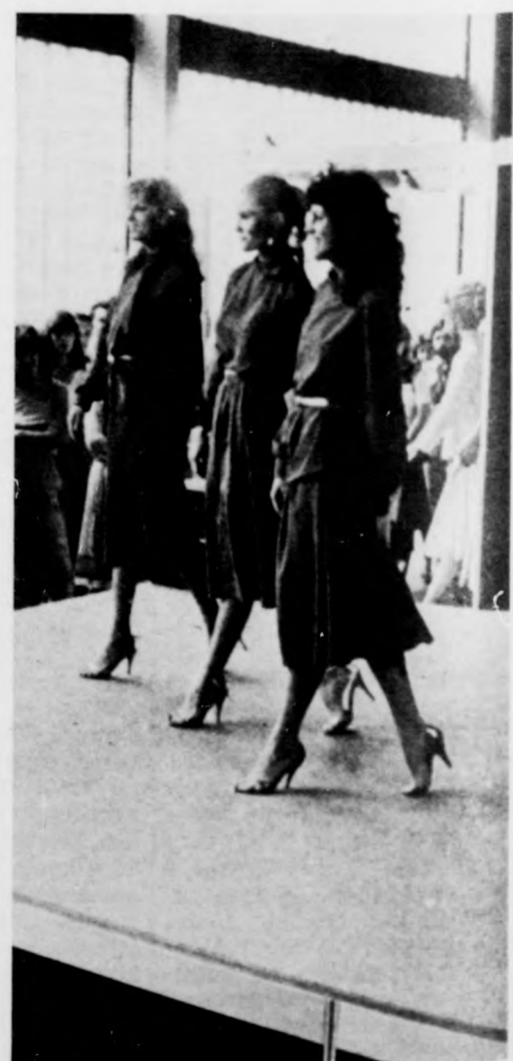
Három a manóken