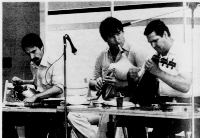
Szól a zene a művelődési pavilonban