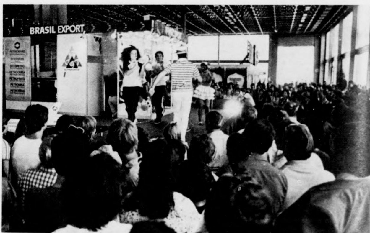
Népszerűek a brazil kiállítók