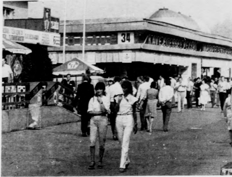
...ki gyalogszerrel indul városnézésre