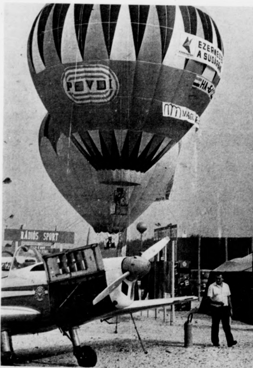
Kedzódik a sportbemutató