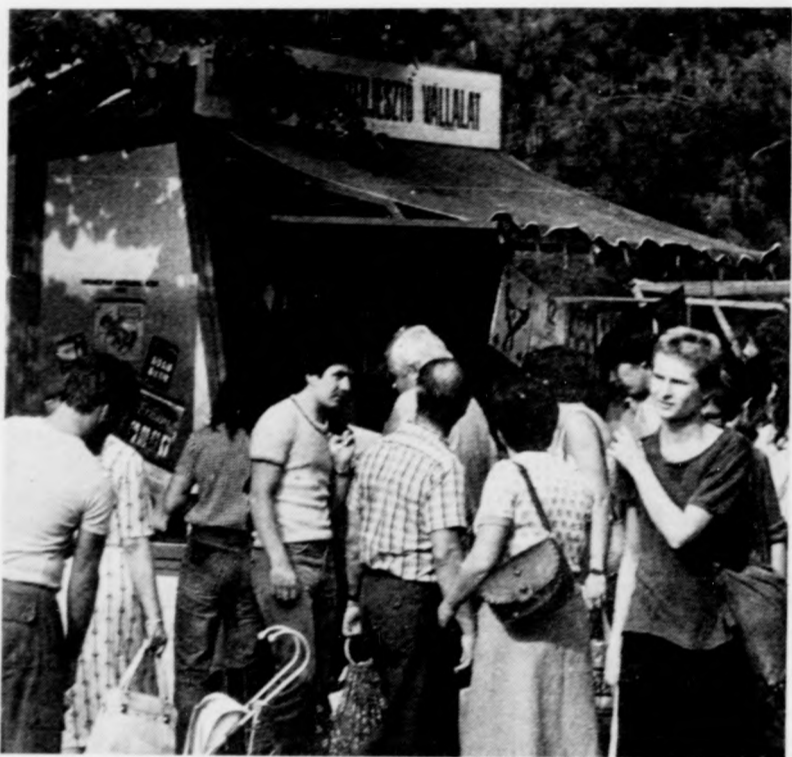
Könyv is kapható

Déli tizenkettőre jár, az ünnepélyes megnyitó vendégse- rege rég eltűnt a pavilonok labirintusában. A vásárembe- rek, az árukínálás, a tálalás hivatásos mesterei — fel- ocsúdvá a meghittség és visszafogottság átmeneti delejéből — újra hegyére hágnak a helyzetnek, keverik maguk kö- rül a levegőt. A bemelegítés percei ezek, a korán jött kíváncsiak verejtékcseppekét vehetnek észre a hangulat- pörgetők homlokredőjén. Nyitnak a büfék, sísteregve csep- pennek a kávéfőzőkből az első kávécseppek, „tollázkod- nak” a manókenek. És most már szól a zene, Skála- és Centrum-mezben dobja be magát a szórakoztatóipar fogta, bakonlői mikrofonnal similabdáznak.