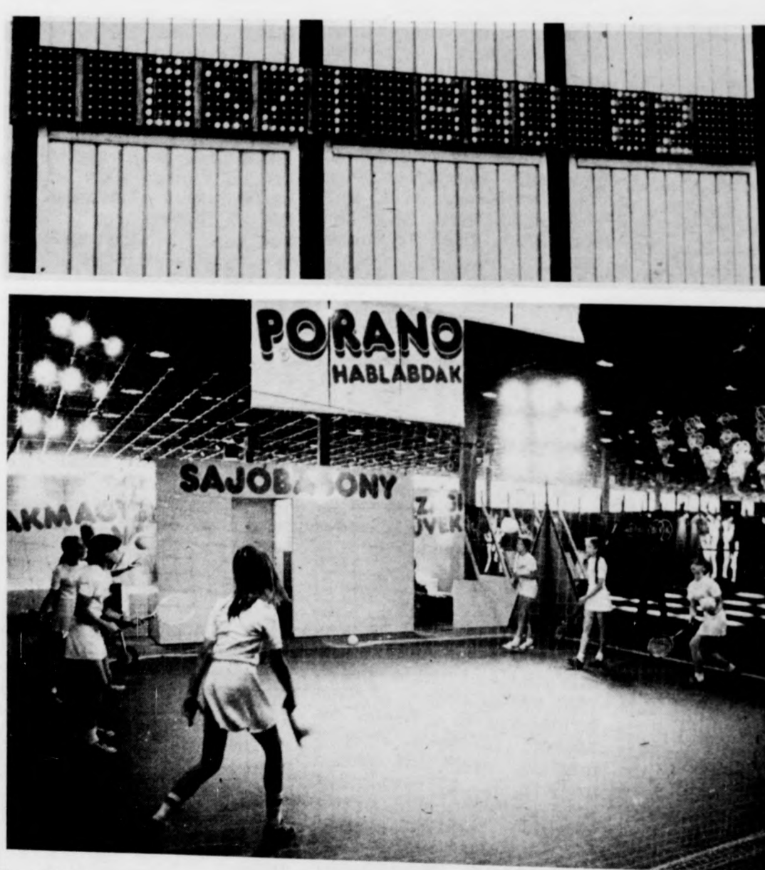
Egy kis bemutató — habkőnyű labdákkal