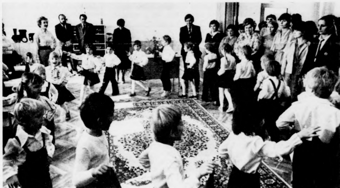
A Károlyi Mihály úti óvoda gyermekei műsorral kedveskedtek a résztvevőknek