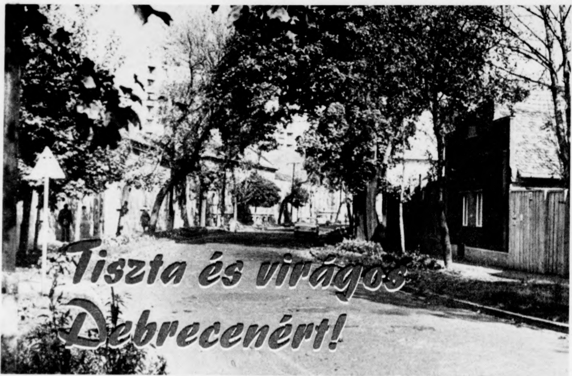
Az egyik nyertes: a Kigyó utca