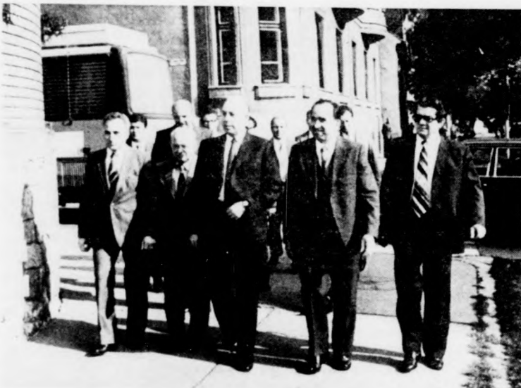
Vendégek és vendéglátók a megyei rendőr-főkapitányság előtt

Délután a román belügyminiszter és küldöttsége Pocsaj-Esztrába utazott, ahol a