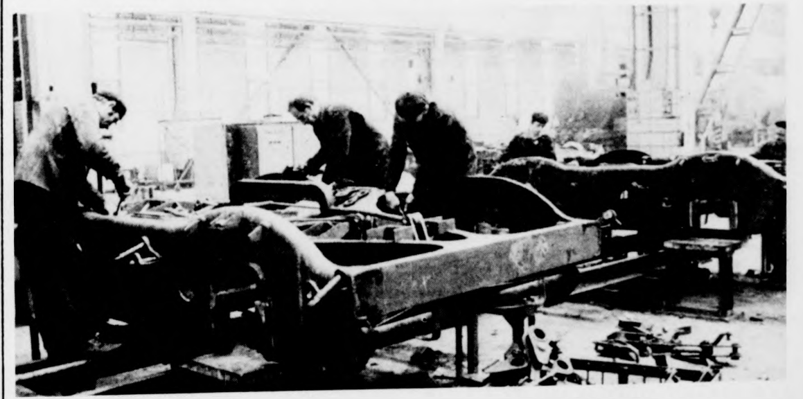
Munkában a javítóbrigád

A végzett munka értékét egyebek között a lakásépítési költségonalap bővítésére, a KISZ-szervezet anyagi támogatására, idős korúak megsegítésére s az általuk szintén patronált bodrogolási MÁV-nevelőotthon támogatására fordítják.