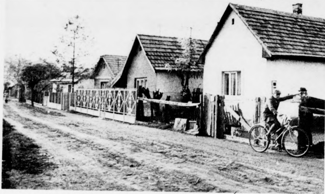
Ez az utca bármely faluban lehetne