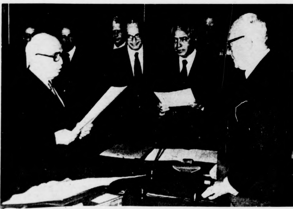
Új kormánya van Olaszországnak. A képen (balra) Amintore Fanfani miniszterelnök leteszi a hivatali esküt Pertini elnök előtt