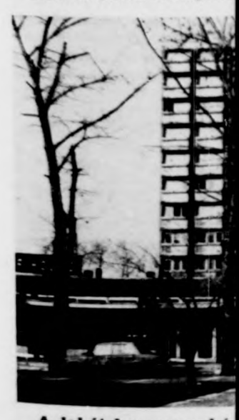
A lakótelep garzonház