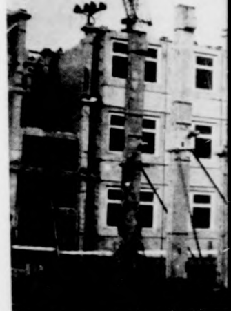
Kialakulóban a kispeszt...

Mindezeket túl hozzájárul az építéshez, amely Hajdú megyei Államrendőrség feladata. Az említett 6500 lakosú városban fejeződik be.