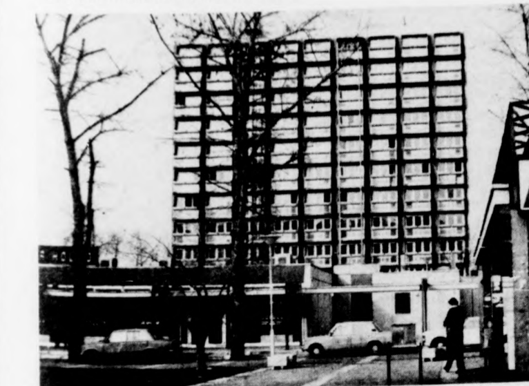
A lakótelep garzonháza