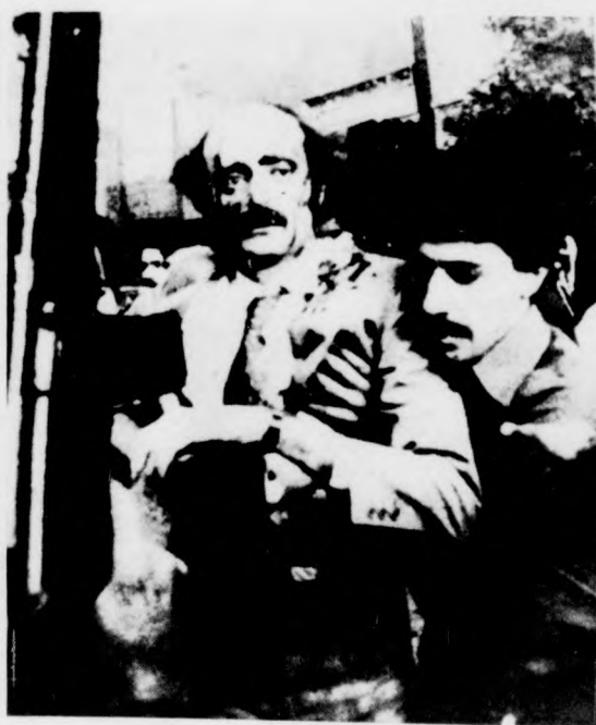
Nagy erejű robbanás történt szerdán Bejrút nyugati részében. A képen a sebesült Dzsambulottot kórházba szállítják