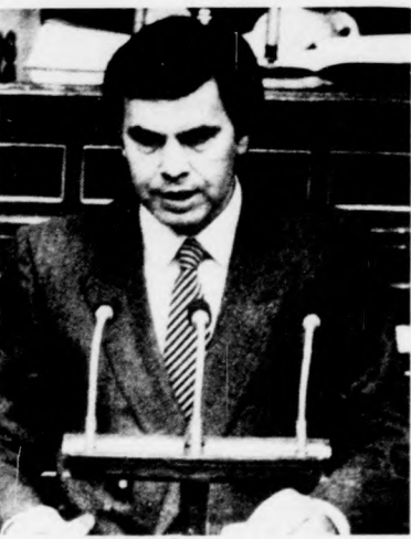
A héten megalakult Spanyolország szocialista kormánya. A képen Felipe González miniszterelnök a parlament ülésén beszél

pedig a három és fél milliós közöledik.)