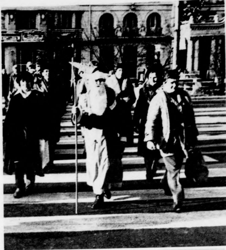
TÉLAPO AZ UTCÁN

A közelmúltban építőipari gazdasági munkaközösség alakult a hajdúbüszörmei AFESZ-nél. A közösségnek jelenleg hat tagja van. Valamennyien a foglalkozási szövetkezetek dolgozói. A pluszmunkát vállalók munkaidő után, hétvégeken és más szabad napjaikon beruházási, felújítási, karbantartási és más munkákat végeznek az AFESZ-nek, közműves, asztalos, festő, lakatos és villanyszerelő szakmában. Feladat akad bőven. A kis kollektívába tömörültek többek között szövetkezeti boltok átalakítását, festését, üzemhelyiségek bővítését, állagmegővését és karbantartását végzik, előnyös díjazás ellenében. Első tevékenységként a munkaközösségek a Polgári útra költöztették át az EIVRT Alkalmazás hajdú- büszörmei telephelyéről a szövetkezet egyik szerződéses formában üzemelő boltját. A dolgozók három tároló villanyszelvény munkáival is végeztek már, s kialakításra került a helyi Hajdú Áruház gázüzemű kazánjának kéményalapja is. Most van folyamatban — a közösségi tagok tevékeny részvételével — egy 600 négyzetméter alapterületű vasvázás raktár építése. A közösség tagjai saját felszereléssel dolgoznak. A vezető feladata a kis csoporton belül az anyagbeszerzés és az adminisztráció. Az év tevékenységéről ugyan még nincsenek végleges adatok, annyi azonban biztos, az új kisvállalkozás kialakításával mind az AFESZ, mind a munkaközösségben tevékenykedők jól jártak.