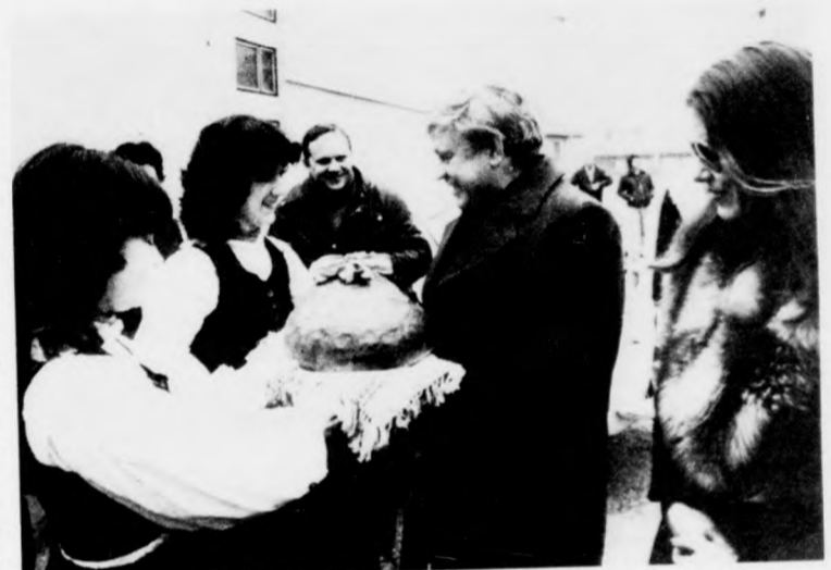
Friss kenyérral köszöntik a megérkező vendégeket

A litván hét első eseményeként délután öt órakor a Kőlesey Művelődési Központ kiállítás két kiállítás nyílt. A Litvániát bemutató kiállítás két részről áll. Színes fotókon láthatjuk Litvánia legjellegzetesebb régi és modern épületeit, ismerkedhetünk Litvánia építészeti-