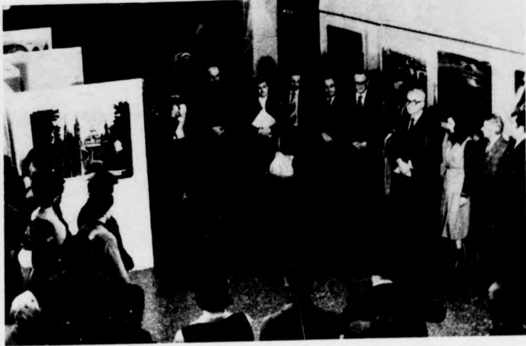
A Kőleszy Művelődési Központban rendezett kiállítások megnyitója

A kínai parlament ülészaka pénteken fejeződik be. A múlt hét végén a képviselők elfogadták a Kínai Népköztársaság negyedik alkotmányát, és visszaállították a harmincas évek közepén elfogadott himnusz eredeti szövegét. A „balosnak” minősített, 1978-ban jóváhagyott eddigi szövegben arra szövelték fel a kínai nemzetet, hogy „Mao Ce-tung zászlaját magasra emelve meneteljen céljai felé”. Az eredeti szövegben hiányzik minden utalás Mao Ce-tungra. Az Önkéntesek indulója címen ismert kínai himnusz annak idején a külföldi betolakodók elleni harcra mozgósította a kínai tömegeket.