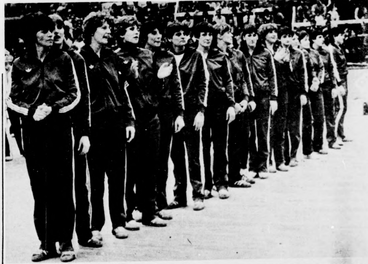
A magyar válogatott — immár felszabadultán — sorakozott az ünnepélyes eredményhirdetéshez

Kegyvesztett lett a labdarúgó-válogatott már az NSZK-ban is. Az idei év legjobbjainak választásán a csapatok versenyében Jupp Derwall együttese mindössze a 11. helyre került. Az elemzések szerint nem tudják megbocsátani a szarkolók és az újságírók Rummeniggeéknek az Algéria elleni vereséget, az Ausztria elleni „gyalázatos” bundamérkőzést és Schumacher „embertelenségét” a francia Battistonnal szemben.