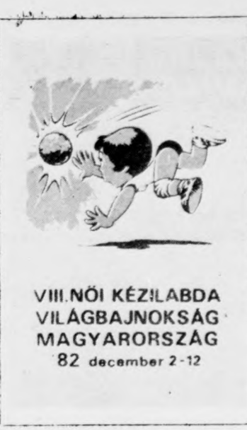
VIII. NŐI KÉZILABDA VILÁGBAJNOKSÁG MAGYARORSZÁG 82 december 2-12

Új színt jelentettek a VB történetében először első hat között végző ázsiai földrész képviselői, a dél-koreaiak, akik valóban „játszottak”. Őket nem érdekelte az eredmény, döntetlen állásnál is ugyanúgy kísérleteztek a kockázatos, de a nézőknek tetsző, test mögötti passzokkal, kettős kínai bejátszásokkal, mint amikor ők vezettek. A széleken is talán ők kísérleteztek a legtöbbet. Emlékeztünk csak a jugoszláv Anasztaszovszki szélsőjátékára, akik ellenünk