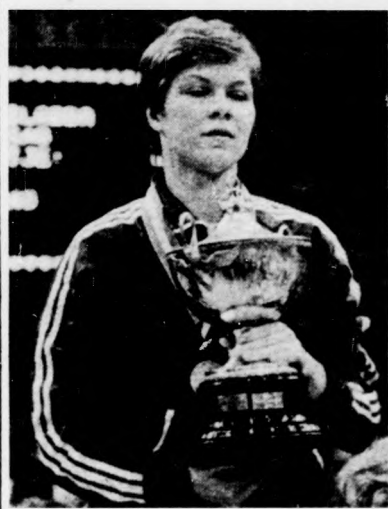
A szovjet válogatott csapatkapitánya, Karlova kéziként a világbajnoki címért kapott tróféával

VB előtt úgy nyilatkozott, hogy elégedett lenne egy dobogós helyezéssel, különösen akkor, ha ez nem a dobogó legalsó foká lenne. Aztán jöttek sorban a győzelmek, döntelen a nagy rivális, az NDK ellen. Már-már kezdtek arról beszélni, hogy a magyar válogatott megállíthatatlan, legyőzhetetlen, jelenleg a legjobb. Többen már a jugoszláv mérkőzés előtt a VB biztos esélyesének kiáltották ki a magyar lányokat. Egyedül nekik, a túlzott optimistáknak okozott csalódást ez a vereség, az első helyezés reményének el-