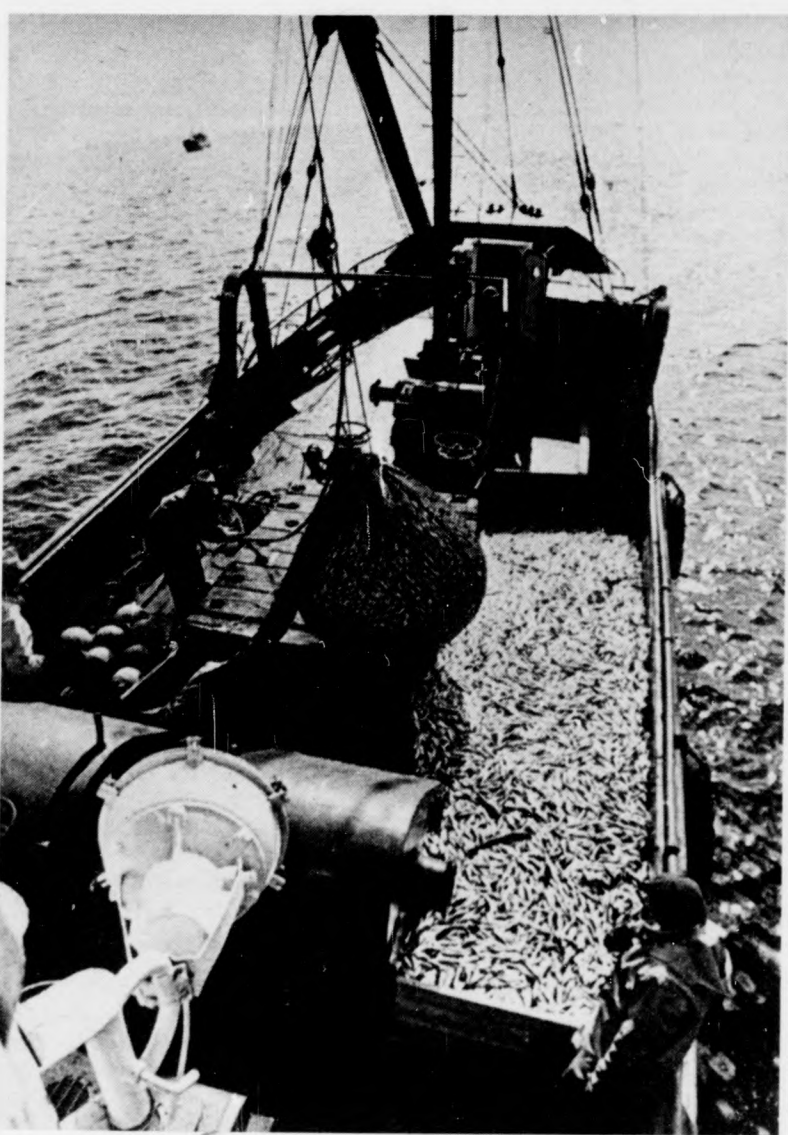
Az észti tengerpart a munka, a pihenés és az üdülés színtere. Képünkön: gazdag halászsákmány heringből, tőkehalból, sügərből, lazacból, marenából