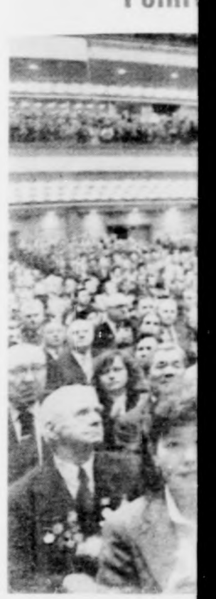
Jubileumi ülés M...ból. A képen: a...veszély elhárítására