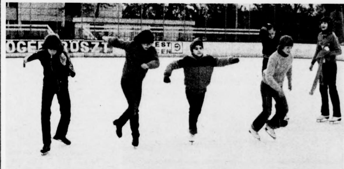
A 7. osztályos lányok egyik futamának rajtja