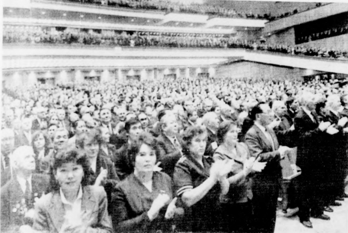
Jubileumi ülés Moszkvában a Szovjetunió megalakulásának 60. évfordulója alkalmából. A képen: a gyűlés résztvevői tapsal köszöntik azt a felhívást, amely a háborús veszély elhárítására szólít fel

Felhívás a világ népeire és parlamentjeire