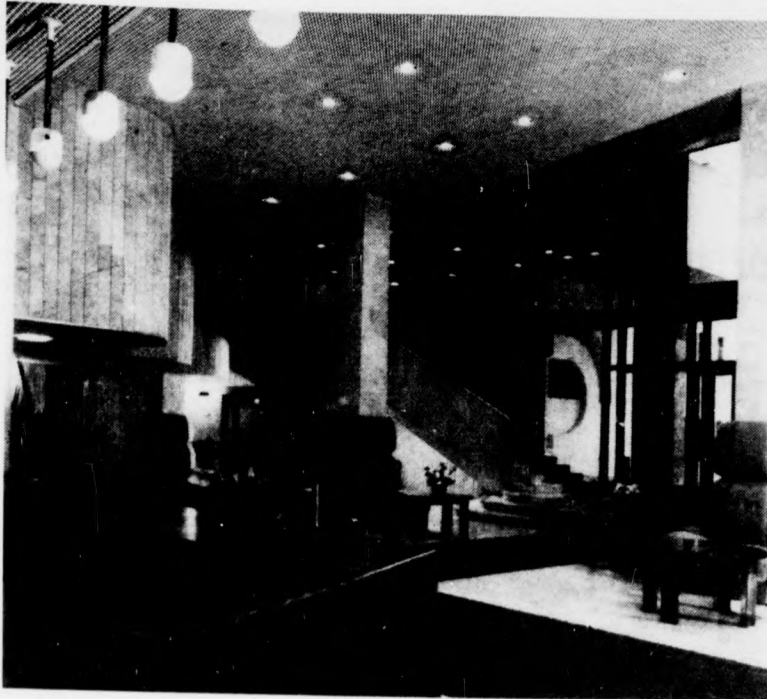
A főbejárat és a fogadó előtér

kezdett építkezés szovjet tervek, tervezők és kivitelezők munkáját dicséri. Magyar részről 16 alvállalkozó segített az impozáns létesítmény megvalósításában. A 23 ezer négyzetméter alapterületű, betonból, márványból álló, grúz tufával burkolt hatemeletes épület több mint 70 magyar külképviseletnek ad otthont. Külön érdekessége, hogy a belső építészeti kialakítást orosz, grúz és magyar képzőművészek alkotásaival, illetve e népek építészeti hagyományainak felhasználásával oldották meg. Az igazgatói tárgyalót például a nemrég elhunyt Pekáry Ist-