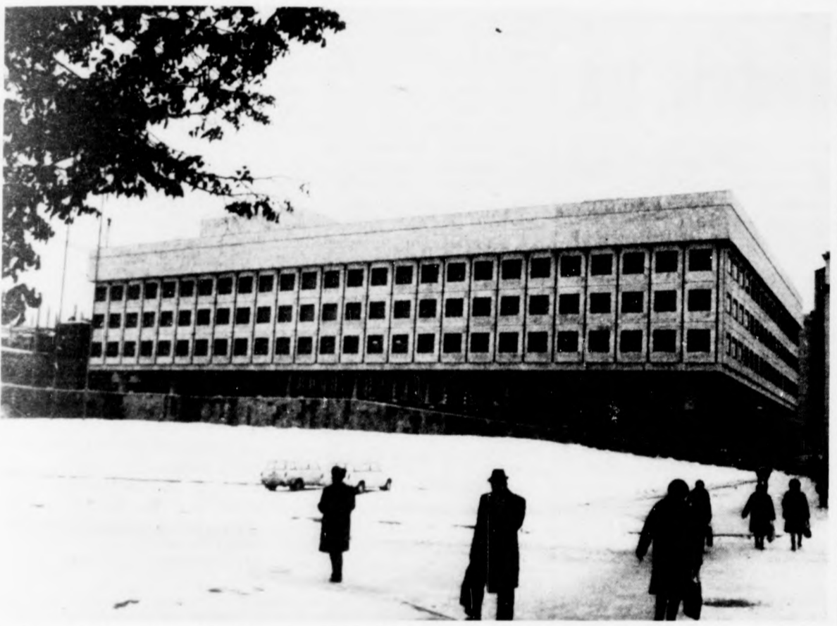
Az épület homlokzata (Kép és szöveg: Zoltay Károly)

Felvételeink az épület átadása előtt készültek.