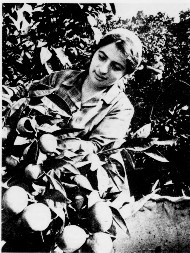
Szépen termelt a citrom