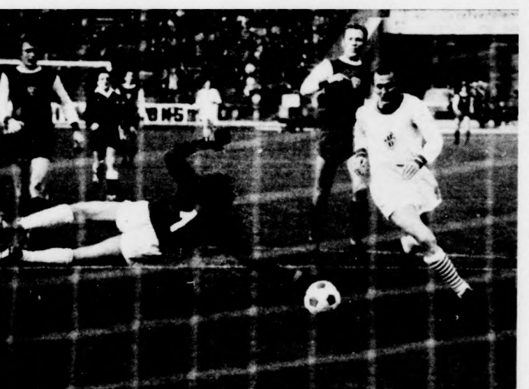
A 74-szeres válogatott Albert Flórián (Jobbról) búcsú-mérkőzésén is gólt rúgott a ZTE ellen

MESZÖLY KÁLMÁN. A „Szöke szikla” úr volt a főkapus. A 74-szeres válogatott Albert Flórián (Jobbról) búcsú-mérkőzésén is gólt rúgott a ZTE ellen