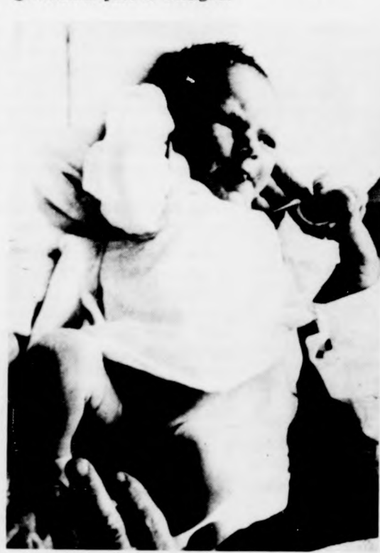
A brnói lombikbébi öt napos korában

A csehszlovák orvostudomány történetében kétségkívül új korszakot nyit az az újszülött, aki 1982. november 11-én sirt fel a brnói szülészeti klinikán. Rögtön az újszülött első oldalára került a fényképe, és ha közvélemény-kutatást tartanának az „Év embere” címet Csehszlovákiában valószínűleg a néhány hetes csecsemő nyerné. Igaz, nem akármilyen újszülöttről van szó. A — mindmáig titokban tartott nevű — kisfiú Csehszlovákia első lombikbébjé, vagy ha úgy tetszik, a nyolcadik ilyen ember a világon. Ha a nevének nem is tudjuk, azt igen, hogy nagyon jól viselkedik. Mindössze egy nappal korábban jött, mint az orvosok várták. A szülés zavartalan volt, a kicsi jó étvágyú és a súlyára sem lehet panasz, hiszen 3650 grammal jött a világra.