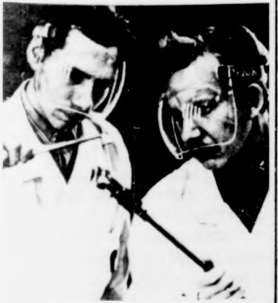
Sugárzásvizsgálat kísérleti mintán