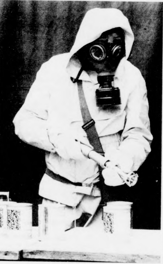
Az élelmiszerek rendszeres ellenőrzése

A tartósított élelmiszerek csoportjába sorolhatjuk a különböző fémdobozos, üveges konzerveket, befőtteket, füstölt, sózott húsokat, mélyhűtött termékeket és a különböző csomagolású készleteket. Az atomfegyver mechanikai hatásai elsősorban az üveges konzerveket, befőtteket, papírba és műanyag fóliába csomagolt élelmiszereket károsítják. A fény- és hőhatás zónájában a