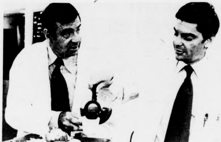
Várlak Nálal vacsorára

Az olajmező jövője. Ez a címe és témája annak a műsornak, amelyet december 30-án 13 órától hallhatunk az érdeklődők a Petőfi rádióban. A riportban a zala olajmezőről lesz szó, amely az új kutatások és a másodlagos kitermelés révén az ezredfordulóig garantálta az olajbányászok jövőjét.