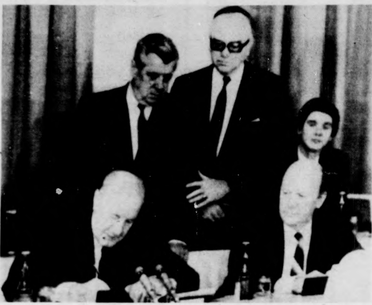
Kádár János, a magyar küldöttség vezetője aláírja a politikai nyilatkozatot, amelyet a Varsói Szerződés politikai tanácskozási testületének ülésén fogadtak el

Gustáv Husák, a CSKP KB főtitkára, csehszlovák köztársasági elnök a találkozón mondott beszédében hangsúlyozta a politikai tanácskozási testület most véget ért ülésének jelentőségét, s azt, hogy az elfogadott politikai nyilatkozattal a Varsói Szer-