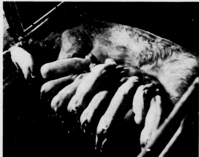
... régihez képest

sú munkakönyvük van. Két panaszosomat is ezért nem fogadtak sehol. Ez háborított fel őket. Csakúgy röpöködtek a mondatok. „Nem nézik a kétezi embert semmibe... Mit tudják az irodán, hogy hány gyerek sír otthon... Micsoda világ az, ahol munkát se kap az ember...”