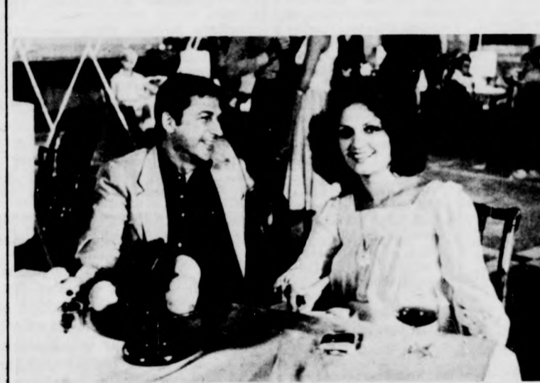
Egy trombitás Szocsiában