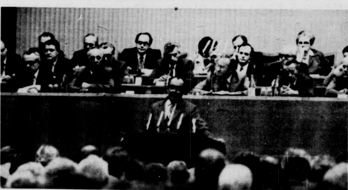
Méhes Lajos ipari miniszter beszél

(Folytatás az 1. oldalról) jesítésére. Az ipari termékek konvertibilis exportjának mintegy 5 százalékos emelkedését tervezik. Végezetül a miniszter az ipar foglalkoztatási helyzetét ismertette rámutatott: a