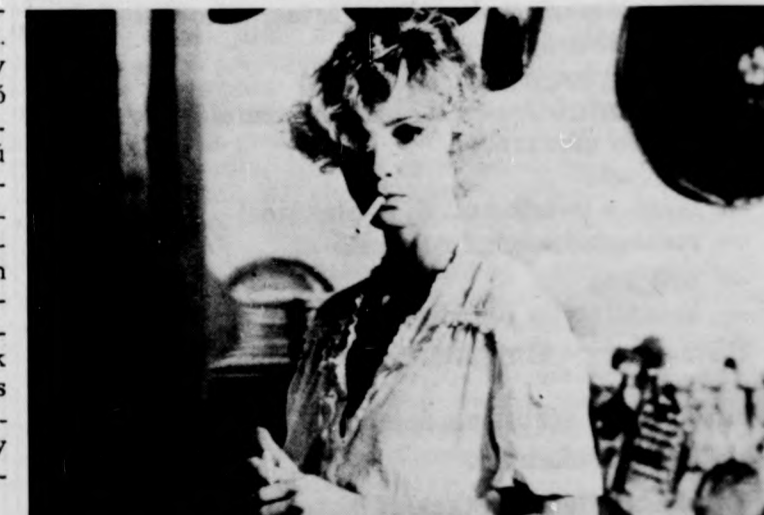
A postás mindig kétszer csepenget

A filmek vetítési idejéről naponta tájékoztatjuk olvasóinkat.