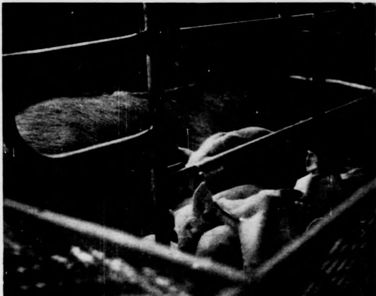
A fénykép aligha képes közvetíteni a különbséget: az új technológia előnyét...

Elkértem az újságot. Valóban négy üzem hirdett azon a napon, de valamennyi hirdetés végén ott állott egy-egy mondat. Valójában ugyanazt jelentette mind. A vállalatok már az újsághirdetésben kikötötték, hogy ne jelentkezzenek olyanok, akik két éven belül többször is munkahelyet változtattak, akiknek „kilépett” bejegyzé-