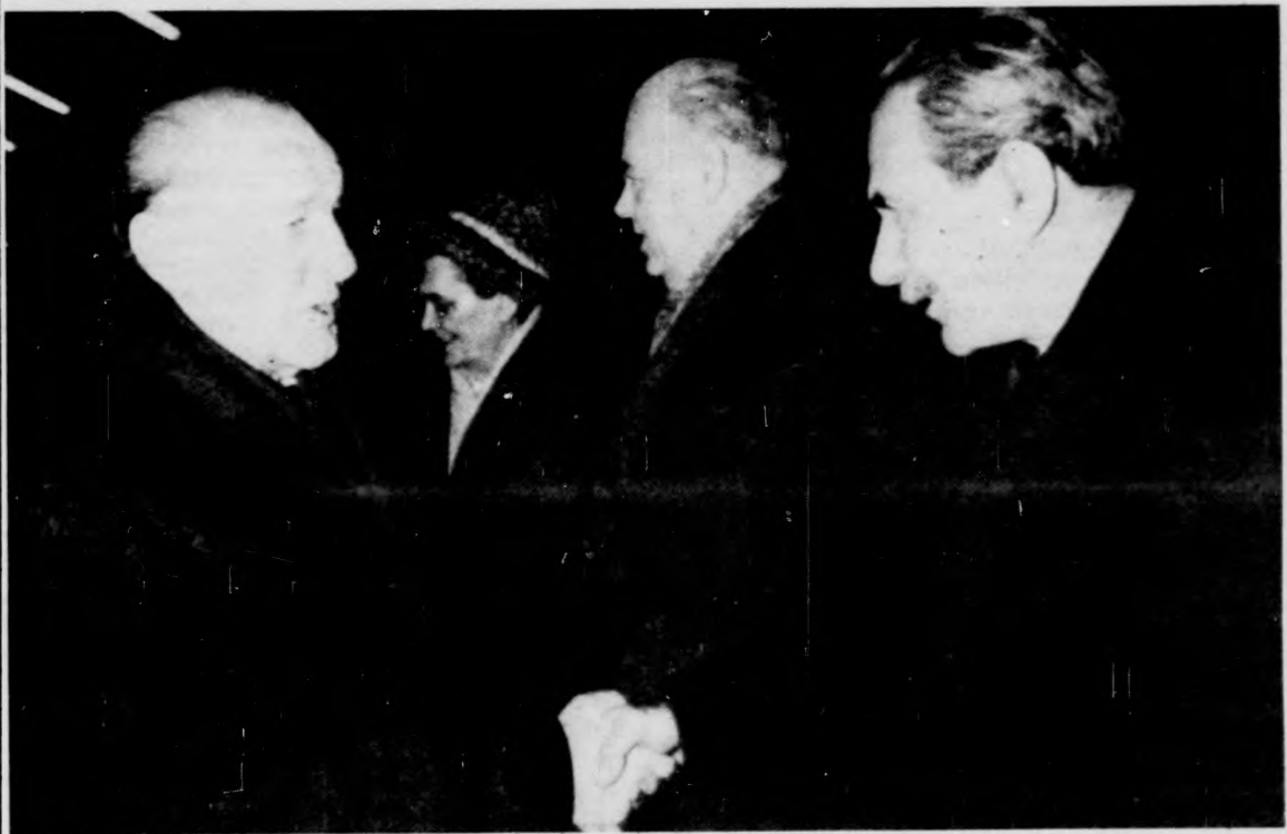
Kádár Jánost, a delegáció vezetőjét Aczél György üdvözlí a Keleti pályaudvaron.