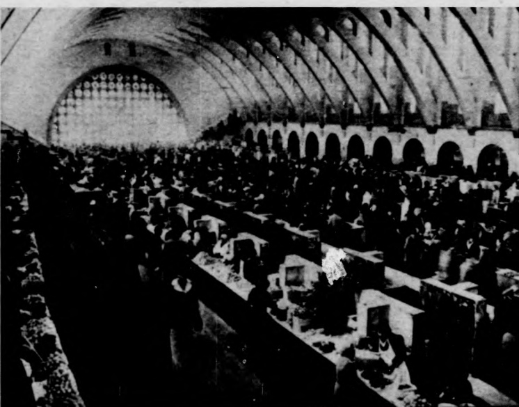
Gyümölcsárusok a jereváni vásárcsarnokban