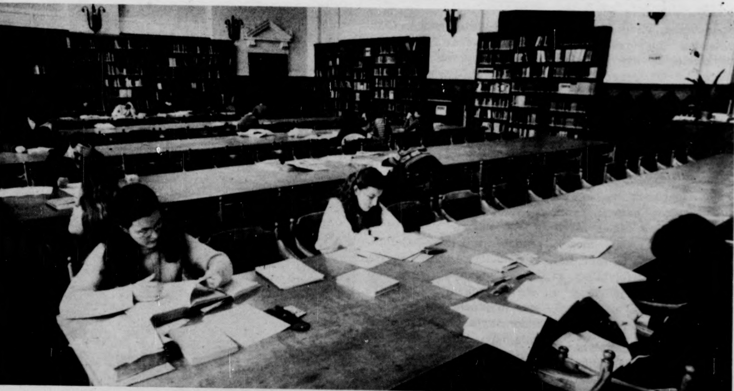
December huszadikától január harmincegyedikéig látástól vakulásig tanulnak, csak tanulnak...