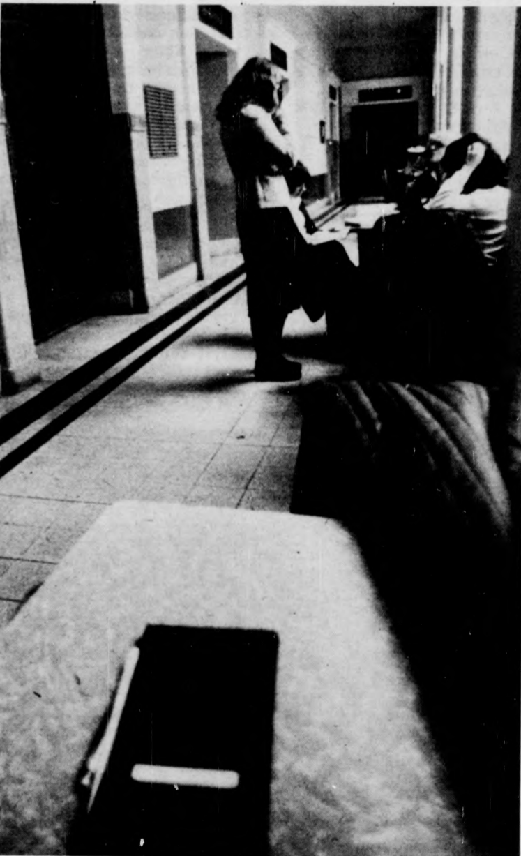
A magányos index