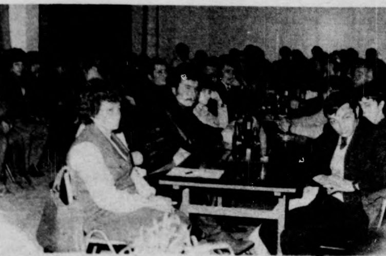
A közgyűlés résztvevőinek egy csoportja

A sportkör fontos feladata a tömegsport terelbelyesítése. Az elmúlt két évben asztaliteniszben, atlétikában, kézilabdában, kocogásban, labdarúgásban, sportlövészetben, sakkban, természetjárásban és úszásban rendeztek tömeges versenyeket, ünnepi tornákat, és sikeres volt az 1982. évi országos sportnapok nyiradonyi rendezvénye. 1981-ben mintegy 2200, tavaly pedig 2600 fő vett részt a tömeges sportmozdulásokon. Mindkét évben mozgósították a lakosságot a falusi dolgozók közösségi spartakiáján való részvételre — például 1982-ben csak a kispályás labdarúgásban 12 csapat vetelkedett, és szép számmal volt nevező az atlétikai viadala is. A közösségi spartakiád után szép számmal vettek részt a nyiradonyiak a járási döntőn is, melyen több dobogós helyezést értek el. Az elmúlt év októberében meghirdették a „Fut Nyiradony” versenyt, s ezen közel háromszázan indultak. A beszámolósi időszak végén, november 7. tiszteletére kis- és nagypályás labdarúgó tornát, valamint lányok és fiúk három-, négy- és öttagú versenyét bonyolították le a nyiradonyi sportpályán. A sikeres tömegsportmunka eredményeinek ismertetése után az egyes szakosztályok tevékenységéről, eredményeiről, a jövőre vonatkozó feladatokról, a közgyűlésen beszámoltak. A labdarúgó-szakosztály három csapatot szerepeltet a megyei bajnokságban. A felnőtt együttes nyeretlenül két döntetlen eredménnyel szerzett két ponttal az utolsó helyen.