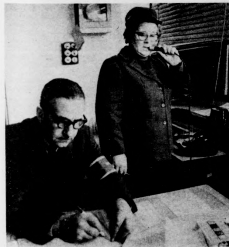
A forgalmi irodában bemondják az induló járatokat

Debrecen, Külső vásártér. Az autóbusz-pályaudvar szokásos képet mutat. A déli csúcs után vagyunk, a diákok már elmentek. A forgalom majd 16 óra után lesz igazán nagy, amikor az ingázók a munkából igyekeznek hazafelé. De azért most is van elég utas. Néhányan a váróteremben üldögélnek, mások az Utasellátónál vásárolnak üdítő italokat, uzsonnát. A pénztárnál — pedig itt előre, akár harminc napra is, meg lehet venni a jegyet, és távolsági, helyi járat bérlet, buszjegy, villamosjegy is kapható — nem hosszú a sor. Enyhe az idő — januárt hazudtató —, sokan a szabadban várakoznak.