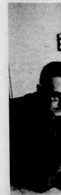
A forgalmi irodá