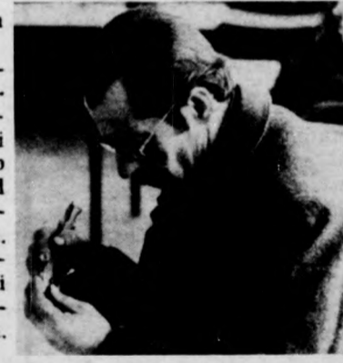
Igy is telik az idő