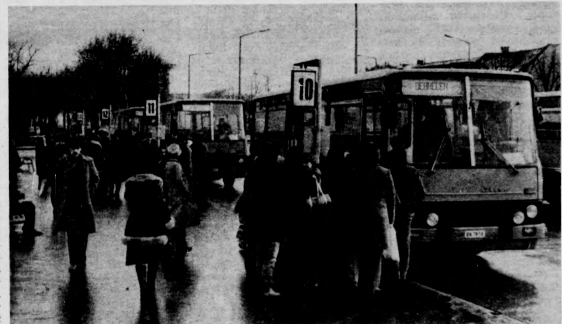
Megérkezett a busz, lehet felszállni

A tizenkét éve üzembe helyezett pályaudvar ma már kicsi. Kicsik az irodák, a buszok sem tudnak mindig időben beállni, parkolási gon-