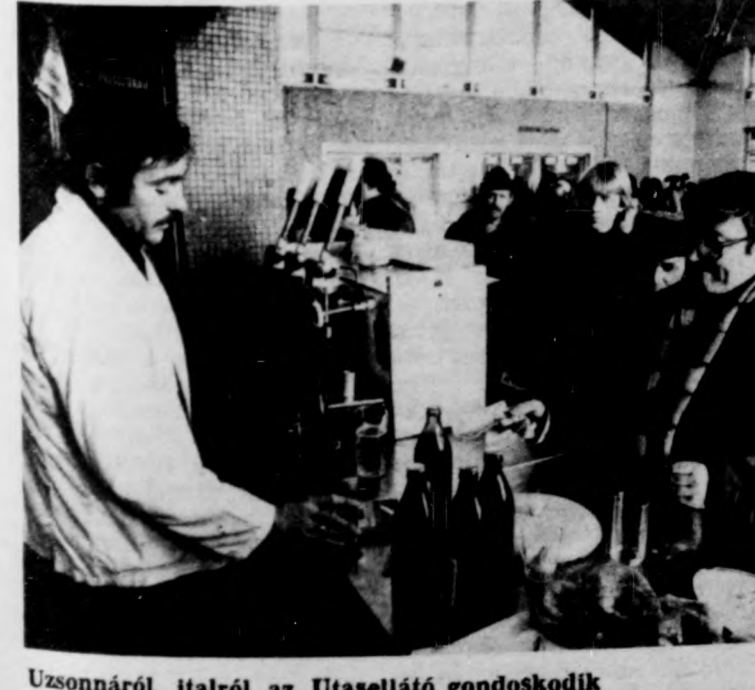
Uzsonnáról, itairól az Utasellátó gondoskodik