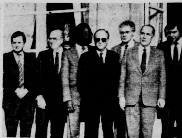
Párizsban tartottak tanácskozást Európa szocialista, illetve szociáldemokrata kormányzati országainak vezetői. Képünkön (balról jobbra) a megbeszélések néhány résztvevője: Palme svéd, Papandreu görög, Thiam szenegáli, Kreisky osztrák kormányzó, Jospin francia szocialista vezető, Mitterrand elnök és Gonzalez spanyol miniszterelnök