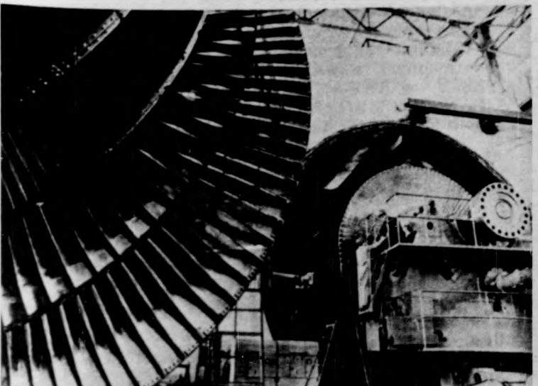
Az egymillió kilowatt teljesítményű turbina rotorját gyorsító-egyensúlyozó állványra helyezik

Az atomerőművek milliós teljesítményű turbináit Ukrajna egyik legnagyobb vállalata, a Harkovi Turbinagyár készíti. Ezeknek a turbináknak elődeikhez képest számos az előnyük, így például csökkent a vibráció, megnőtt a gépegységek időtartama. Szavatolják a szükséges üzemelést, korszerűbb lett automatikus irányítórendszerük. A turbina-óriások sorozatgyártásának megszervezésében az ország negyven tudományos intézménye vesz részt. Az első nagy teljesítményű turbinákat már útnak indították a Szovjetunióban épülő atomerőművekhez, amelyekben a XI. ötéves terv során 24-25 milliós teljesítményű új kapacitást helyeznek üzembe.