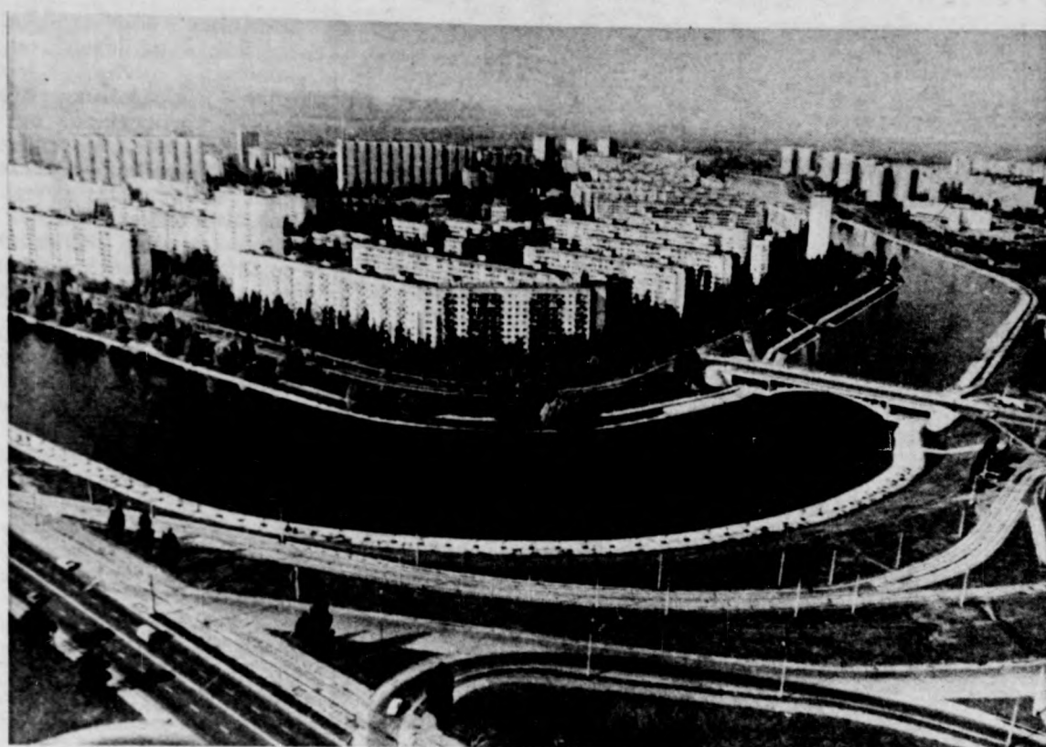
Kijev új lakónegyedének lát képe a Dnyeper-partról

Ukraina az Oroszországi Föderáció után a Szovjetunió második legnagyobb köztársasága: 603 ezer 700 négyzetkilométer területen fekszik, déli határa a Fekete-tenger híres üdülőövezetéhez kapcsolódik. A kelet-európai síkság jelentős részét termékeny délnyugati földjeit foglalja el. Az 50 millió 200 ezer lakosú köztársaság fővárosa Kijev, az egész keleti szláv államok egyik legősibb központja. A kijevi Oroszország, amely a IX-X. században érte el virágkorát, az orosz, az ukrán és a belorusz nép egységes állama volt. A történelmi és kulturális szálakon kívül ma Ukrajnát, Belorussziával és Oroszországgal, valamint a többi szovjet köztársasággal gazdasági kapcsolatok kötik össze. Itt összpontosulnak a modern ipar legfontosabb ágai, amelyek kedvező hatással az ipar fejlődésére. Ilyenek: a repülőgép- és autógyártás, az elektronika, az olajfeldolgozó áazatok és az atomenergetika. A Harkovi Turbinagyárban készülnek az atomerőművek milliós teljesítményű turbinái.