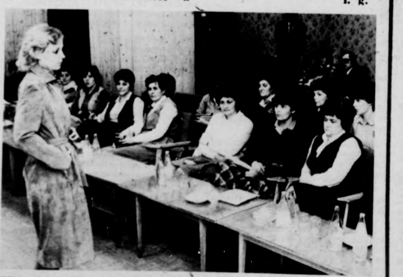
Most kell dönteni

Hétfőn délelőtt 10 órakor kezdődött meg az a két napig tartó divatbemutató, amelyen a Debreceni Ruhagyár az 1983-as őszi-téli kollekcióját mutatta be a hazai nagykereskedelmi vállalatok, textilgyárak, Centrum áruházak képviselőinek. Az első napi bemutatón több mint 200 modell látható a meghívottak. A ruhagyár a mindennapok divatjának megfelelő, kitűnő ízléssel és nagy gondtal összeválogatott „terítéket” nyújtott az igazán válogatós kereskedőknek. A szabadidő-ruhától a marhamappa és sertésvelűr kabátokig, sőtöltözétkig szinte minden őszi-téli alkalomra való ruhadarabot bemutatott és felvonultatott. Dicséretes, hogy a Debreceni Ruhagyár a kínálatot úgy állította össze, hogy részben importpótló, részben pedig eddig hiánycikknek számító termékekkel is kedveskedett a kereskedőknek. Ma már csak az üzletkötőkön múlik, hogy a most bemutatott divatos ruhák és kabátok bekerülnek-e az üzletek fogsáira.