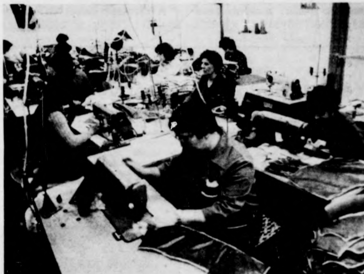
A kismamaszalonon hatvanan dolgoznak

A nánásiak évek óta viszatérő gondja a zsúfoltság, az üzem korszerűtlensége. Az idén itt is jelentős lesz az előrelépés. Húszmillió forintos beruházással új üzemház épül, és a tervek szerint még az idén átadják a szociális létesítményeket is. Az új munkahelyek tágasak, korszerűek lesznek, nem jelentenek ugyan létszám-bővülést, de az új üzem- és munkaszervezés révén minden bizonnyal hatékonyabb, gazdaságosabb lesz a termelés is.