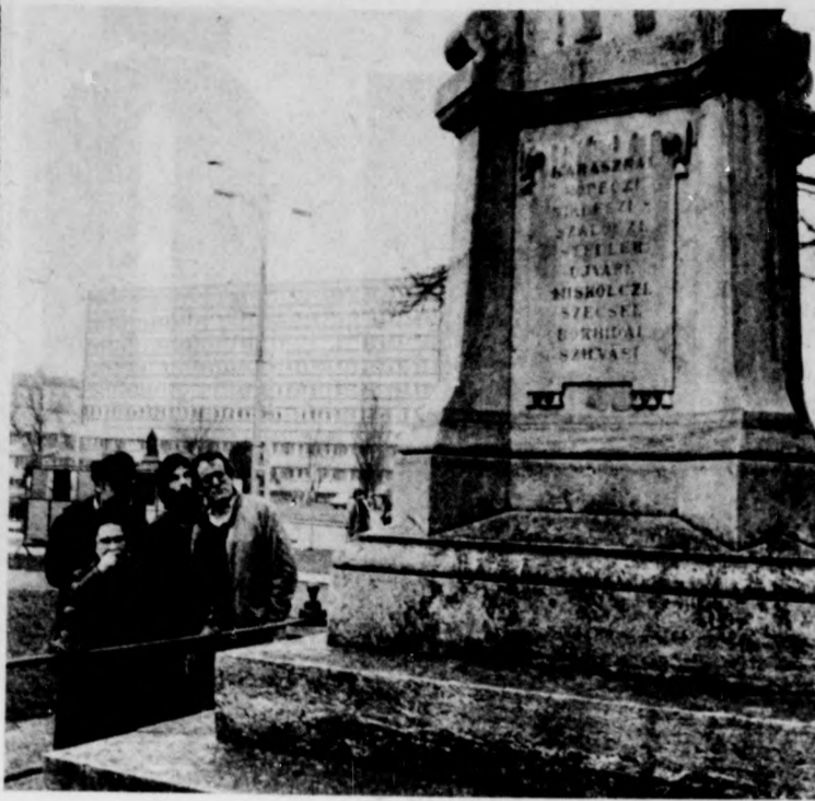
A holland újságíró küldöttség és kísérete a gályarabok emlékművénél

Haszsan marokkói király francia újságírók előtt kijelentette, hogy másként értelmezi a saharai kérdéstől rendezendő népszavazást, mint a francia kormány. A francia álláspont szerint a népszavazás a saharai nép önrendelkezési jogának elismerését jelenti, a marokkói uralkodó szerint viszont csak „konzultatív jellegű” lenne. Haszsan király azt is kijelentette, hogy szorosabban kívánja fűzni a két ország közötti gazdasági kapcsolatokat s szeretné, ha Franciaország segítségével atomerőműveket építenének Marokkóban.