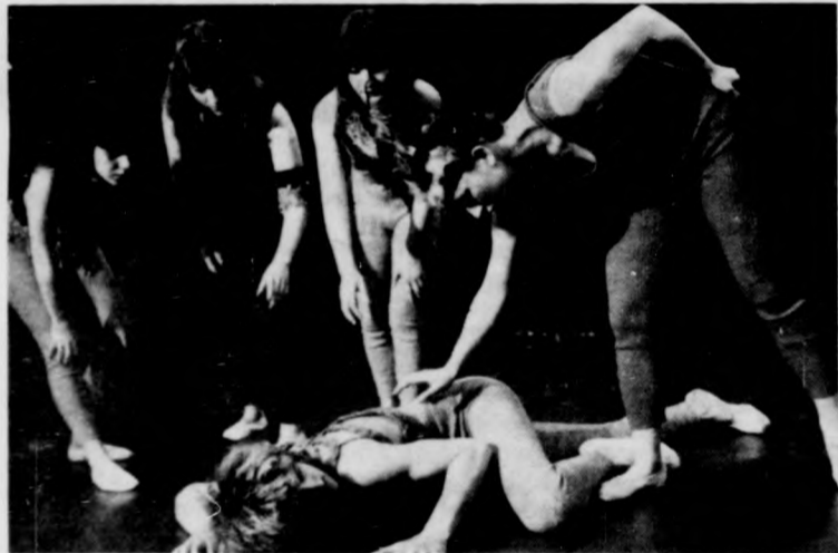
Jelenet az Unió mozgásszín műsorából