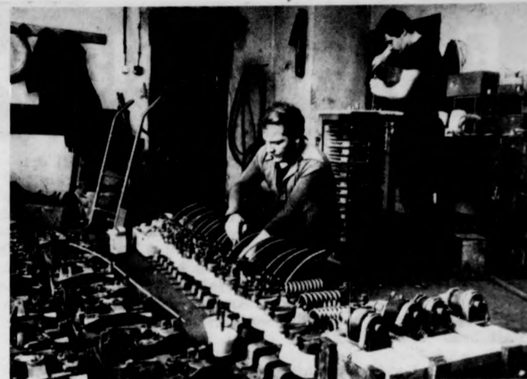
Kocsiszekrényt, áramátalakítót és egyéb villamosalkatrészeket is újjávarázsolnak Debrecenben

A MAGYAR SZOCIALISTA MUNKÁSPÁRT HAJDÚ-BIHAR MEGYEI BIZOTTSÁGÁNAK LAPJA