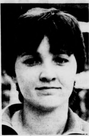
utána érdeklődő szövetségi vezetőknél.

1981-ben állandósította helyét az NB I-ben szereplő DMVSC együttesében. A legutóbbi bajnokságban már 102 góllal csapata második legeredményesebb játékosa lett. Edzője is elégedett volt vele, sőt jó véleményét mondott hozzáállításáról, játékáról az