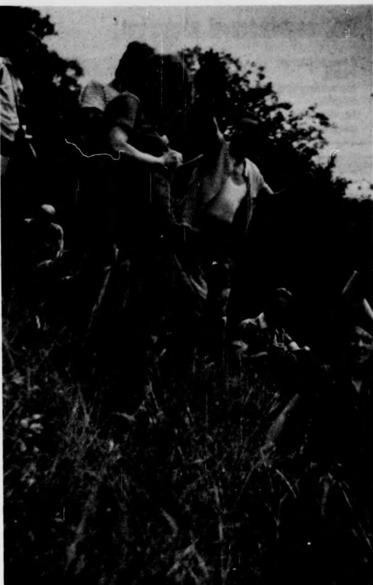
A professzor a terepnyakorlaton hallgatóinak magyaráz

— Először is hangsúlyozom — mondja Jakucs professzor —, hogy a környezeti változásoknak az élőlényeknél jobb indikátora (jelzője) nincs. Emellett természetesen az ökológusok is végeznek igen sok műszeres vizsgálatot. Sajnos, nálunk csak kevés és nem mindig a legkorszerűbb műszerekkel, de csak ott, ahol az élők már jeleztek! Igen fontos lenne, hogy az ember e jelzéseket előbb észrevegye, még mielőtt a jelzés láthatóvá válik! Tudni kell, hogy az élővilág tagjai sohasem egyedül jelennek meg földünk bármely részén, hanem mindig közösségekben. Ezek az adott terület külső, élettelen (abiotikus) és belső (biotikus) hatásaihoz évezredek alatt alkalmazkodva alakították ki azokat az elterjedési, elosztási, társulási, táplálkozási stb. viszonyait, amelyek genetikai törvényszerűségein be-