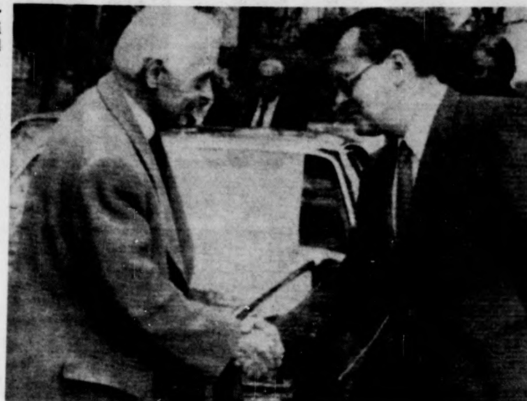
Genfben, a Szovjetunió képviselőinek épületében megnyílt az európai nukleáris fegyverzetek korlátozásáról folyó szovjet-amerikai tárgyalásorozat újabb fordulója. A képen Jurij Kvicinszkij (jobbra) és Paul Nitze, a két delegáció vezetője üdvözlő egymást

ő bízik az osztrákok politikai érettségében.