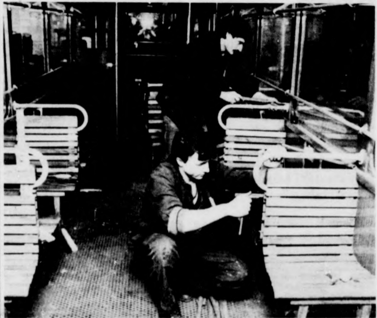
Javítják a budapesti villamoskocsit

A 30 darab ZIU-9 trolit megrendelték, és már gyártják a 321 darab felsővezeték is. Az 1984. április 1-éi üzemkezdethez a vállalat Salétrom utcai telepét átalakítják. Szervizműhelyt hoznak létre, megszüntetik a debreceni kisállomás és a telephely közötti iparvágányt, és a trolisok igazítják a telep belső vágányrendszerét.