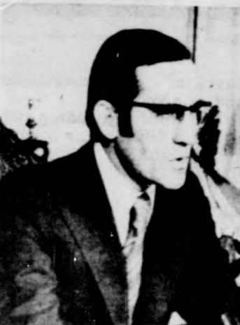
Eanes portugál államfő feloszlatta a liszaboni parlamentet és — előreláthatóan április végére — kiírta az idő előtti választásokat

Nyugati szomszédunkban április 24-én szökték az urnához a választó polgárokat. Három hónappal a szavazásnapja előtt már javában tart