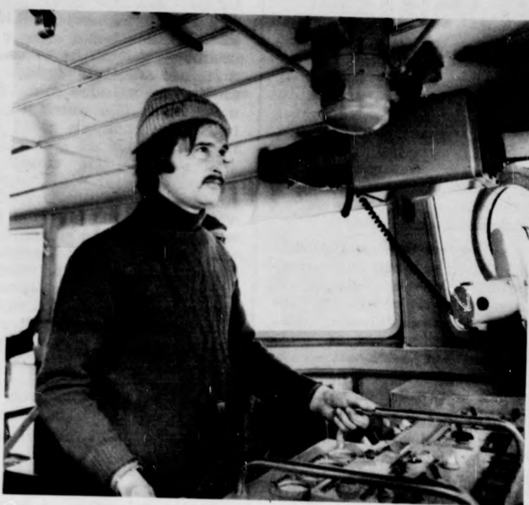
Egy kis hajó fiatal kapitánya

A táj képe — egészében véve — mit sem változott. Ilyennek láthatta a XVI. század végén Willem Barents holland utazó is, igaz, ő még nem helikopterrel járta a világot.