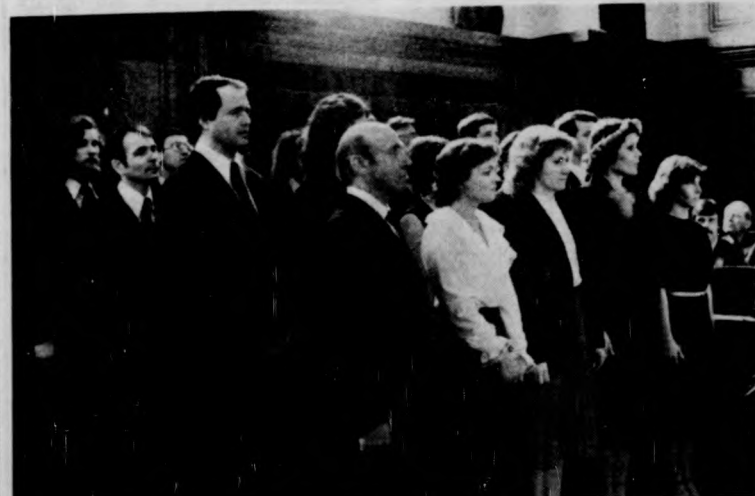
A természettudományi kar és bölcsészettudományi kar új doktorai