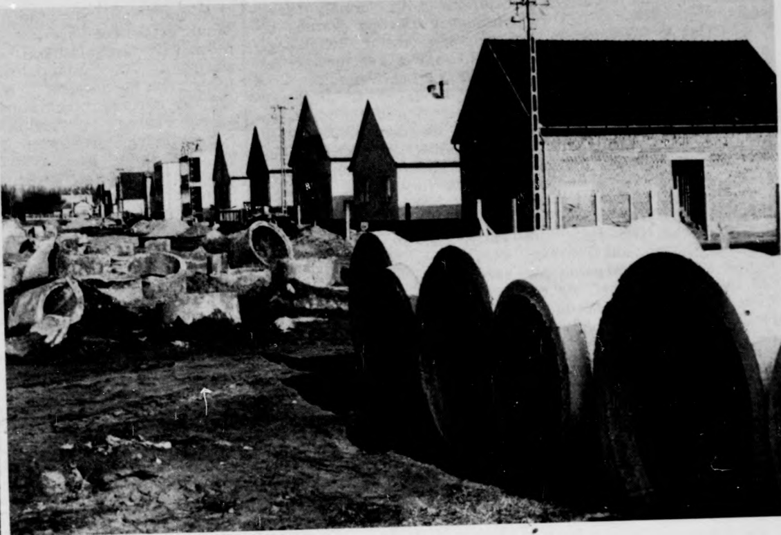
Új házsor a Szabó Pál utcán

szerződés aláírásának 35. évfordulója tiszteletére Együtt a közös úton! címmel vetélkedőt hirdet az MSZBT a Lapkiadó Vállalattal közösen, s arra az ország hatvannégy legnagyobb MSZBT-tagcsoportjának szocialista brigádjaikat hívják meg. Más szervekkel közösen az idén is — immár tizedik alkalommal — megrendezik a középiskolások hagyományos vetélkedőjét, Ki tud többet a Szovjetunióról? címmel. Az Ifjú Zenebarátok magyarországi szervezete és az MSZBT együtt rendezi meg Orosházán a III. országos orosz és szovjet zenei tábort. Az idej programból is kitűnik, hogy a politikai ismeretnyújtó, művészeti és szórakoztató rendezvények sora, az ifjabbak és az idősebbek részvételével folyó barátsági munka egyaránt tovább erősíti a magyar-szovjet kapcsolatokat — mondotta befejezésül Bíró Gyula . (MTI)