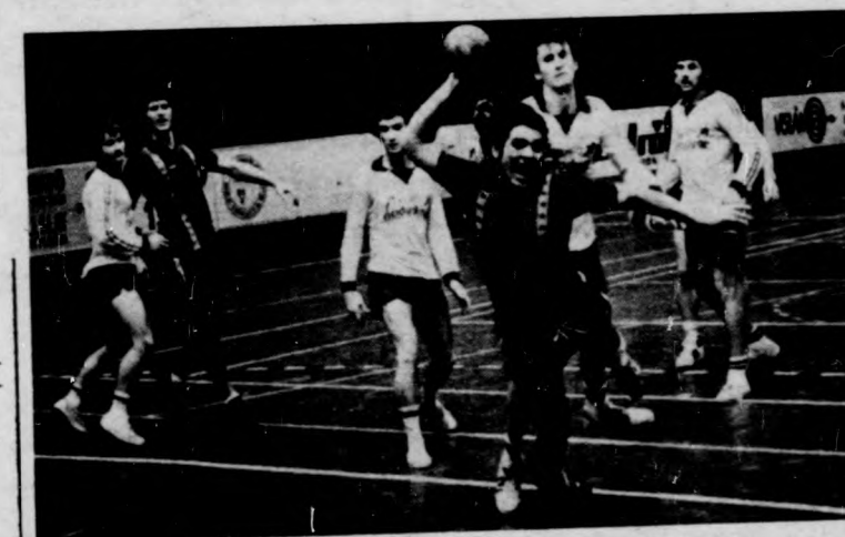
A hajdúszoboszlóiak beállása, Kormos már megszabadult védőtől, de a labda még nem hagyta el a kezét

Igen, győztek. De hogyan? A DMVSC női együttese lelépte nyíregyházi ellenfelét, míg a D. Közút a városbajnokság során megszerezte első győzelmét. A férfiaknál a D. Dózsa és a Hajdúszoboszlói Gáziánk is csak szoros küzdelemben bizonyult jobbnak ellenfelénél. A női Napló Kupában idén túli szabad dobással győzött a Püspök-ládány, míg a férfiaknál a DUSE megérdemelt, meglepetészerű győzelmet aratott a D. Spartacus szemben. Szombati, vasárnapi eredmények.