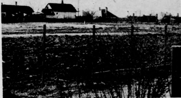
Itt is házak emelkednek a közeljövőben

A területek előkészítése folyamatban van