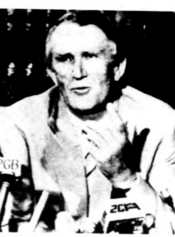
Malcolm Fraser miniszterelnök bejelentéskor az idő előtti választásokat

A szavazóhelyiségek ilyen gyakori felkeresése is jelzi: mozgalmas évtized áll az ötödik földrés 15 milliós népessége mögött. A konzervatívok több évtizedes egyeduralmát 1972-ben a Munkáspárt váratlan győzelme törte meg. Az új kormányfő, Whitlam reformok sorát indította el, kül- és belpolitikáját egyaránt pozitív lépések jellemezték. Szembe kellett azonban néznie az olajválság és a nekirámozó infláció gondjaival, a liberális kézben maradt felsőház pedig a költségvetés elutasításával többször is megbénította ténykedését.