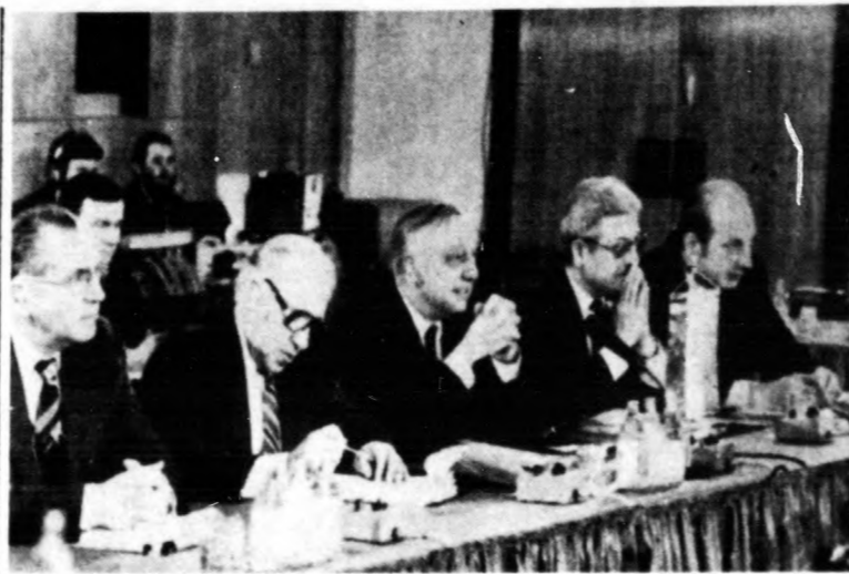
A KGST tervezési és együttműködési bizottsága az NDK fővárosában, Berlinben ülésezett. A képen a magyar delegáció dr. Faluvegyi Lajos miniszterelnök-helyettes (középen) vezetésével a tanácskozáson

Az értekezleten részt vevő nyugati országok szóvivője jelezte, hogy a NATO-államok egyelőre a február 17-i előterjesztés értékelésénél, tanulmányozásánál tartanak, válaszukat csak egy későbbi időpontban fogalmazzák meg. Majd azt fejtette ki, hogy a nyugati résztvevők sem kaptak még számukra kielégítő értékelést tavaly júliusi javaslatukra. A következő teljes ülést jövő csütörtökön tartják a bécsi Hofburgban.