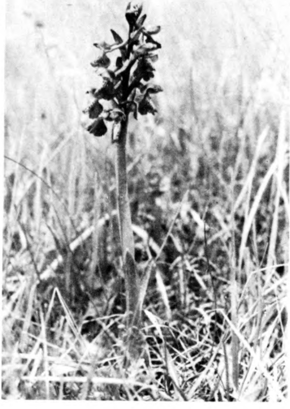
Az agárkosbor szépsége és az állományának fenntartása érdekében védett, eszméletke tövenként 2000 Ft.

Hazánkban területileg gyakori a közép-hegységeken, a Dunántúl egyes területein (Ország, Duna-vidék). Az alföldi réteken már ritkábban kerül elő. Megyénkben még néhány területen szép állománya él, így a hencidai erdőben, Hajdúnánás körzetében, az ohati erdőben, Szórványosban előfordul Debrecen környékén is (Martinka, Nagycsere, Pac).