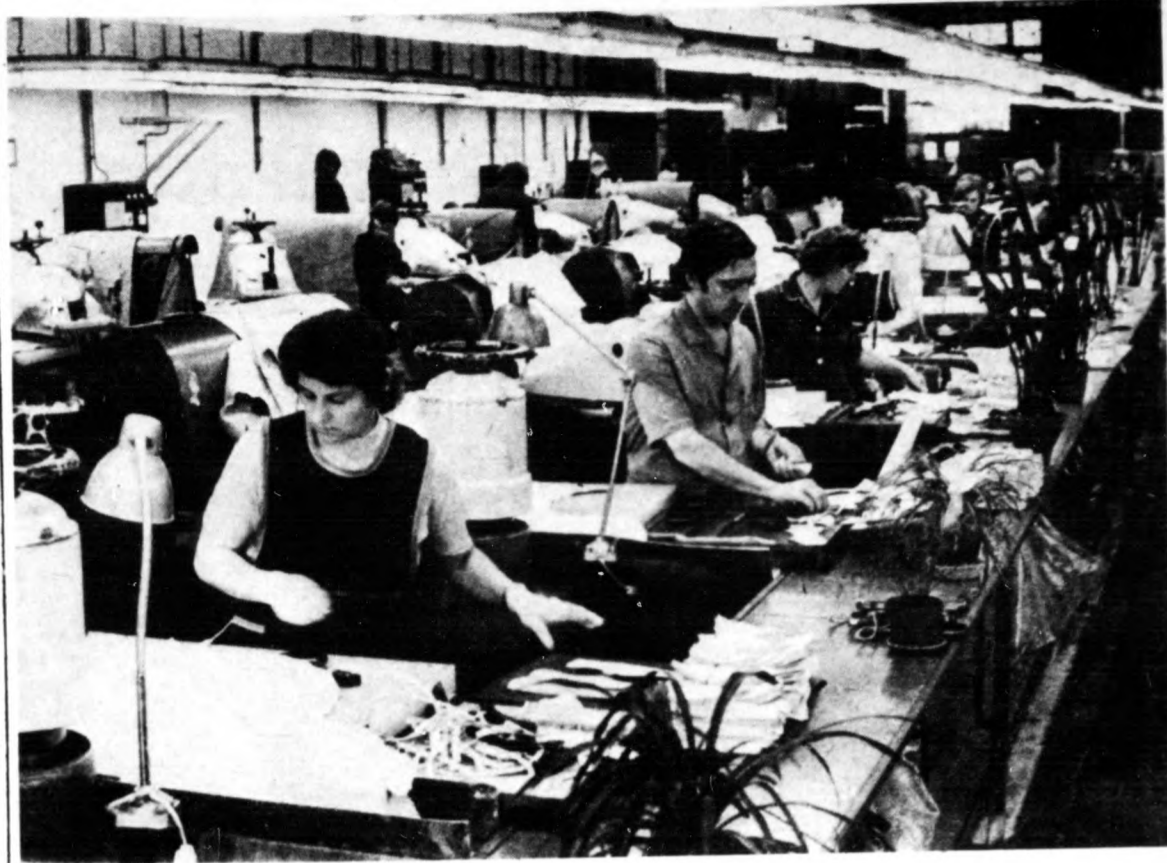
Korszerű gépek segítik a szabászat dolgozóinak munkáját