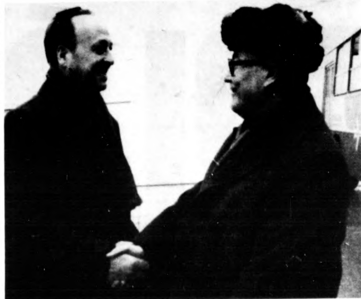
Stefan Andrei (balra) Puja Frigyes üdvözli

szervezetét is. A Marokkót támogató Egyesült Államok, éppen e vizslát révén, tavaly lehetőséget kapott arra, hogy diplomáciai aknamunkával — Marokkó révén — megtorpedózza az Afrikai Egység-szervezet csúcsértekezletét. A Polisario képviselői joga miatt Marokkó bojkottot szervezett a csúcsértekezlet ellen, ezért Kadhafi líbiai vezető nem vehette át az AESZ soros elnöki tisztét. Mauritánia, algériai közvetítéssel, 1979-ben békét kötött a Polisarioval. Nem sokkal később a marokkói csapatok, amelyek korábban ugyancsak veszteségeket szenvedtek a korábbi harcokban, falat vontak Nyugat-Szahara gazdasági- és politikailag feltétlenül fontosnak tartott északi és tengerparti övezete köré — ezek után a fegyveres összetűzések alábbhagytak. Az Algírban kiadott nyilatkozat szerint Algéria most ismét közvetítésre készül: ezúttal Marokkó és a Polisario Front között.