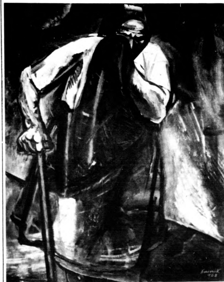
SZURCSIK JÁNOS: SÍRÓ ÖREGASSZONY

(A Déri Múzeum legújabb szerzeményeiből rendezett kiállítás anyagából)