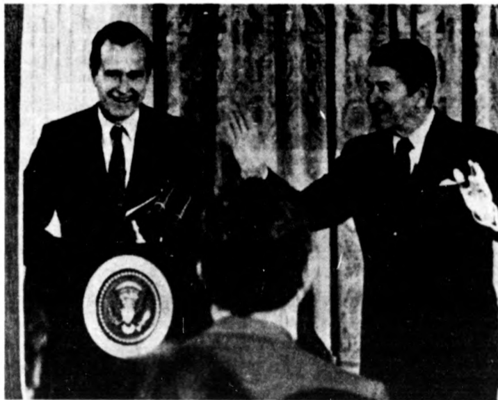
Reagan (Jobbra) és Bush alelnök az újságírók kérdéseire válaszol

— A rádió vételt követi sa a beszéldik egymásnyáját — tulajlevelézőlap — va van a be ezt minél har