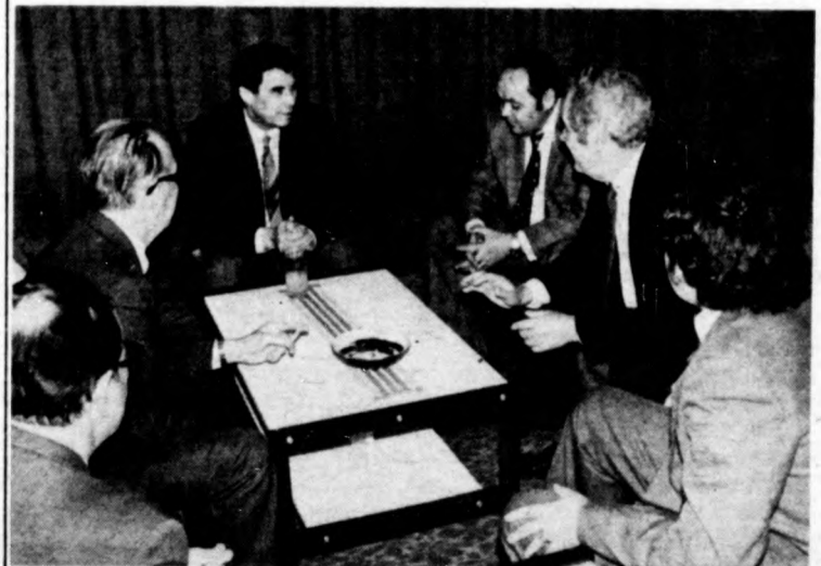
A szovjet szakszervezetek küldöttsége Hajdúszoboszlón az érkezés után