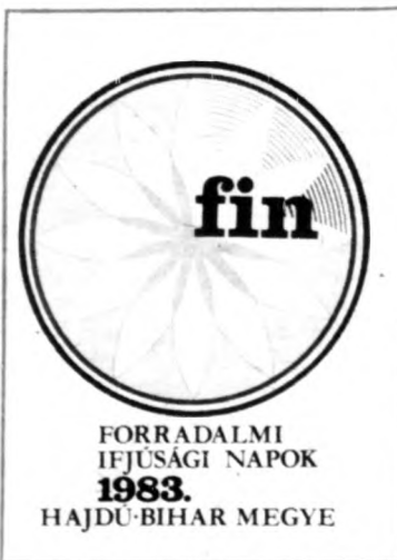
FORRADALMI IFJUSÁGI NAPOK 1983. HAJDÚ-BIHAR MEGYE

Az Ybl Napok keretében kerül sor ma délután két órakor Vadász György építész kiállításának megnyitására a főiskolán. A sci-fi