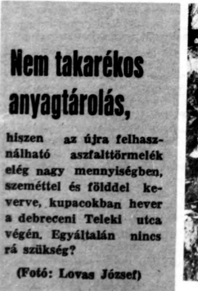
Nem takarékos anyagtárolás, hiszen az újra felhasználható aszfalttörmelék elég nagy mennyiségben, szeméttel és fűvel keverve, kupacokban hever a debreceni Teleki utca végén. Egyáltalán nincs rá szükség?

Nagyon jó és hasznos lenne, ha városunk lakói minden segítséget megadnának ahhoz, hogy a tavaszi nagytakarítás eredményes, környezetünk tiszta és ápolat legyen. Nem nagy dologról van szó, mindössze arról, hogy mindenki tegye rendbe a saját háza táját, ne szemeljen az utcákon, a parkokban, egyszerűen törődjön egy kicsit többet városának tisztaságával. Szeretnénk, ha ezt nem kérnénk hiába.