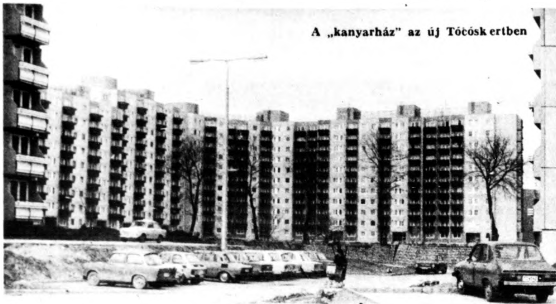
A „kanyarház” az új Tócsókertben

Vajon honnan ered ez a lakótelep-ellenesség? Valljuk be, az első házigyári elemekből készült házakkal beépített lakótelepeink létrehozásának van ebben valódi részük. Amikor működni kezdtek a házigyárak, s lehetővé vált, hogy minden eddigénél nagyobb gyorsasággal hozzanak létre lakóházakat,