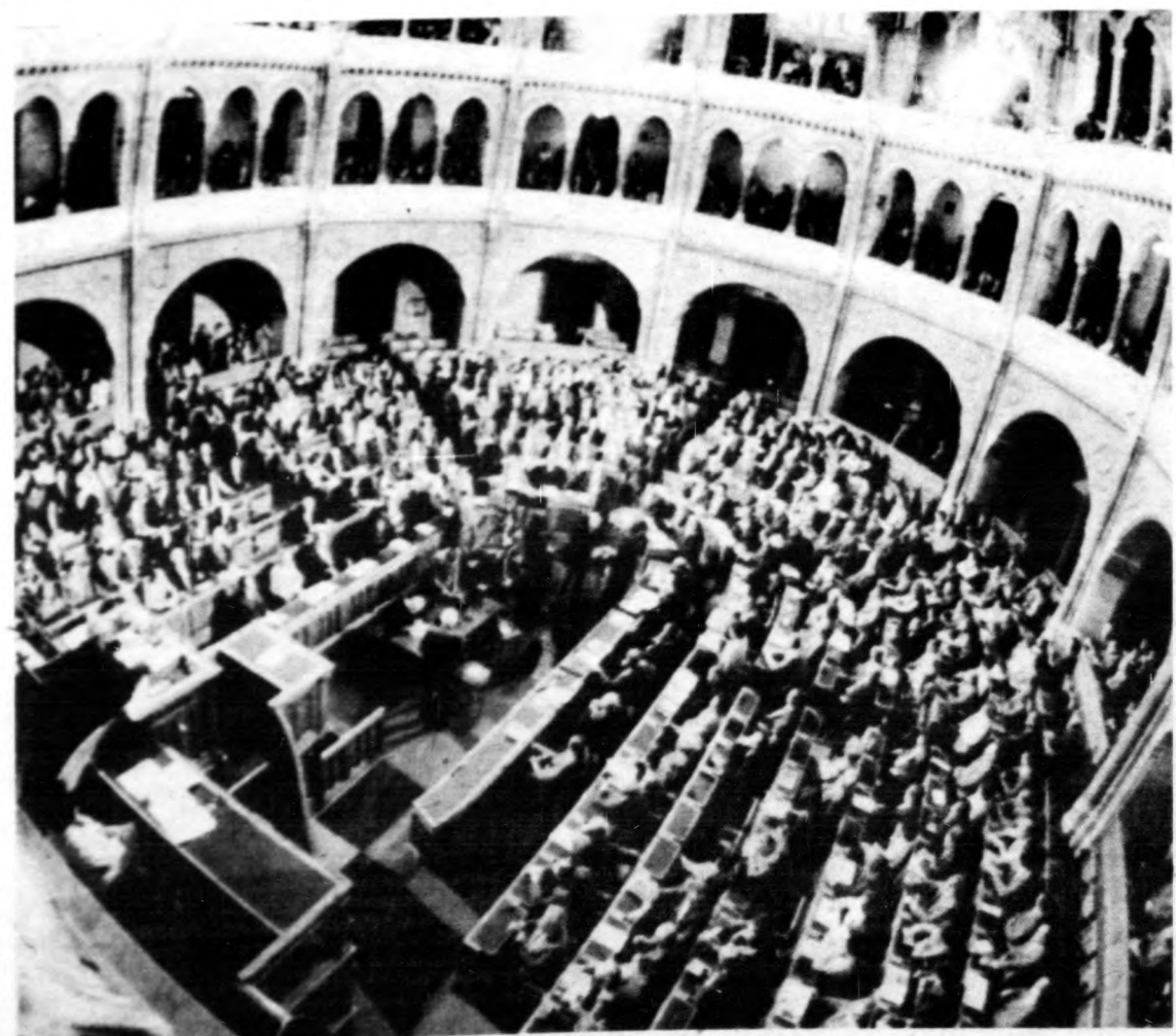
Az ülésterem.

elnökének első helyettesévé nevezte ki — jelentették be csütörtökön hivatalosan Moszkvában.