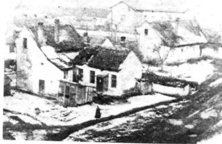
Itt voltak a bolgárkertek