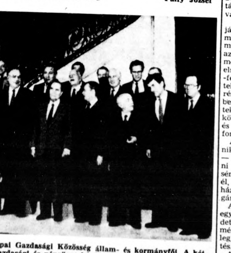
Brüsszelben tanácskoztak az Európai Gazdasági Közösség állam- és kormányfői. A két-napos értekezlet középpontjában gazdasági és pénzügyi kérdések álltak

Nemes egyszerűséggel így nyilatkozott Ronald Reagan: „valamikor majd a biztonságot nem kell többé a feltelesen amerikai válaszcsoport elvére építeni, hiszen az új fegyverrel elfoghatnánk és megsemmisíthetnénk a rakétákat, mielőtt azok elérhetnék országunk területét vagy