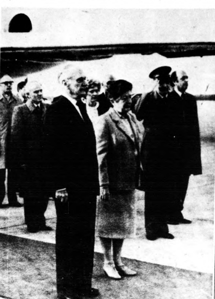
Jugoszláviába látogatott a szovjet miniszterelnök. Képünkön Nyikolaj Tyihonovot a belgrádi repülőtéren Milka Planinica, a szövetségi végrehajtó tanács (kormány) elnöke fogadta

Párizsban azt szerették volna, ha csak a nyugatnémet márkát értékelték volna fel, s ha el lehetett volna kerülni a francia franknak körülbelül immár harmadik devalválását. A végén olyan kompromisszum született, amely szerint a márkát 5,5 százalékkal értékelték fel,