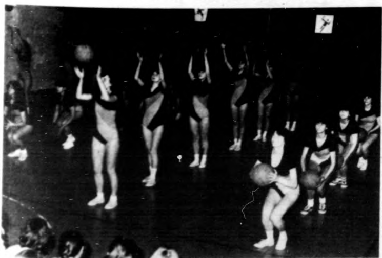
Lányok látványos labdagyakorlata