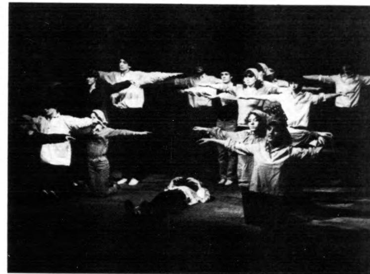
Minden jó madár társat választ (Tóth Árpád Gimnázium és KPVDZS)