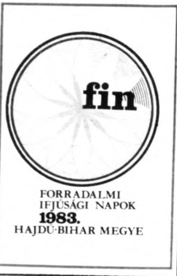
FORRADALMI IFJÚSÁGI NAPOK 1983. HAJDÚ-BIHAR MEGYE