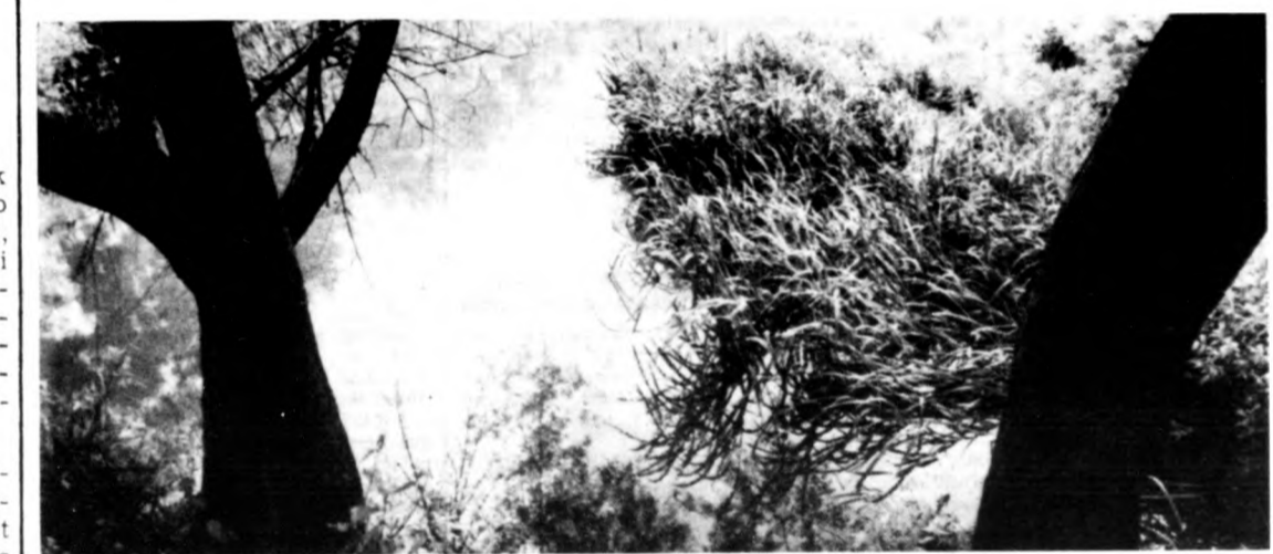
VADÁSZ GYÖRGY: VÍZIVILÁG 1—2.

A nevezési feltételek a következők: az említett városok mindegyike vonja be összes közép- és felsőfokú oktatási intézményeit a diákhagyományok, -szokások és tárgyi