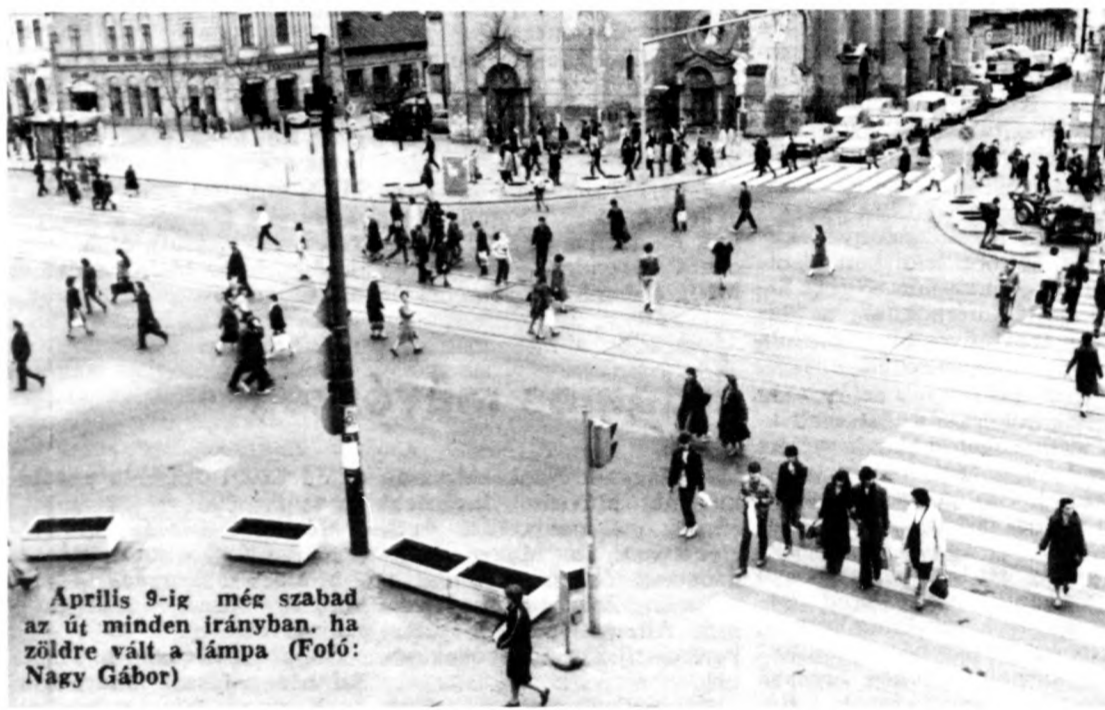
Április 9-ig még szabad az út minden irányban, ha zöldre vált a lámpa.