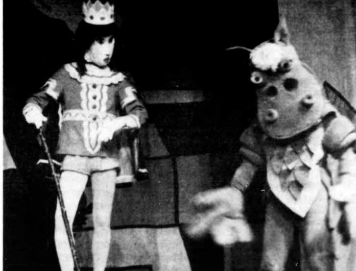
A királyfi és Süsü jelenete