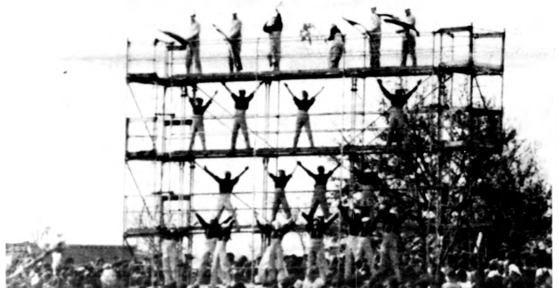
Részlet az ünnepi műsorból