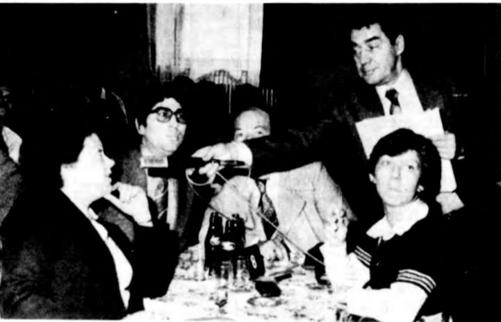
Az MGM csapatát kérdezi a játékező

Az általános iskolákból a városi döntőbe jutott huszonkilenc csapat az újkerti nevelési központban vetélkedett. Első a Kardos utcai Általános Iskola, második a Ságvári Általános Iskola és