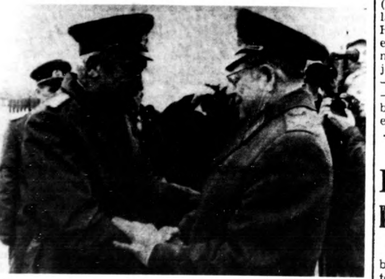
Dmitrij Usztyinov szovjet honvédelmi miniszter Berlinbe érkezett. A képen Heinz Hoffmann (balra), az NDK honvédelmi minisztere üdvözi a repülőtéren

A Berlin—schönefeldi rep- ülőtéren Heinz Hoffmann, az NDK nemzetvédelmi mi- nisztere üdvözölte a szovjet vendégeket.