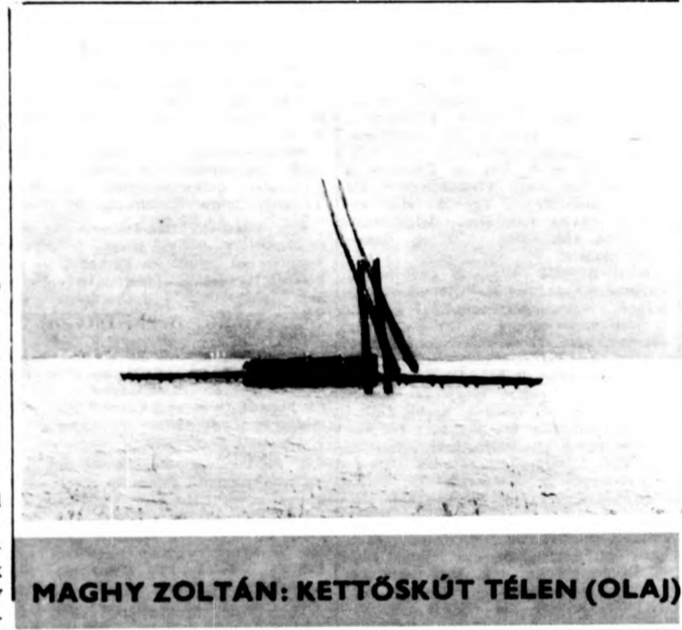
MAGHY ZOLTÁN: KETTŐSKÚT TÉLEN (OLAJ)