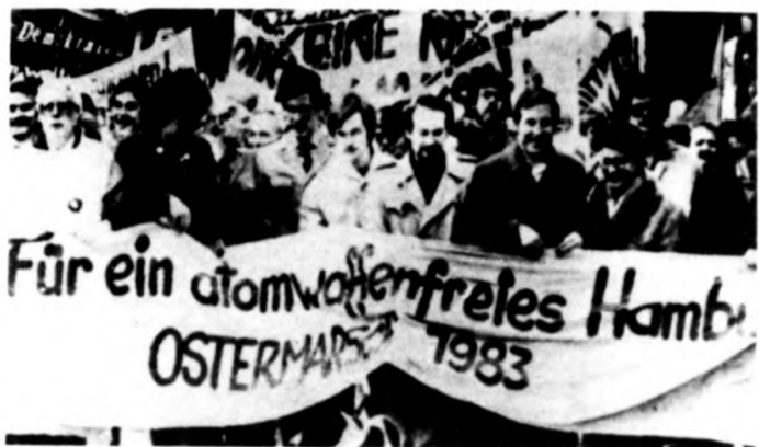
Az NSZK-ban több százezer ember vett részt a hűsvéti békemeneteken. A képen „Az atomfegyvermentes Hamburgért” felirattal vonulnak a békemenet résztvevői