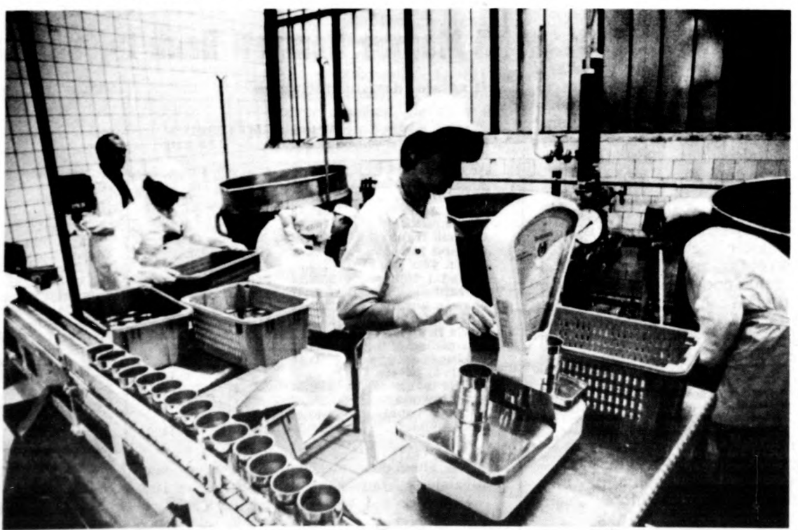
Paradicsomos babot készítenek a versenyzők

A verseny csütörtökön délelőtt írásbeli feladatok megoldásával kezdődött, délután pedig a gyakorlati versenyre került sor a gyárban. Ma reggel nyolc órától szóbeli versenyekkel folytatódik a program, délután kerül sor az eredményhirdetésre.