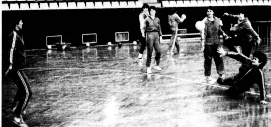
Szarvas beállós játéka sokat fejlődött