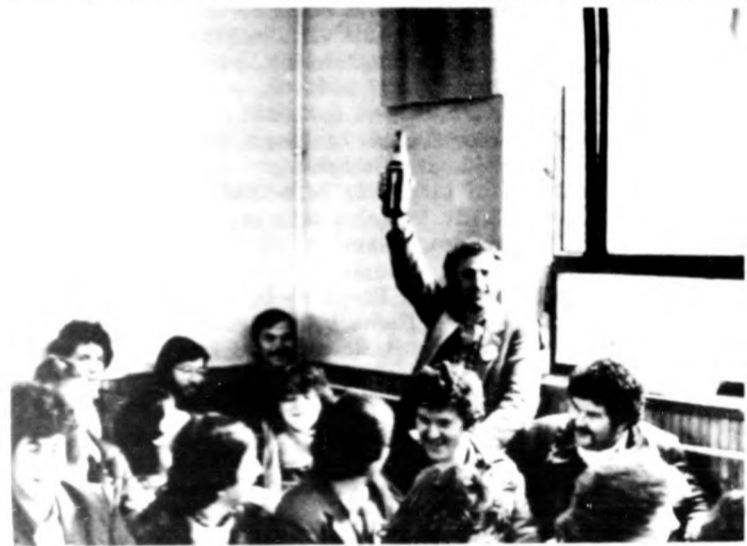
A Király Zsuzsanna ifjúsági klub postás fiataljai pezsgőbontással ünnepelték meg aranykoszorús címüket

kockái peregnék. A pódiumteremben meg mindig változhat az a tüzözmancók, keramiak, hanglemezek között, az ebédig nyitva tartó polkaszinóban pedig tizenegy játékos klubosai — szellemi és ügyességi feladványokkal — edzheted képességeidet.