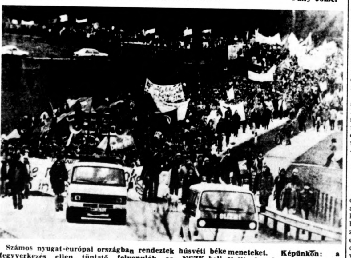
Számos nyugat-európai országban rendeztek húsvéti béke meneteket. Képünkön: a fegyverkezés ellen tüntető felvonulók az NSZK-beli Kellinghuseban