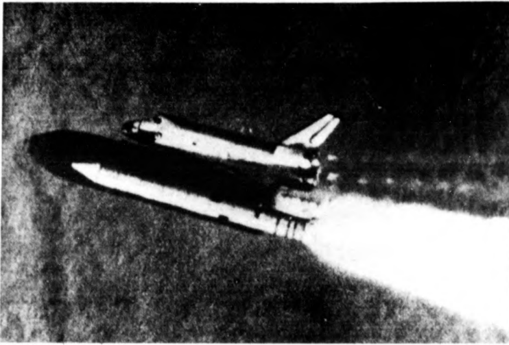
Újabb próbaútját tett meg az amerikai űrrepülőgép. Képünkön: a Challenger űrsikló a fellevés útján

A világsajtó nagy érdeklődést tanúsított a prágai ülés iránt, a közleményt alaposan elemezték a kommentátorok, kiemelve, hogy annak hangneme semmiképp sem polemikus, hanem a javaslatok kaptak nyomtatékot.