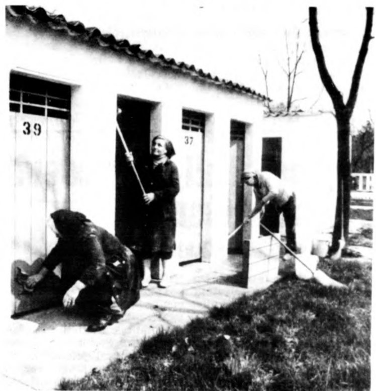
Festik, takarítják a kabinokat

A belépőjegyek ára mindhárom strandunkon változatlan marad — kaptuk végeztül az egyik leglényegesebb információt.