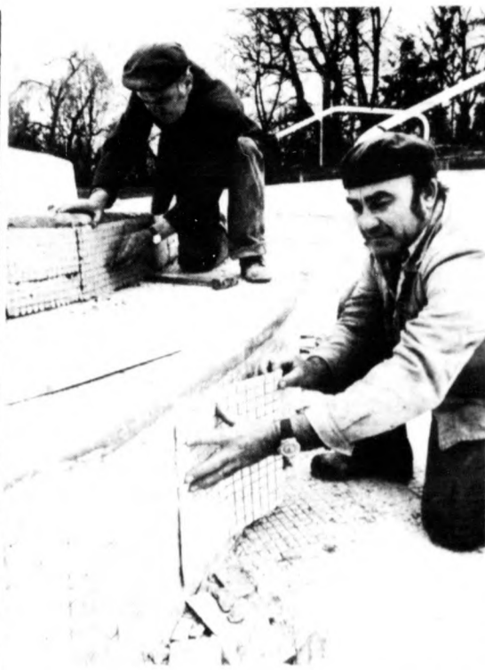
Javitják a melegvízes medence csempeburkolatát

Ujdonság volt, hogy nem az iskolai diáknapok választották ki a legjobbnak ítélt produkciókat a további versenyre, hanem közvetlenül a megyei KISZ-bizottságokon jelentkezettek azok, akik részt kívántak venni a minősítő bemutatókon. Az amatőr művészek, illetve művészeti csoportok 16 kategóriából választhattak, többek között fellephettek énekarok, kamarakörök, szólóénekesek, diákszínpadok, vers- és prózamondók, bábosok, néptáncosok, parodisták és búvészek. A legszínvonalasabb produkciókból a rendezők és a zsűri szakemberei a megyék és a főváros diákművelődését reprezentáló, mintegy másfél órás műsort szerkesztettek, s ezekkel neveztek a megyék kiválasztott képviselői az országos fesztiválra. A fesztiváldíjakat azok a megyei csoportok kapták, amelyek a színvonalasabb produkciót mutatják be.