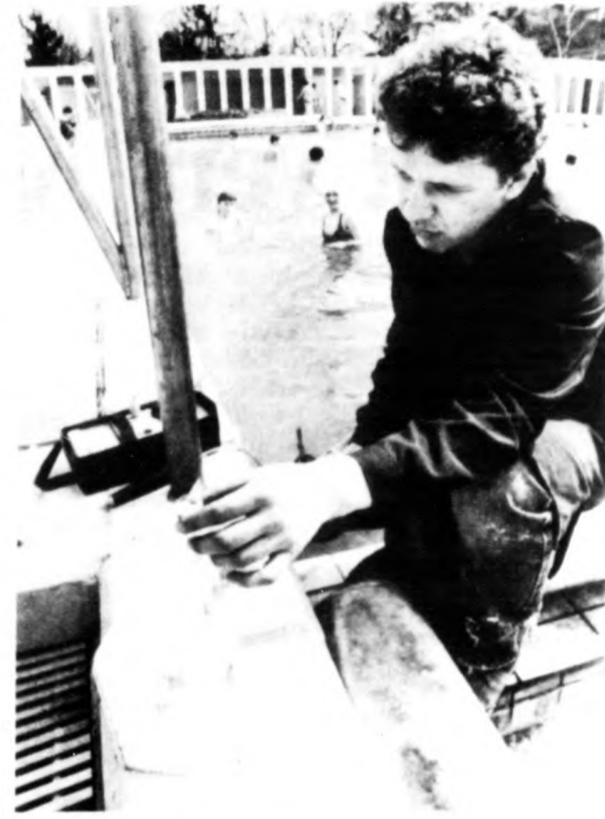
A télen-nyáron használt medence vízszigetelést ellenőrzik