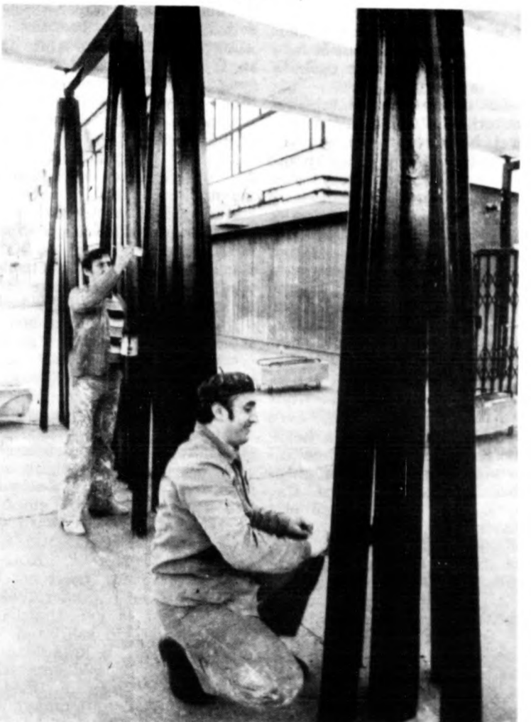
Újrafestik a bejáratnál levő oszlopokat

várjuk Gerlóczy professzor vizsgálatainak eredményét. Addig nem tanácsolom senkinek, hogy az elhunyt lakásában időzzék. — Pecsételjük le a lakást? — kérdezte Zelenka gyakorlatiasan. — Erre most nem tudok határozottan válaszolni. — Miért nem? — Mert mindinkább megerősödik a gyanúm, hogy egyedi eset van dolgunk. — Igaza van, doktor, szükség-telenül ne akadályozzuk az áll-lampolgárok mozgási szabadságát — mondta Zelenka hivatalos hangon, hozzám fordult. — A temetést a boncolási jegyzőkönyv alapján engedélyezem.