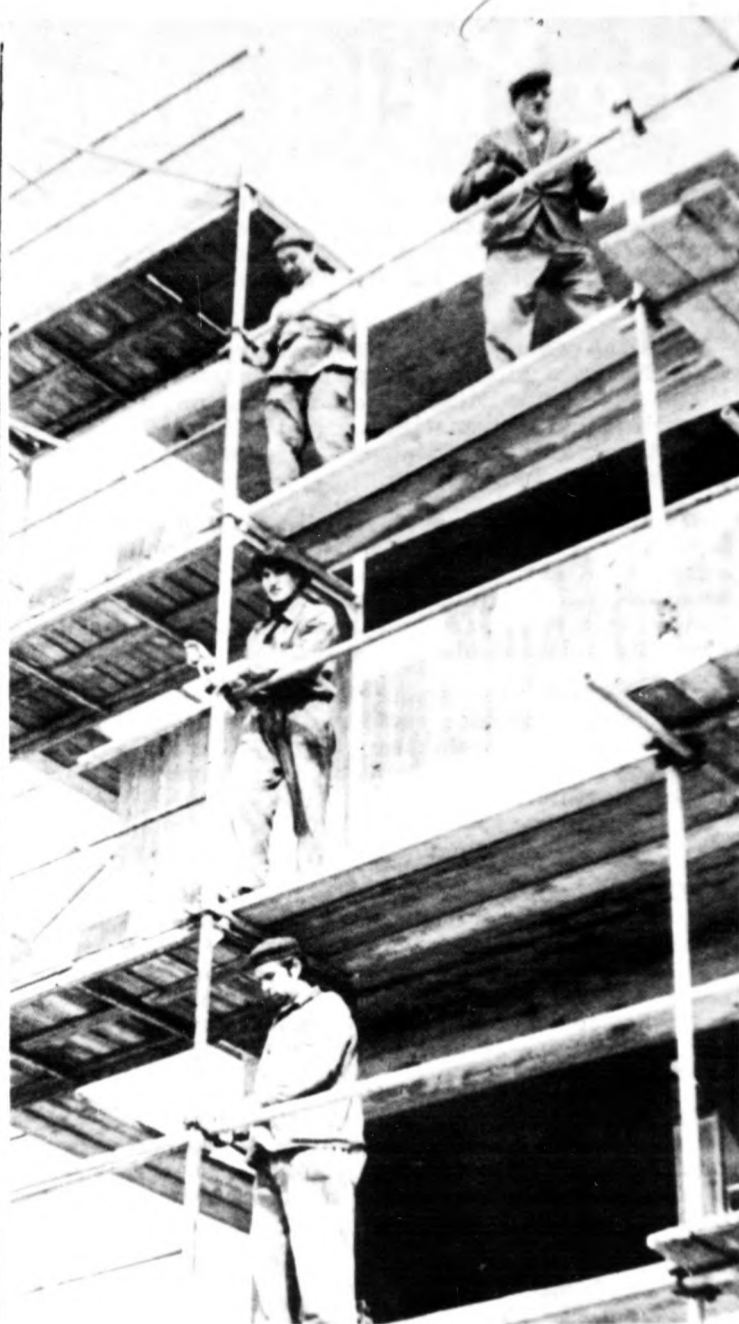
Dolgoznak az állványozók a debreceni tüztőlaktanya építkezésén.

Áprilisban eddig 10—11 milliméter csapadékot kapott Debrecen környéke. Tekintettel a talaj el nem oltott vízhiányra, minden bizonyítással kell majd az öntözővíz. Mint arról korábban beszámoltunk, a száraz, szeles márciusi napokban, híven jó hagyományokhoz, a kábel Voros Csillag Termelőszövetkezet és a Hajdúszoboszlói Állami Gazdaság már öntöztek. A megyében összesen 27 ezer hektár öntözéshez van vízjogi engedély, s ami a feltételeket illeti, a Tisza menti Regionális Vízmu és Vizgazdálkodási Vállalat idejében elkészült az öntözőcsatornák kimosásával, a szivattyúk, illetve az AC-telepi nyomásközpontok felújításával, karbantartásával. Az üzemek 24 ezer hektár öntözésére kötöttek szerződést. Ehhez jönnek a mintegy 5800 hektáron elterülő halastavak, amiknek a feltöltése március elején kezdődött és ma is tart.