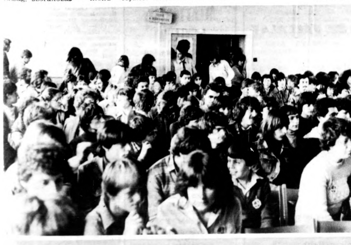
Harminckét klub tagjai — a Re-Show koncertjére várva

Hallhattunk a beszámolóban több pályázatról is. Az egyik körműsorokra hirdette-tett meg, s eredményeként tizenöt ifjúsági klubban amatőr és hivatásos műv-művek adnak műsort, tartanak játékos foglalkozásokat és ismeretterjesztő rendezvényeket. A másik pályázat klubtalálkozókat szervezésére buzdít. A debreceni kezdeményezésből született felhívásra eddig Berettyóújfaluból, Püspökkladányból, Debrecenből és Hajdúszoboszlóról jelentkeztek, ám akik még csak most törk a fejüket ötletesebbnél ötlete-