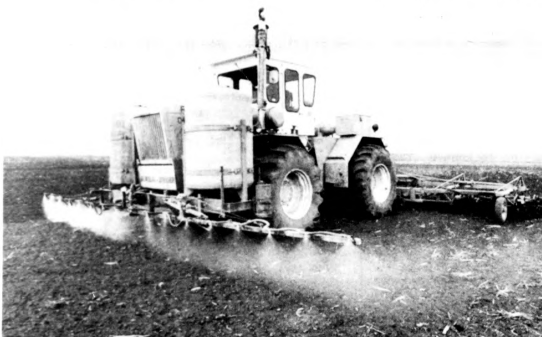
Talaj-előkészítés a kukorica vetéséhez