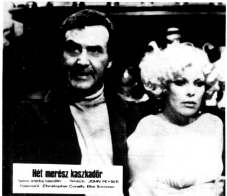
Hét merész kaszkadőr