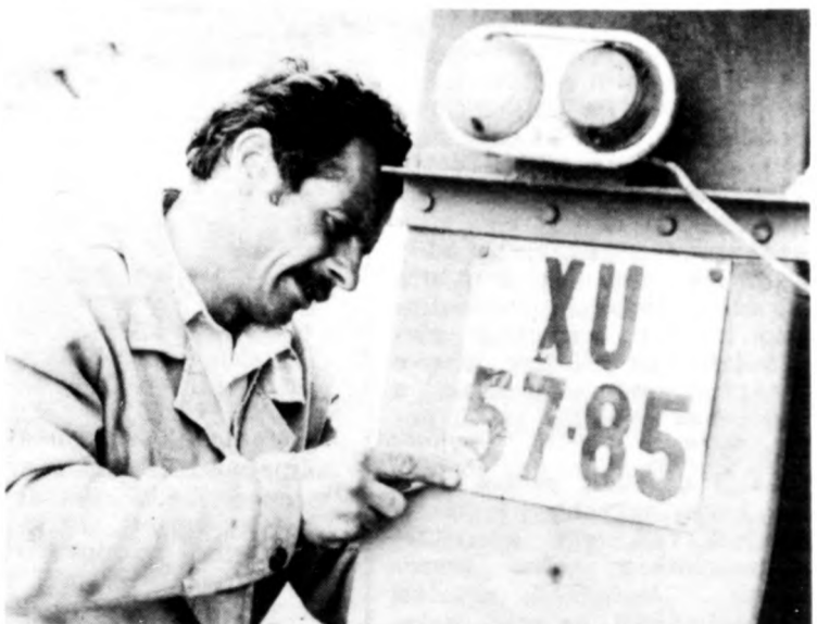
Ettől a rendszertől az ellenőrzés után azonnal meg kell válni