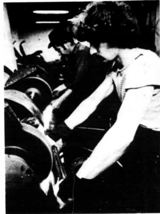
Élesre, mint a borotva!