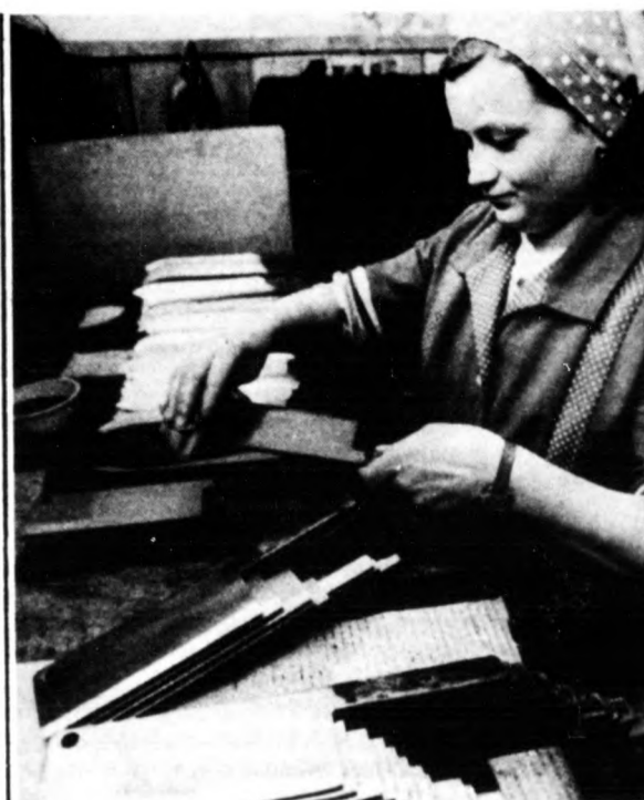
Útra készül a bárd