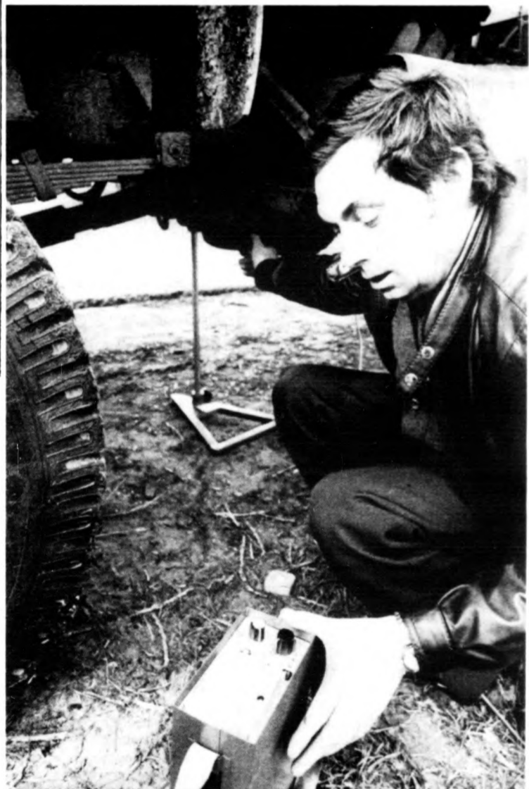
A kipufogógázok koromtartalma szennyezi a környezetet. Ezt is műszerrel vizsgálják

A rendezvény sorozat ki- emelkedő eseménye lesz ápr- ilis 20-án az építési fórum, helve a városi művelődési központ. Itt a kiállítók és a rendezők válaszolnak az ér- deklődők kérdéseire.