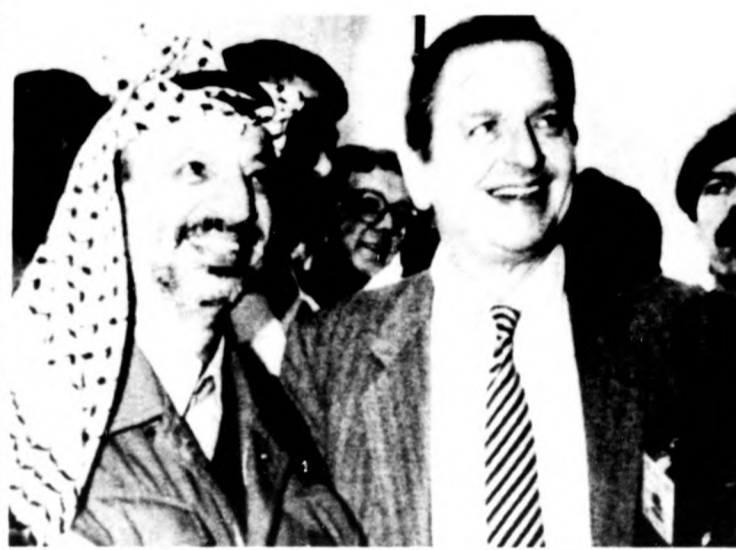
Jasszer Arafat, a PFSZ vezetője Stockholmban tárgyal Olof Palmé svéd miniszterelnökkel (a képen jobbra) és más skandináv szociáldemokrata politikussal.