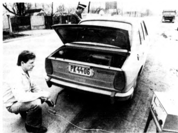
Infrayt—8 elnevezésű berendezéssel vizsgálták az akció során a kipufogógázok szén-monoxid-tartalmát (A megengedett 4,5 százalék)

Fokozott közúti ellenőrzés volt a megyében