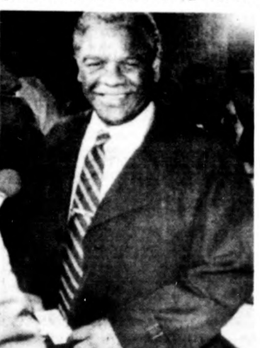
Chicago első feketebőrű polgármestere, Harold Washington demokrata párti politikus nyerte a helyhatósági választásokat az amerikai nagyvárosban.

BELGRÁD, (MTI) Kosovo autonóm tartomány székhelyén, Pristinában és a tartó-