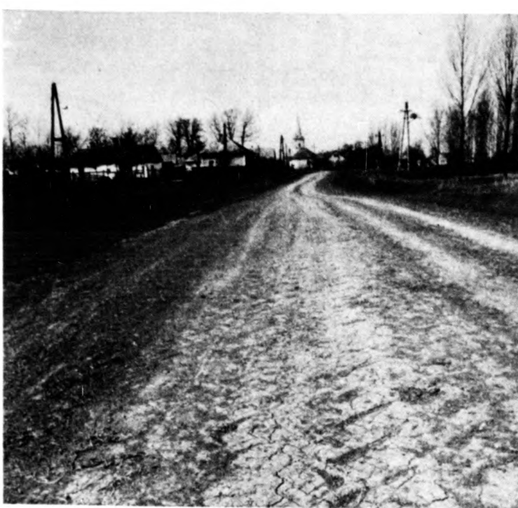
Ez az út télen járhatatlan

A faluban sok megőrzendő emlék található. Egy gyönyörű park közepén régi kastélyszerű épület áll, kitéve az idő romboló hatásának. Pedig de csodálatos pihenőházat, üdülőt, szociális otthont lehetne csinálni! A tanácsnak — mármint a nagyközségi tanácsnak — azonban lapos a pénztárcája. A rendelkezésre álló 400 ezer forintot rendszeresen a vízhálózat bővítésére fordítják. Természetesen közös elhatározás szerint. Pedig az épületet 2-3 millióból helyre lehetne állítani. Az induláshoz elegendő lenne egymillió is, ebből legalább a tetőt rendezni lehetne hozni. A község ragaszkodik a romos kastélyhoz, de valószínű az lesz a vége, hogy lebontják.