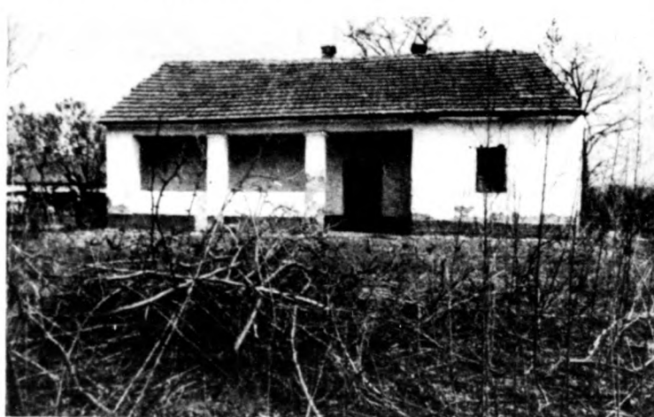
Bihardancsháza, Kossuth utca 25. — egy az elhagyott házak közül

A szép park mellett társadalmi összefogással futballpályát és öltözőt készítettek a helyi csapatnak. A faluban három bolt, orvosi rendelő, gyógyszerész, iskola, óvoda van. Igaz, az óvoda már lassan szűk lesz az ötvenkét éveseknek. A gyerekek jól érzik magukat a szép, füves udvaron. Bihar-tordán ugyan még az út menti árok partján levő fű is selymes, mélyzöld, hiszen erre kevés autó jár. Kevés az autó, de annál