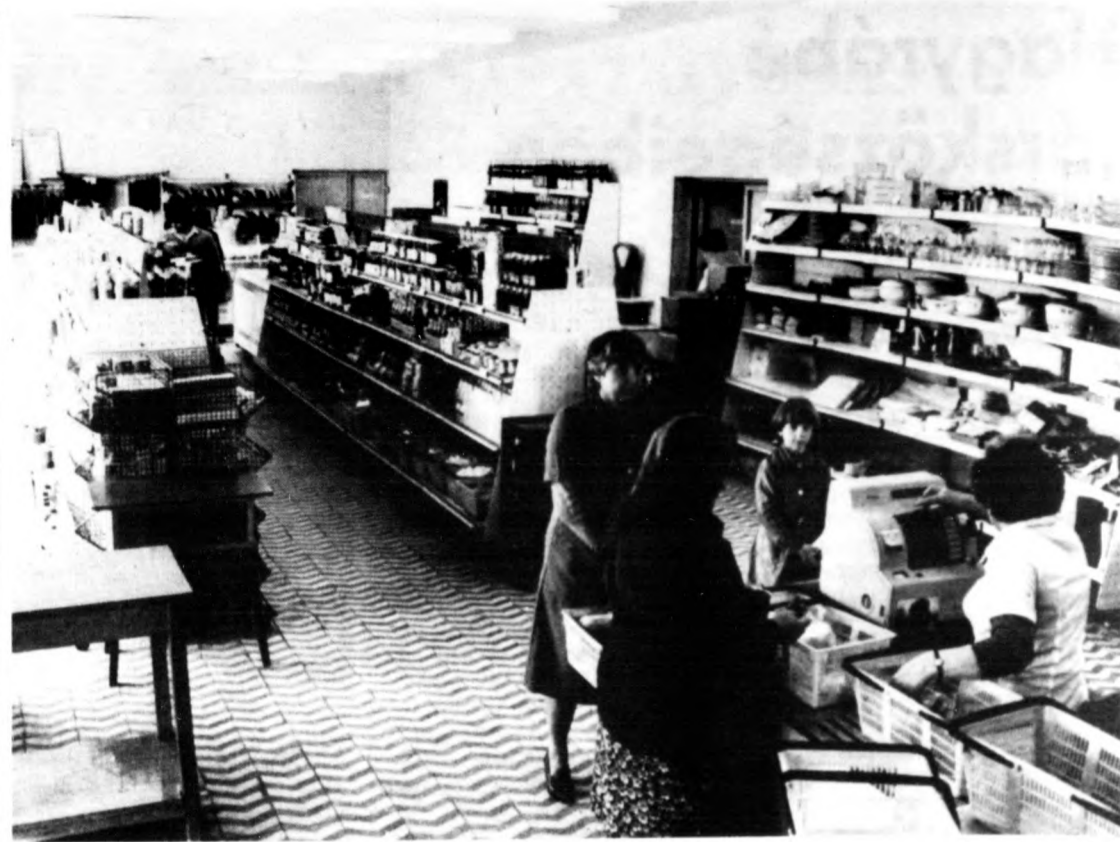
„Iparkodik a tanács: szép kis ABC-t építettek nemrégiben”