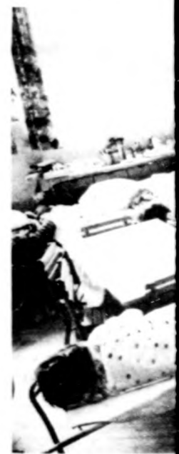
Délutáni pihenő a

Ma körülbelül lakják a hangu falut. Sok az új h hogy nem élnek helység lakói. Ez sorban a jól műk Ezüstkalász Ter kezét érdeme.