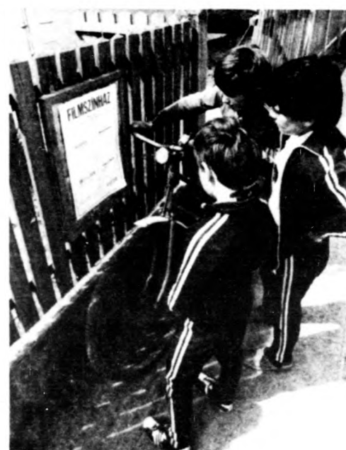
Mi lesz a műsor?