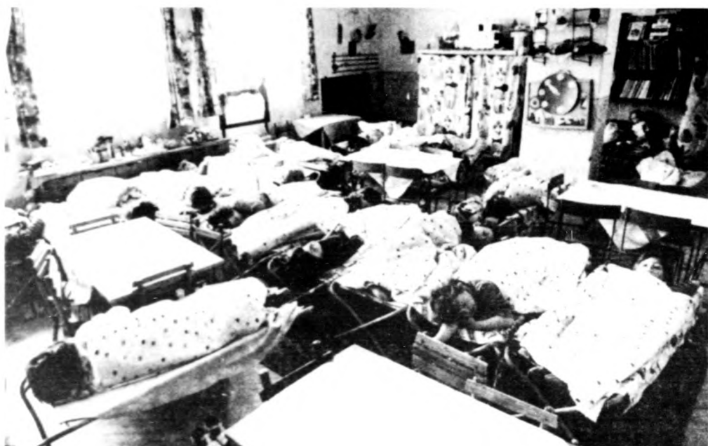
Délutáni pihenő az óvodában